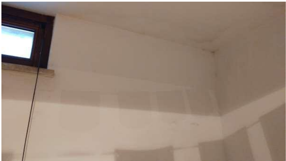
foto n. 24 – formazione di umidità e condensa sul soffitto del locale seminterrato fronte strada dell'unità immobiliare con ingresso da Piazza Salvo D'acquisto 8, affittata a [REDACTED]