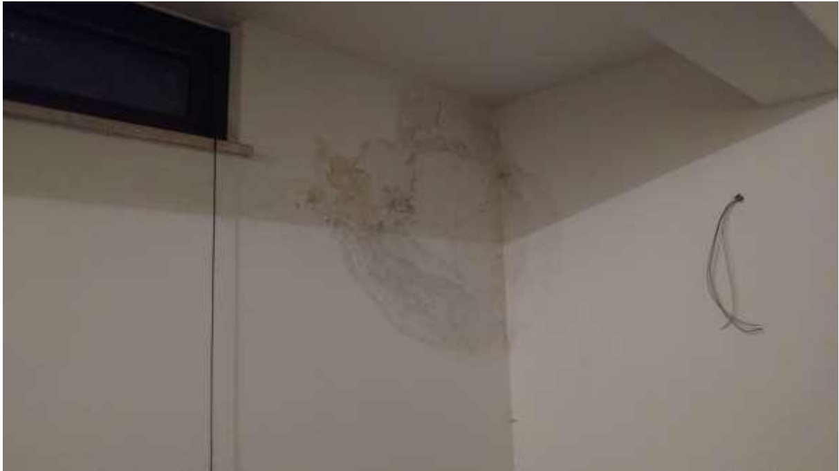
foto n. 47 – infiltrazioni di acqua meteorica sul soffitto/parete del locale al piano seminterrato (lato fronte strada) dell'appartamento con ingresso da via Giuseppe Impastato 19 affittato a [REDACTED]