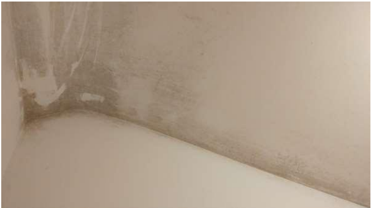
foto n. 26 – formazione di umidità e condensa sul soffitto del locale mansarda dell'unità immobiliare con ingresso da Piazza Salvo D'acquisto 8, affittata a [REDACTED]