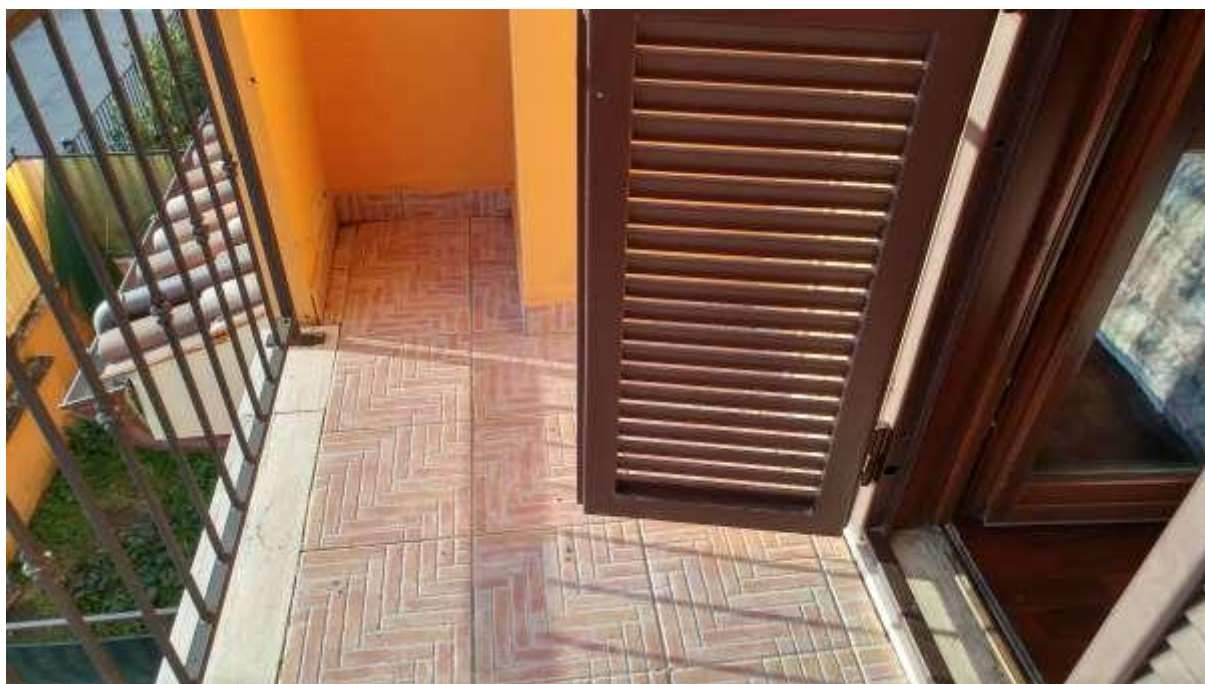
foto n. 18 – balcone con accesso dalla stanza da letto del piano primo dell'unità immobiliare con ingresso da Piazza Salvo D'acquisto 13, affittata a [REDACTED]