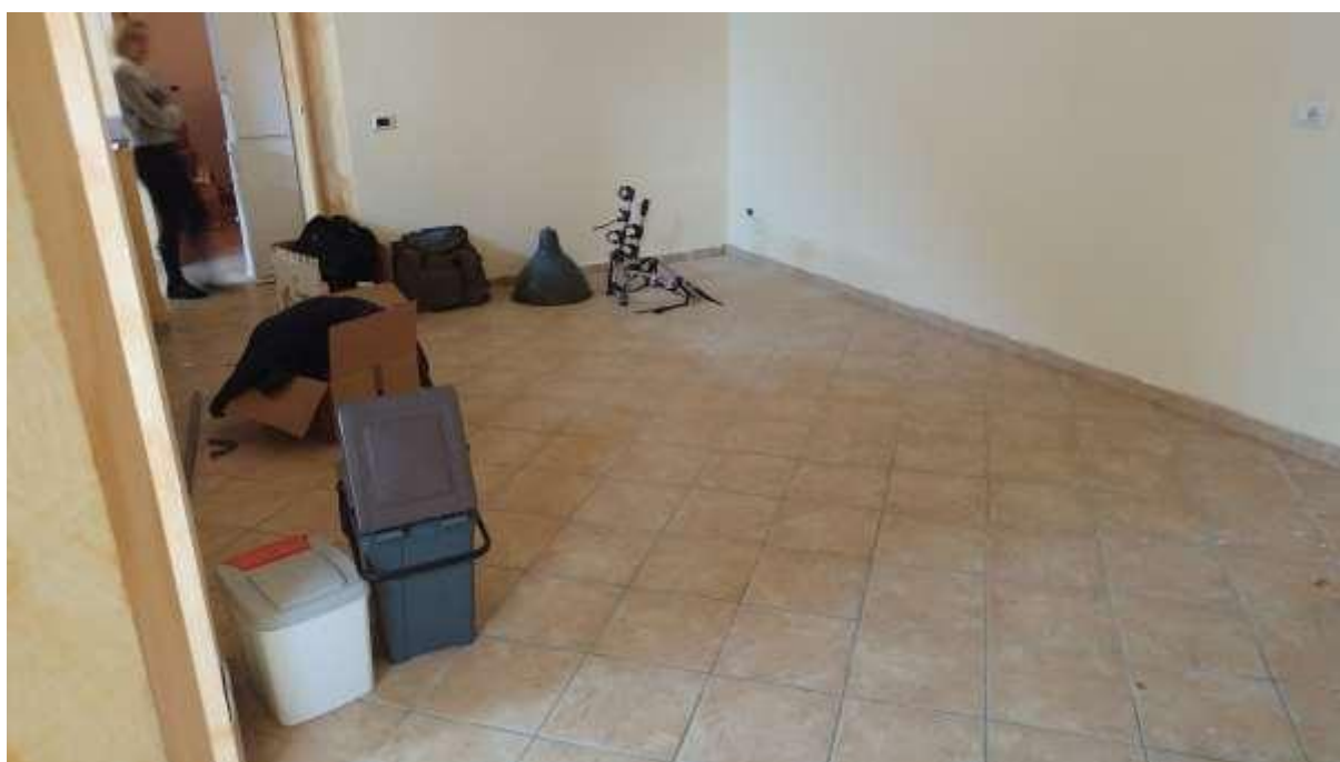
foto n. 12 – locale al piano seminterrato dell'unità immobiliare con ingresso da Piazza Salvo D'acquisto 13, affittata a [REDACTED]