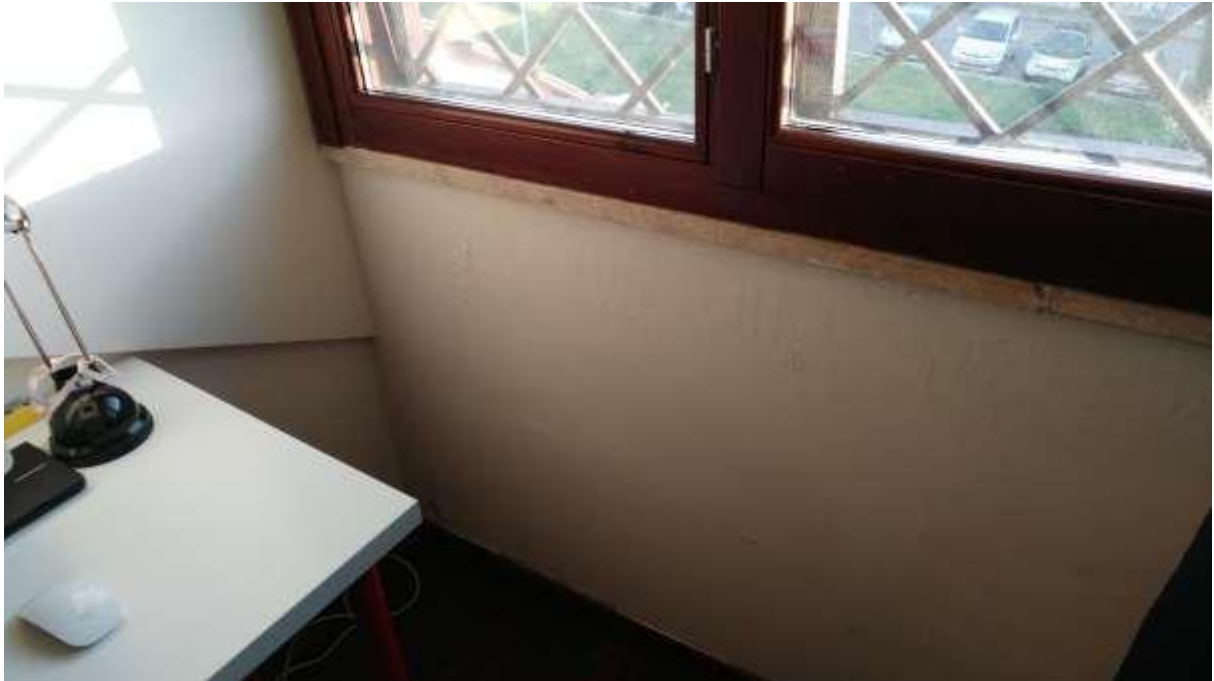
foto n. 27 – ingresso di acqua meteorica dall’infisso esterno al piano mansarda dell’unità immobiliare con ingresso da Piazza Salvo D’acquisto 8, affittata a [REDACTED]