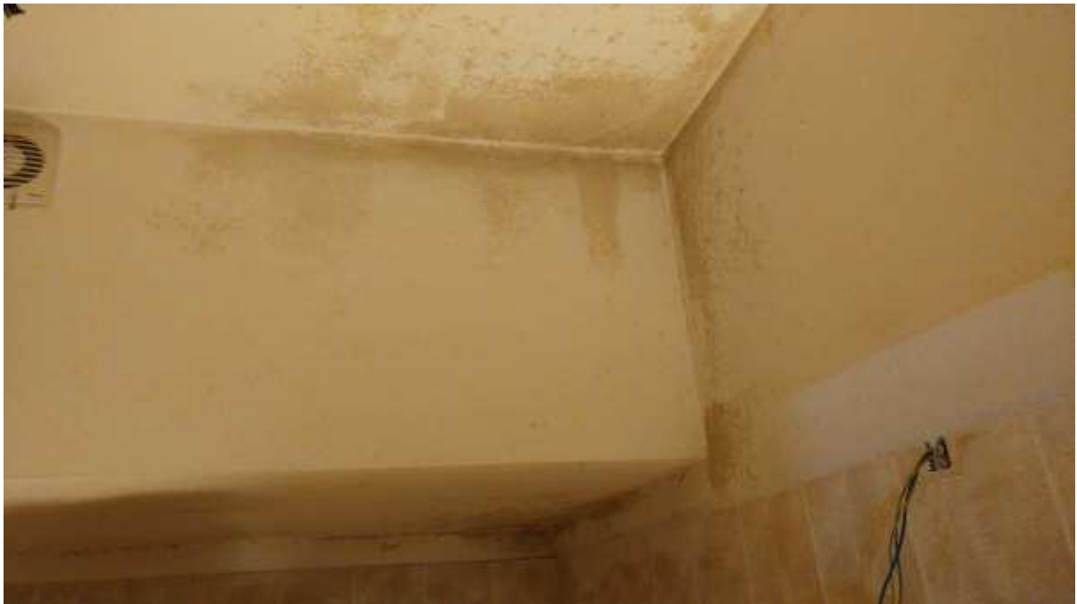
foto n. 30 – formazione di condensa sul soffitto del servizio igienico al piano seminterrato dell'unità immobiliare con ingresso da Piazza Salvo D'acquisto 9, affittata a [REDACTED]