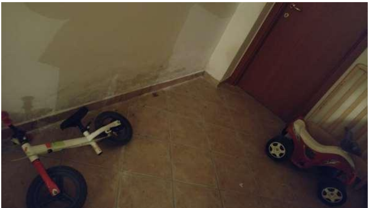
foto n. 48 – umidità di risalita al piede delle murature del locale al piano seminterrato dell'appartamento con ingresso da via Giuseppe Impastato 19 affittato a [REDACTED]