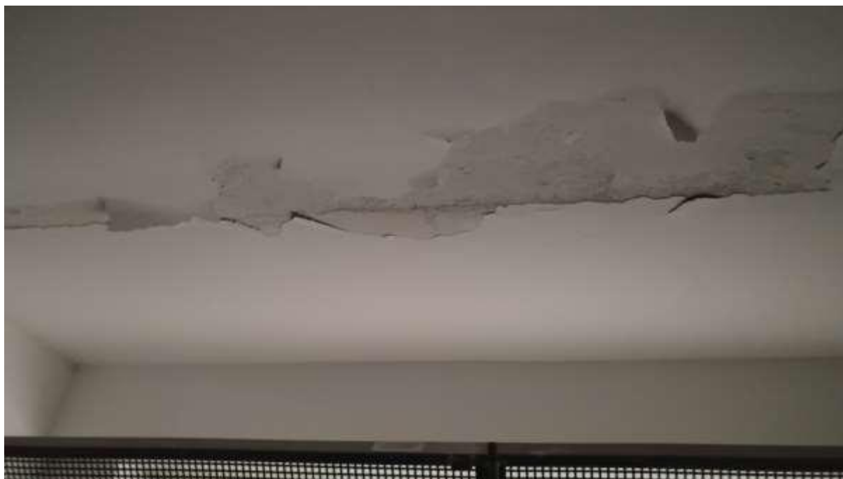
foto n. 34 – infiltrazioni di acqua con distacco di intonaco dal soffitto dell'autorimessa al piano seminterrato dell'appartamento con ingresso da via Giuseppe Impastato 25 affittato a [REDACTED]