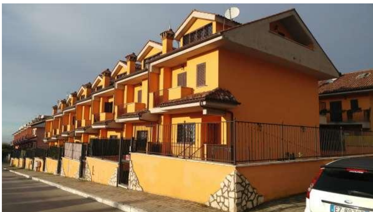
foto n. 2 – vista di insieme delle n. 14 unità immobiliari in Rocca di Papa (foglio 8 part. 1119), con ingresso tra la via Giuseppe Impastato e Piazza Salvo D'Acquisto