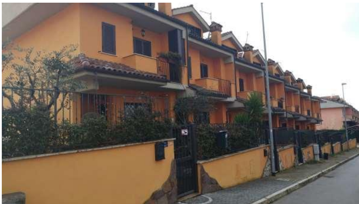
foto n. 1 – vista di insieme delle n. 14 unità immobiliari in Rocca di Papa (foglio 8 part. 1119), con ingresso tra la via Giuseppe Impastato e Piazza Salvo D'Acquisto