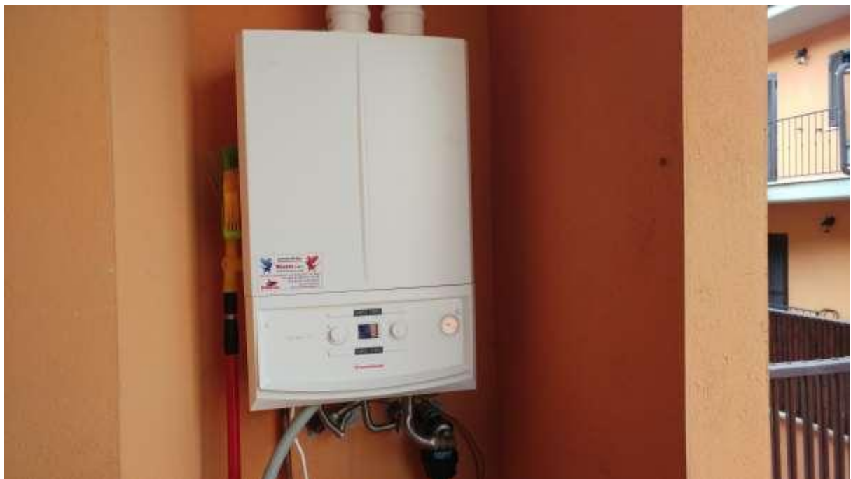
foto n. 16 – caldaia installata al piano rialzato (lato cucina) per produzione acqua calda sanitaria e riscaldamento