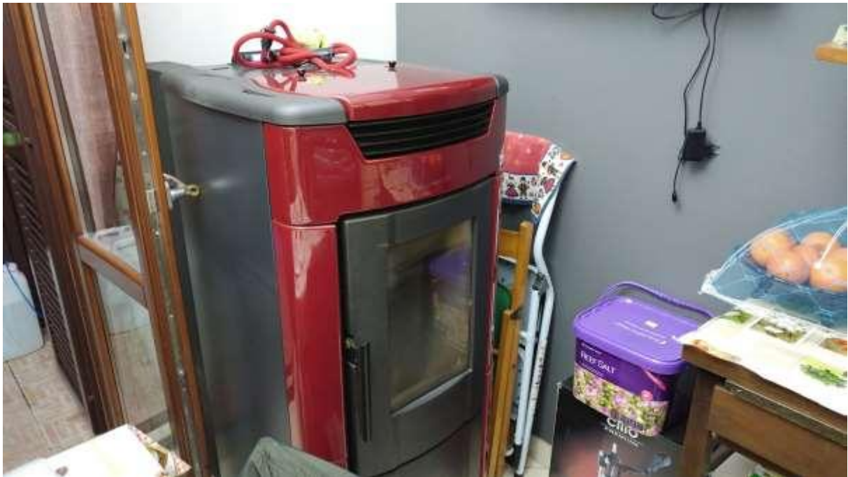
foto n. 46 – stufa a pellet installata al piano rialzato nell'appartamento con ingresso da via Giuseppe Impastato 13 affittato a [REDACTED]