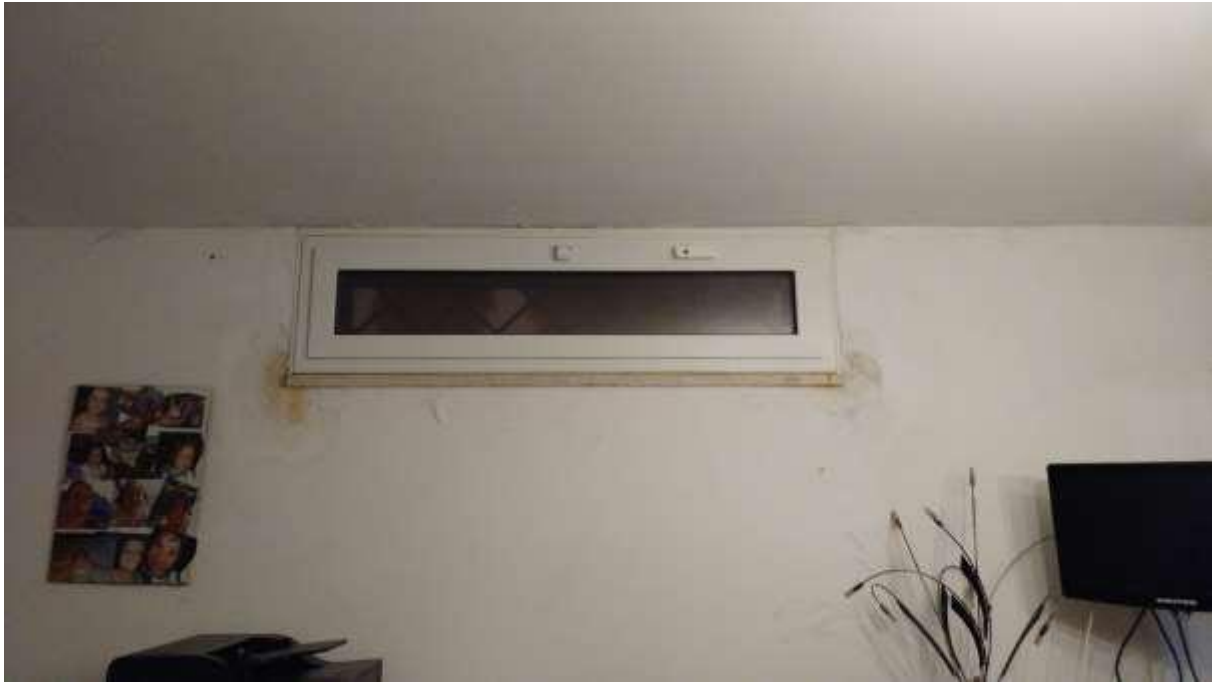
foto n. 45 – infiltrazioni di acqua meteorica dalla presa di luce ed aria nel locale al piano seminterrato dell'appartamento con ingresso da via Giuseppe Impastato 13 affittato a [REDACTED] i