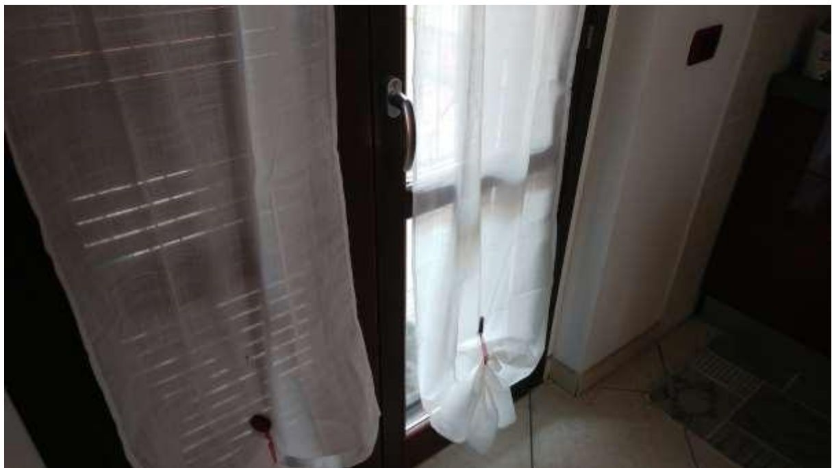
foto n. 8 – infissi esterni al piano rialzato dell'unità immobiliare con ingresso da Piazza Salvo D'acquisto 13, affittata a [REDACTED]