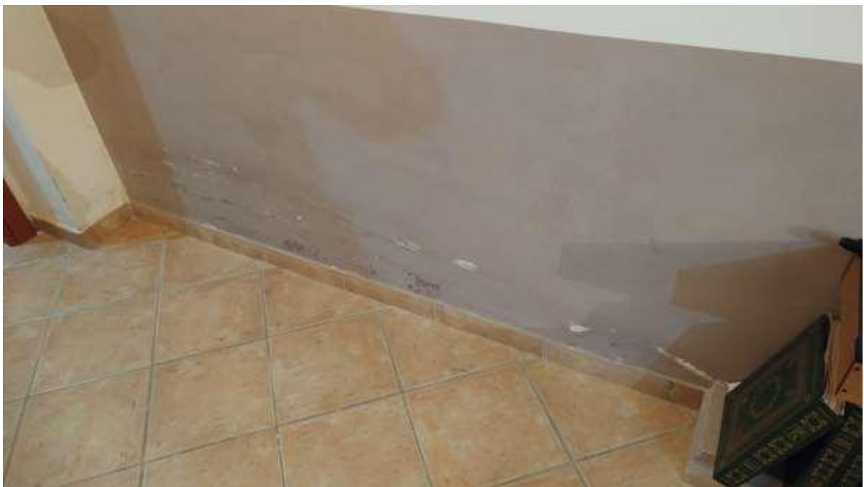
foto n. 38 – umidità di risalita al piede delle murature del piano seminterrato dell'appartamento con ingresso da Piazza Salvo D'Acquisto 11 affittato a [REDACTED]