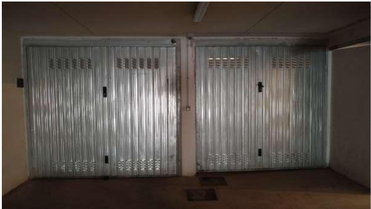
foto n. 5 – accessi al piano interrato alle due unità immobiliari foglio 8 part. 1119 sub 29 e 30 ad uso cantina, anche se con accessi analoghi a quelle delle altre autorimesse