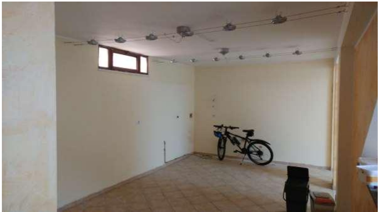
foto n. 15 – locale al piano seminterrato dell'unità immobiliare con ingresso da Piazza Salvo D'acquisto 13, affittata a [REDACTED]