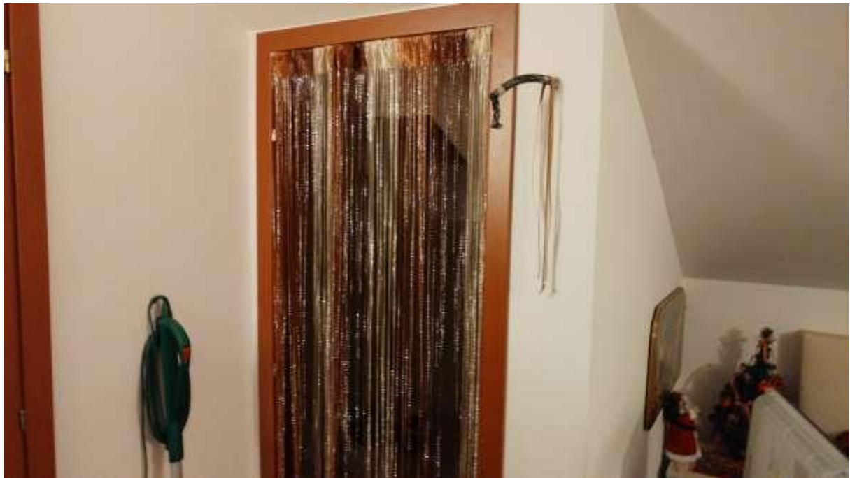
foto n. 49 – mancanza di porta al piano mansarda nell'appartamento con ingresso da via Giuseppe Impastato 19 affittato a [REDACTED]