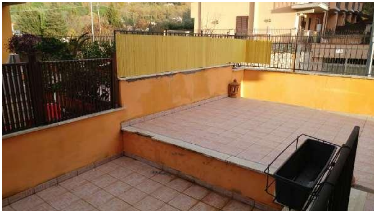
foto n. 17 – terrazzo al piano rialzato annesso all'unità immobiliare con ingresso da Piazza Salvo D'acquisto 13, affittata a [REDACTED]