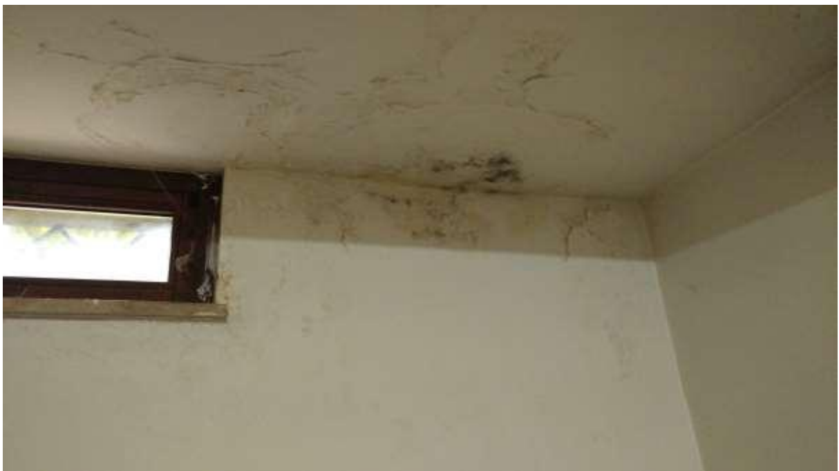
foto n. 28 – evidenti infiltrazioni di acqua sul soffitto del locale seminterrato fronte strada dell’unità immobiliare con ingresso da Piazza Salvo D’acquisto 9, affittata a [REDACTED]