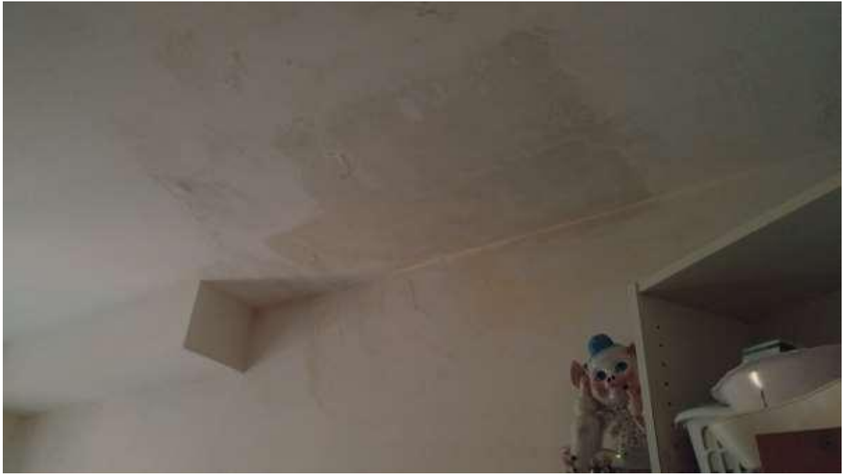
foto n. 29 – esiti di una pregressa perdita di acqua dal soprastante servizio igienico, sul soffitto del servizio igienico del primo piano dell'unità immobiliare con ingresso da Piazza Salvo D'acquisto 9, affittata a [REDACTED]