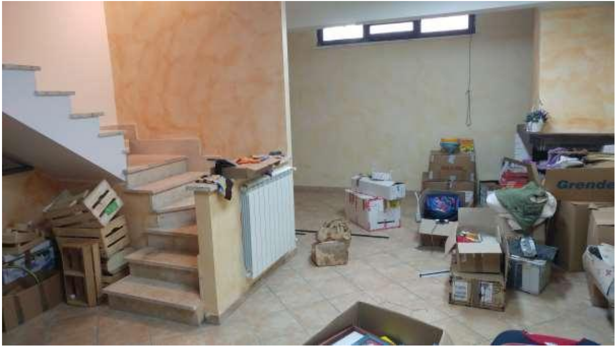
foto n. 13 – locale con angolo cottura e camino al piano seminterrato dell'unità immobiliare con ingresso da Piazza Salvo D'acquisto 13, affittata a [REDACTED]