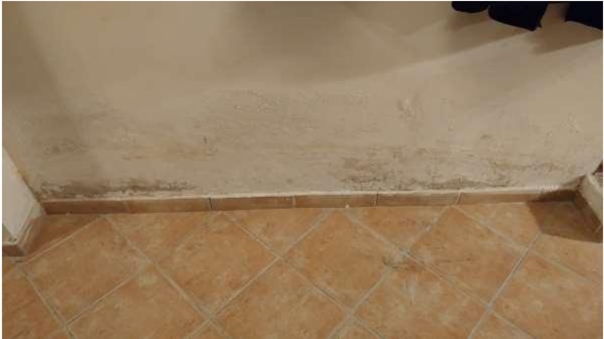
foto n. 25 – umidità di risalita alla base dei muri dei locali seminterrati dell'unità immobiliare con ingresso da Piazza Salvo D'acquisto 8, affittata a [REDACTED]