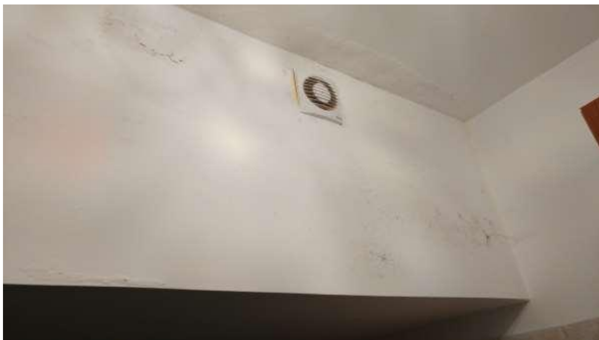
foto n. 43 – formazione di condensa sul soffitto/parete del servizio igienico al piano seminterrato dell'appartamento con ingresso da via Giuseppe Impastato 13 affittato a [REDACTED]