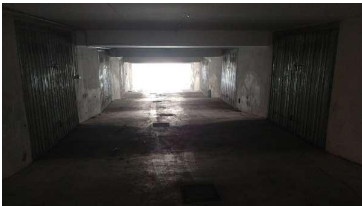
foto n. 4 – area di manovra con accesso da via Giovanni Falcone per l'ingresso alle autorimesse delle n. 14 unità immobiliari in Rocca di Papa (foglio 8 part. 1119), con ingresso tra la via Giuseppe Impastato e Piazza Salvo D'Acquisto