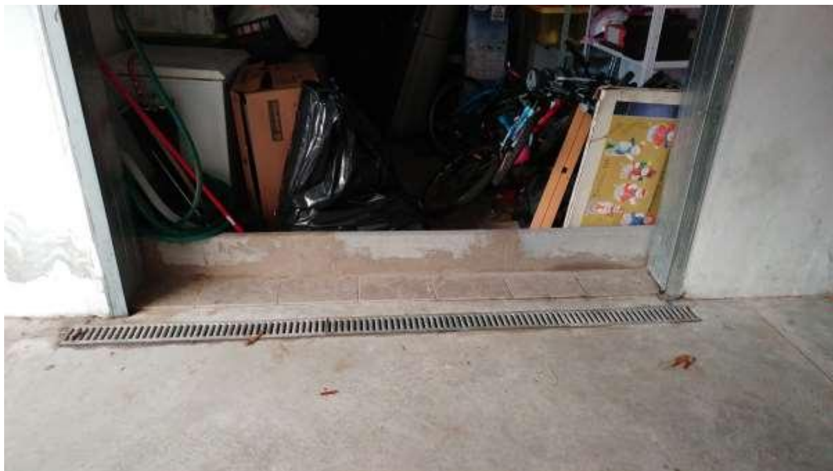
foto n. 33 – sponda in muratura installata all'ingresso dell'autorimessa/piano seminterrato dell'appartamento con ingresso da via Giuseppe Impastato 25 affittato a [REDACTED] per contrastare gli allagamenti che si verificano i giorni di forte pioggia, a causa dei reflussi provenienti dalla rete fognaria del complesso