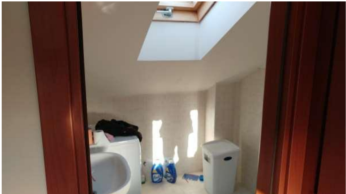
foto n. 21 – servizio igienico al piano mansarda dell'unità immobiliare con ingresso da Piazza Salvo D'acquisto 13, affittata a [REDACTED]