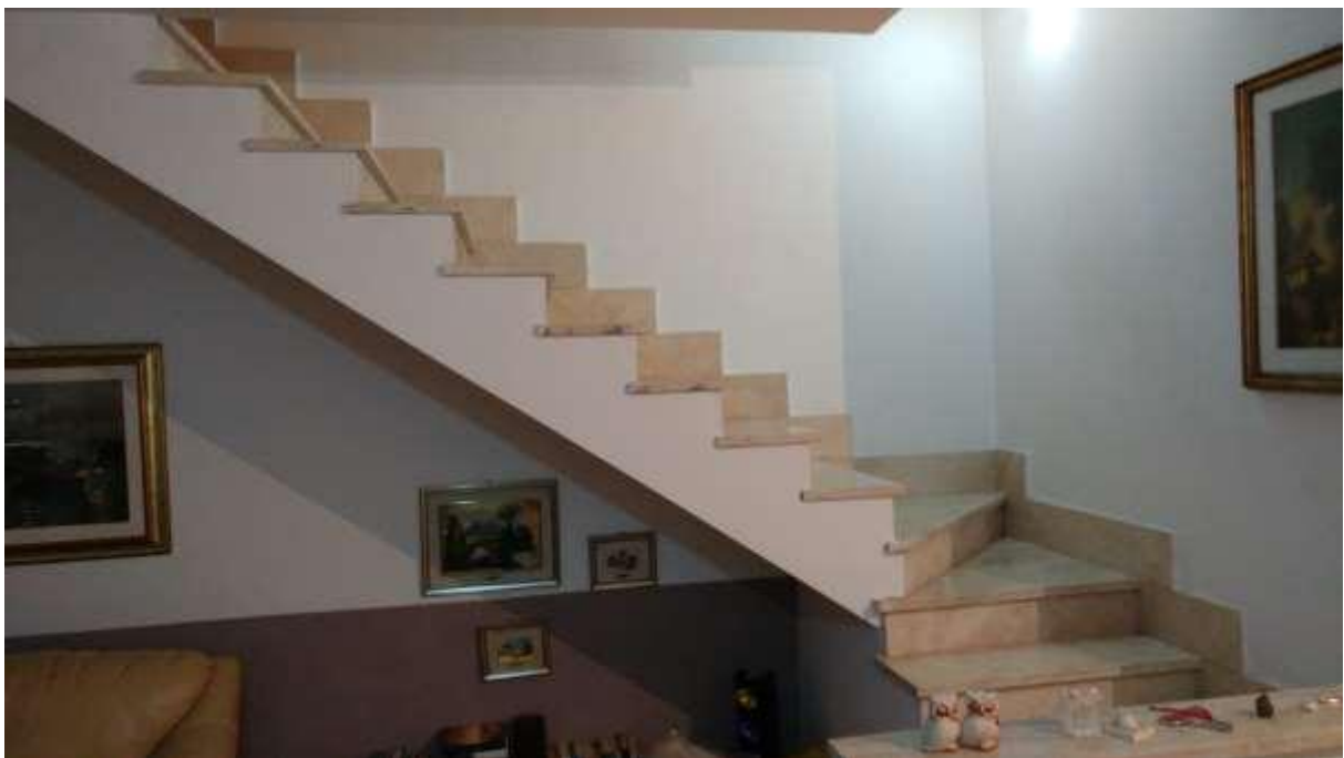
foto n. 40 – mancanza di parapetto/mancorrente sulla scala di collegamento tra il piano rialzato ed il piano seminterrato di tutte le unità immobiliari