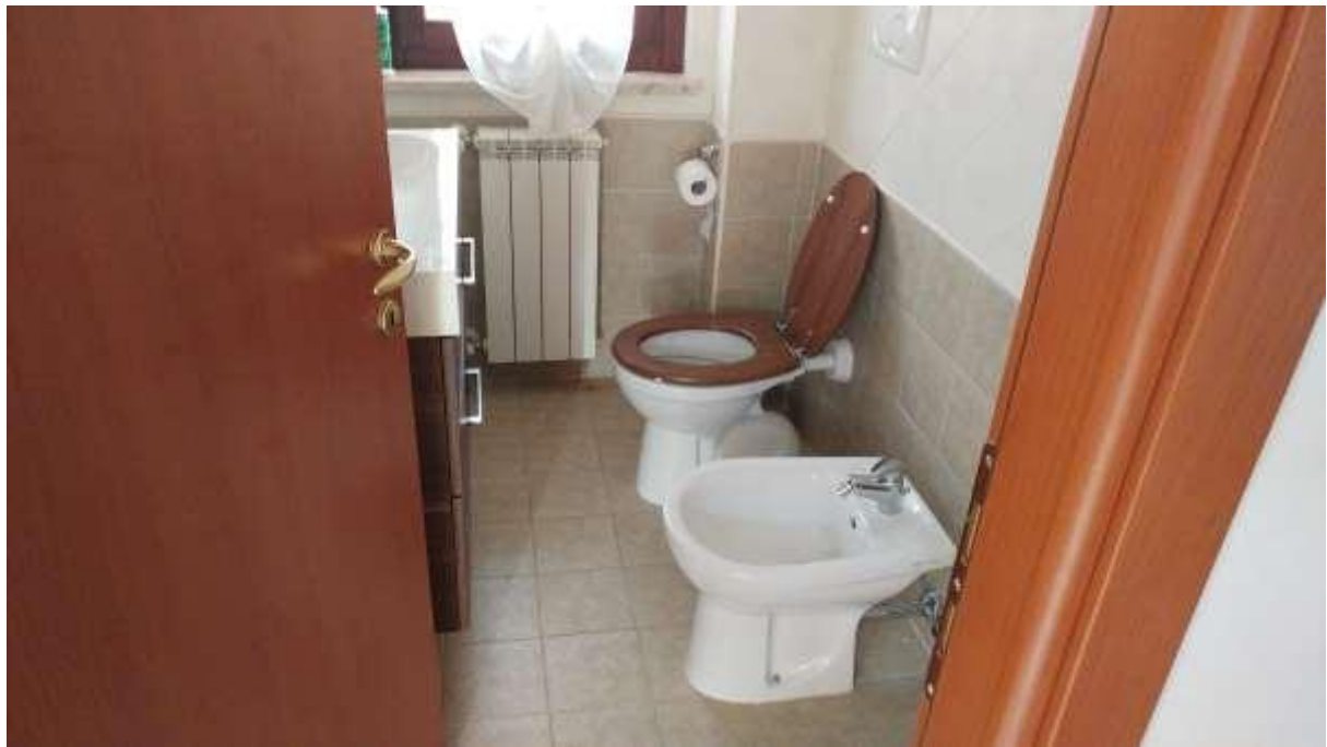
foto n. 7 – servizio igienico al piano rialzato dell'unità immobiliare con ingresso da Piazza Salvo D'acquisto 13, affittata a [REDACTED]