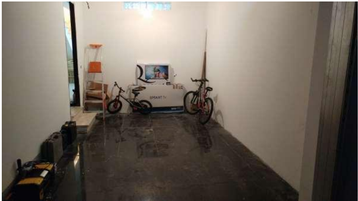
foto n. 9 – vano autorimessa pavimentato con ceramica lucida al piano interrato dell'unità immobiliare con ingresso da Piazza Salvo D'acquisto 13, affittata a [REDACTED]