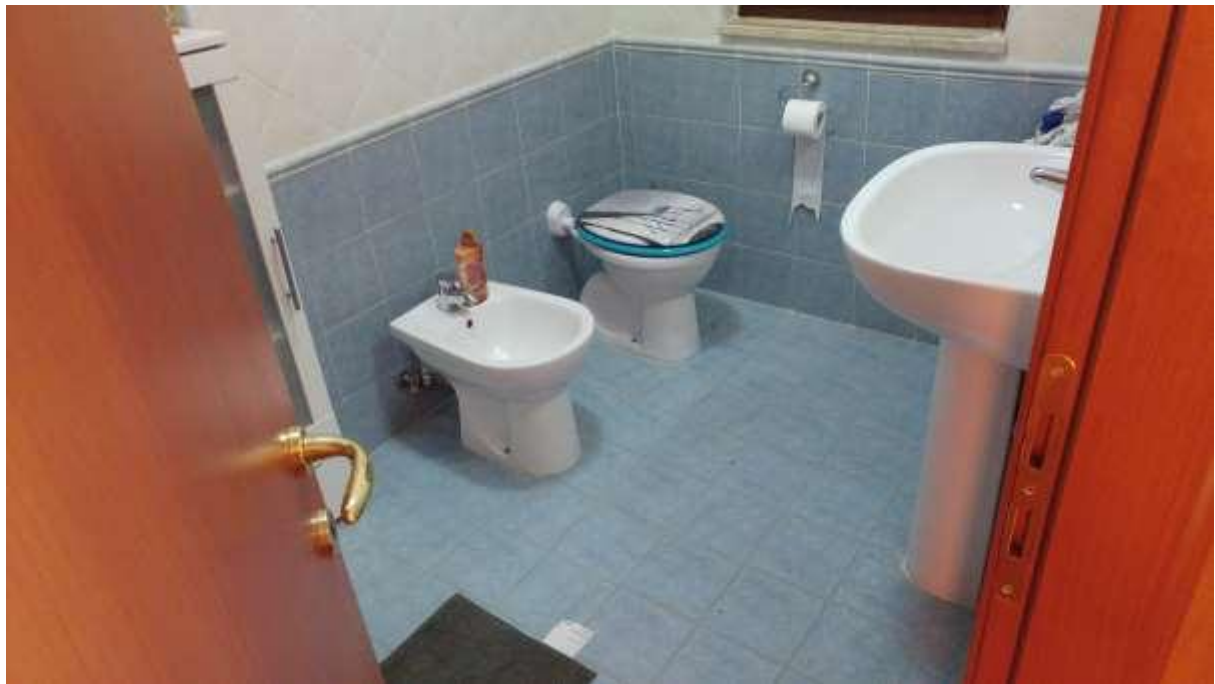
foto n. 19 – servizio igienico al piano primo dell'unità immobiliare con ingresso da Piazza Salvo D'acquisto 13, affittata a [REDACTED]