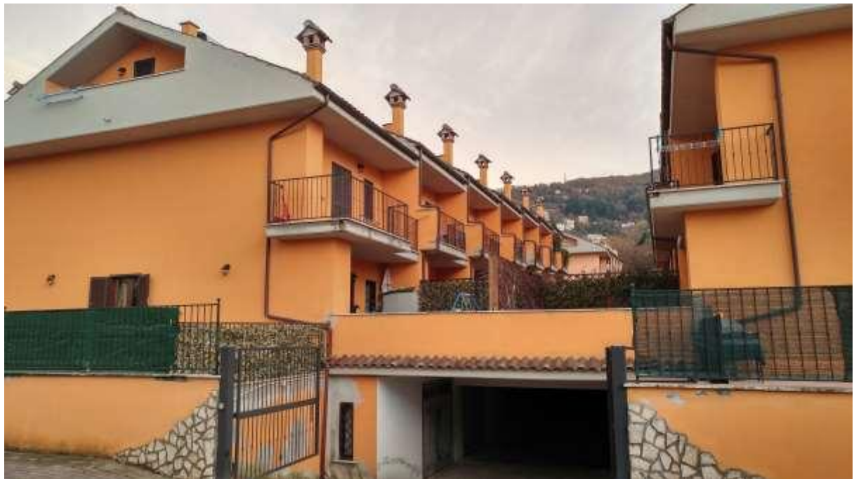
foto n. 32 – vista dell'ingresso dei box dei villini, da via Giovanni Falcone