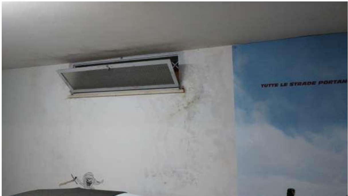
foto n. 41 – infiltrazioni di acqua meteorica e formazione di condensa sul soffitto/parete del locale al piano seminterrato dell'appartamento con ingresso da Piazza Salvo D'Acquisto 7 affittato a [REDACTED]