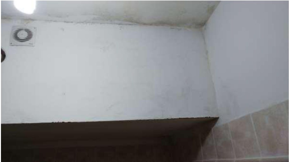
foto n. 39 – formazione di condensa sul soffitto del servizio igienico al piano seminterrato dell'appartamento con ingresso da Piazza Salvo D'Acquisto 11 affittato a [REDACTED]