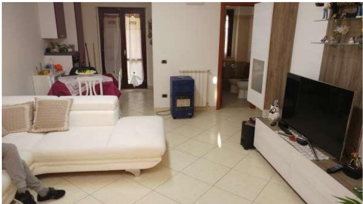
foto n. 6 – soggiorno al piano rialzato dell'unità immobiliare con ingresso da Piazza Salvo D'acquisto 13, affittata a [REDACTED]