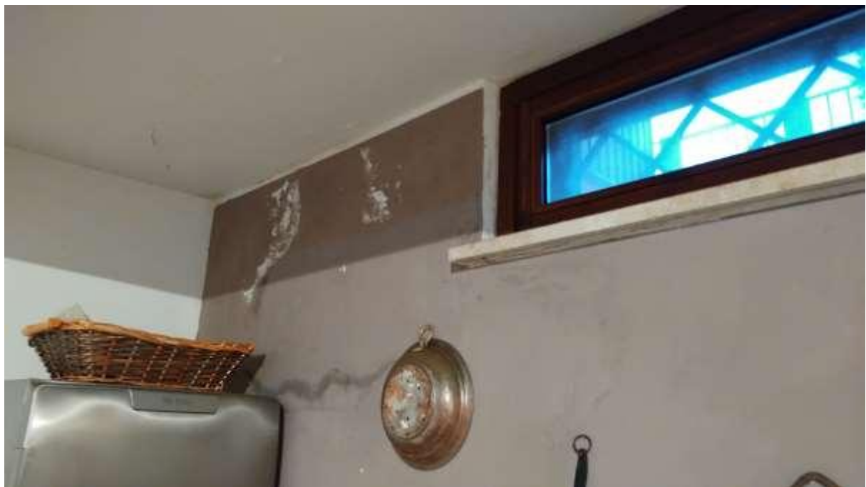
foto n. 36 – infiltrazioni sul soffitto/parete del locale seminterrato con angolo cottura dell'appartamento con ingresso da Piazza Salvo D'Acquisto 11 affittato a [REDACTED]