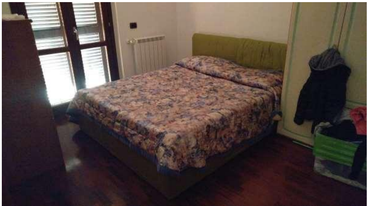
foto n. 22 – stanza da letto del piano primo dell'unità immobiliare con ingresso da Piazza Salvo D'acquisto 13, affittata a [REDACTED]