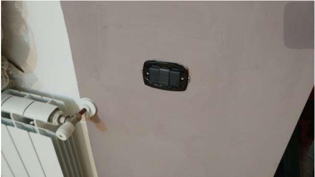
foto n. 37 – mancanza di placche nell'impianto elettrico nell'appartamento con ingresso da Piazza Salvo D'Acquisto 11 affittato a [REDACTED]