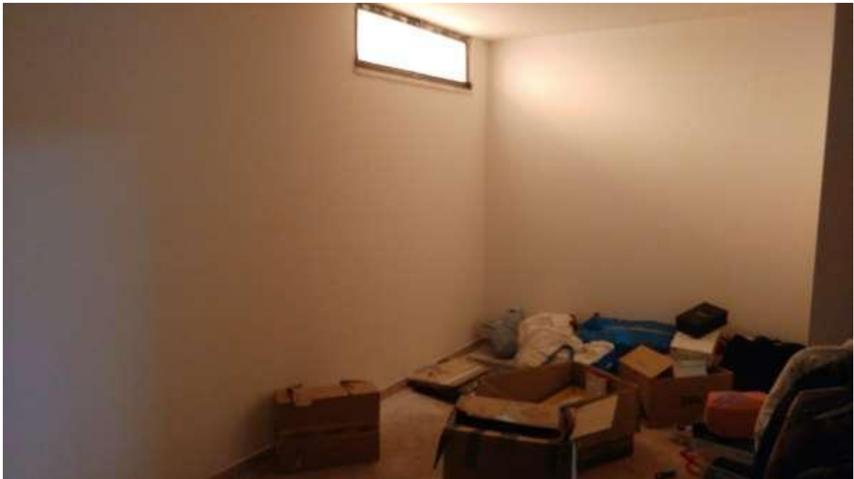
foto n. 14 – locale al piano seminterrato dell'unità immobiliare con ingresso da Piazza Salvo D'acquisto 13, affittata a [REDACTED]