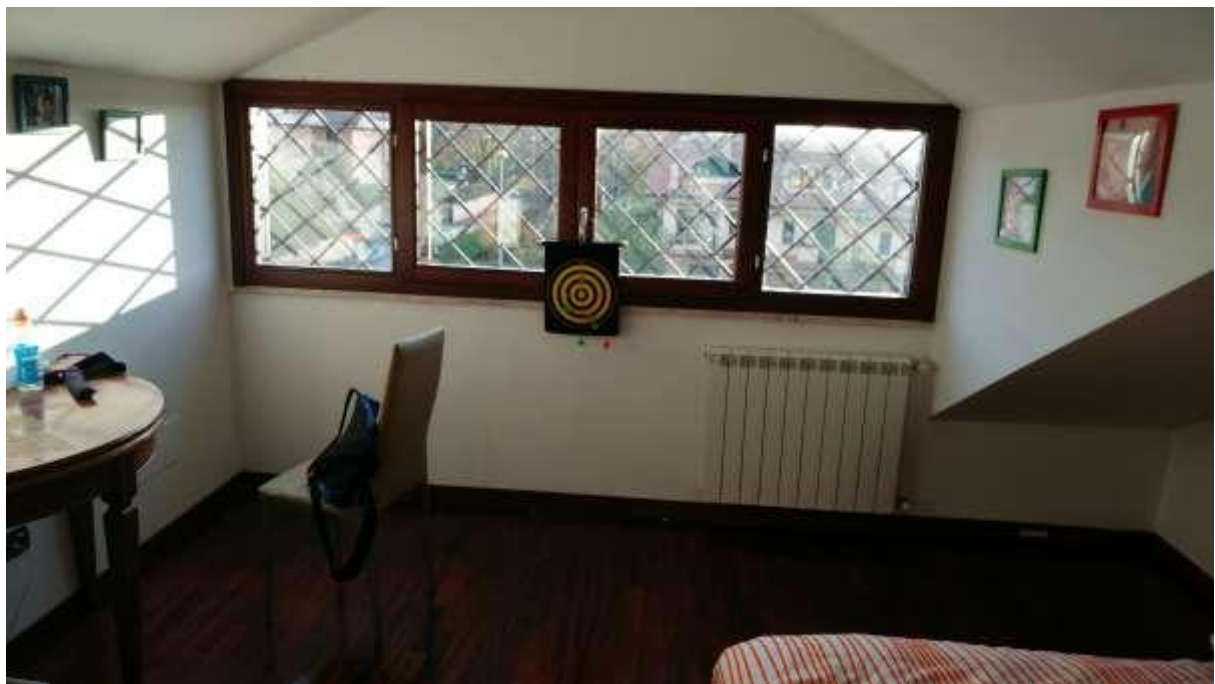
foto n. 20 – locale al piano mansarda dell'unità immobiliare con ingresso da Piazza Salvo D'acquisto 13, affittata a [REDACTED]