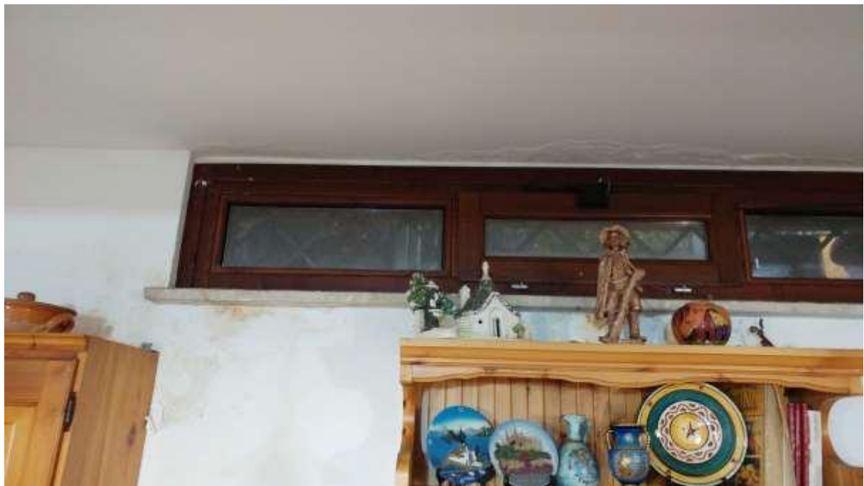
foto n. 42 – infiltrazioni di acqua meteorica e formazione di condensa sul soffitto/parete del locale al piano seminterrato (lato fronte strada) dell'appartamento con ingresso da via Giuseppe Impastato 13 affittato a [REDACTED]