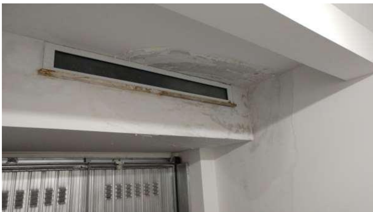
foto n. 44 – infiltrazioni di acqua meteorica e formazione di condensa sul soffitto/parete del locale al piano seminterrato ad uso autorimessa dell'appartamento con ingresso da via Giuseppe Impastato 13 affittato a [REDACTED]