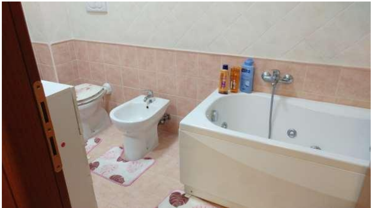
foto n. 23 – secondo servizio igienico al piano primo dell'unità immobiliare con ingresso da Piazza Salvo D'acquisto 13, affittata a [REDACTED]