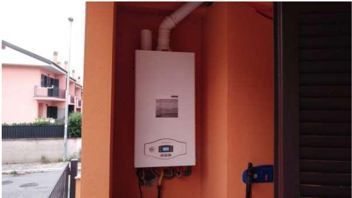
foto n. 35 – nuova caldaia installata sul terrazzo del piano rialzato dell'appartamento con ingresso da via Giuseppe Impastato 25 affittato a [REDACTED]