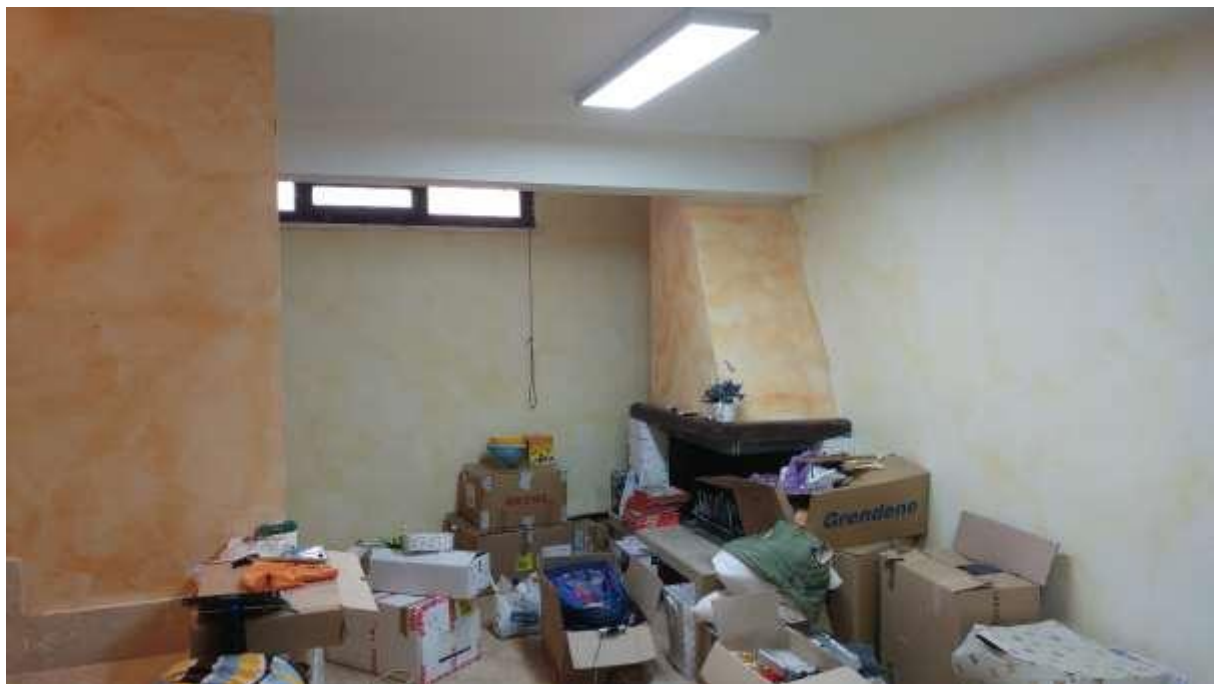
foto n. 10 – angolo camino nel vano con angolo cottura al piano seminterrato dell'unità immobiliare con ingresso da Piazza Salvo D'acquisto 13, affittata a [REDACTED]