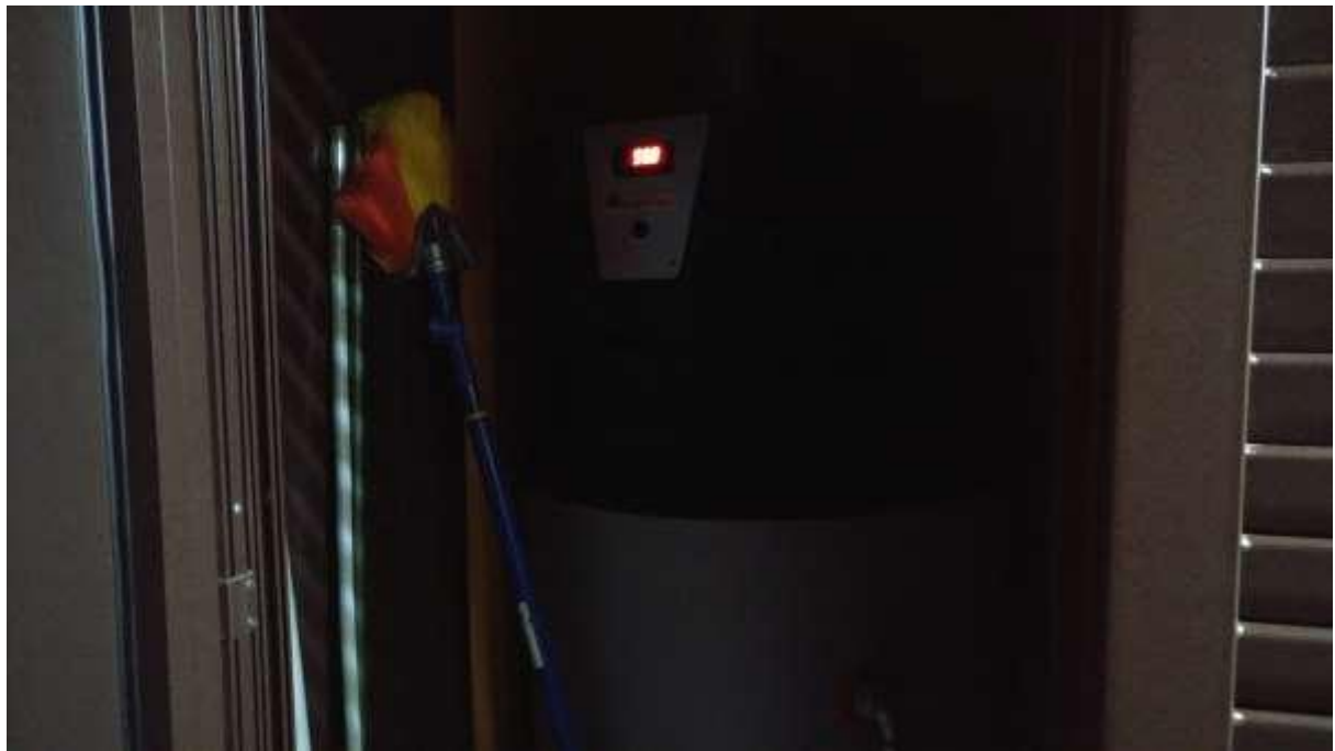
foto n. 31 – nuova centrale idrica a servizio dell'appartamento con ingresso da via Giuseppe Impastato 13, affittato a ██████████ li