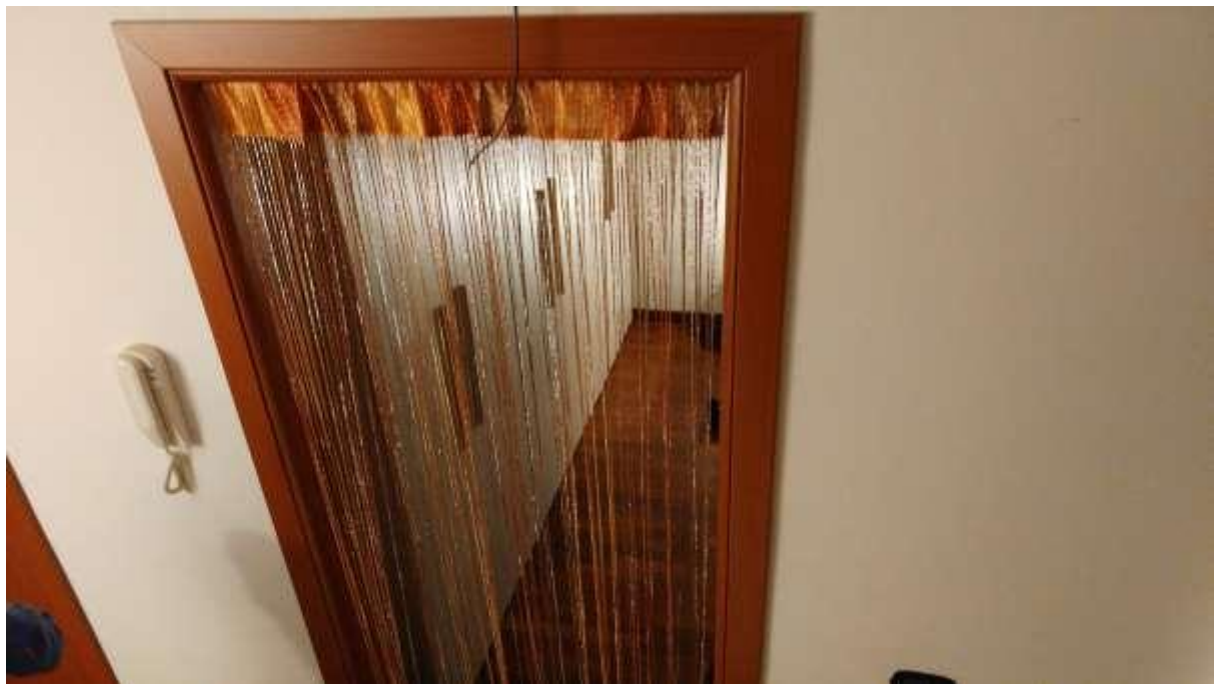
foto n. 50 – mancanza di porta al piano primo nell'appartamento con ingresso da via Giuseppe Impastato 19 affittato a [REDACTED]