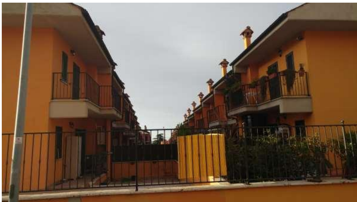
foto n. 3 – vista di insieme delle n. 14 unità immobiliari in Rocca di Papa (foglio 8 part. 1119), con ingresso tra la via Giuseppe Impastato e Piazza Salvo D'Acquisto