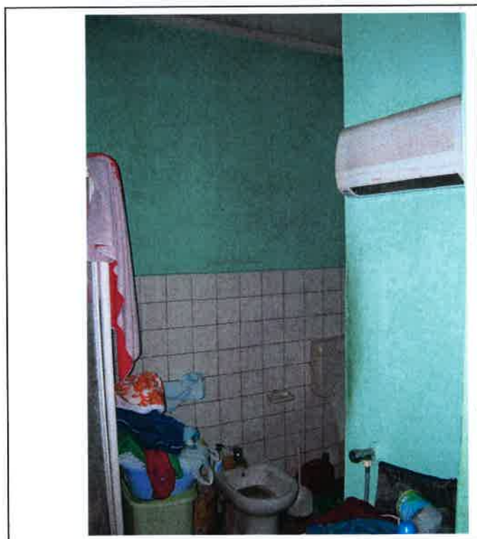
F.10 Vista interno – servizi sanitari.