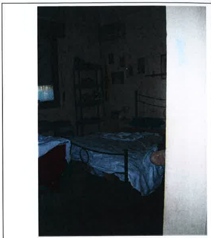
F.9 Vista interno - camera da letto matrimoniale.