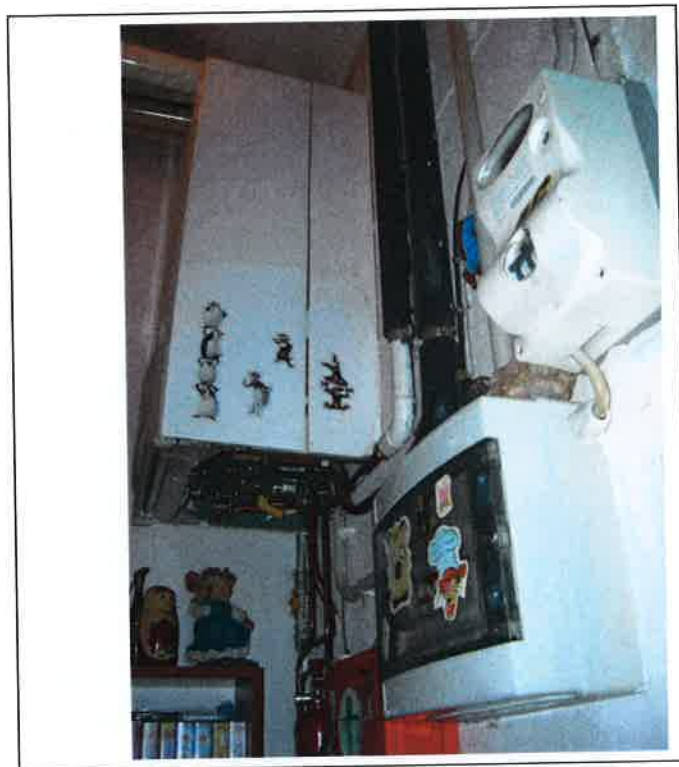
F.11 Vista Caldaia e quadro elettrico