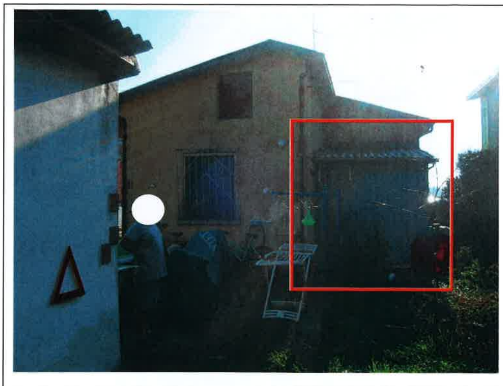
F.6 dettaglio del fronte nord. Evidenziato nel riquadro rosso il manufatto abusivo.