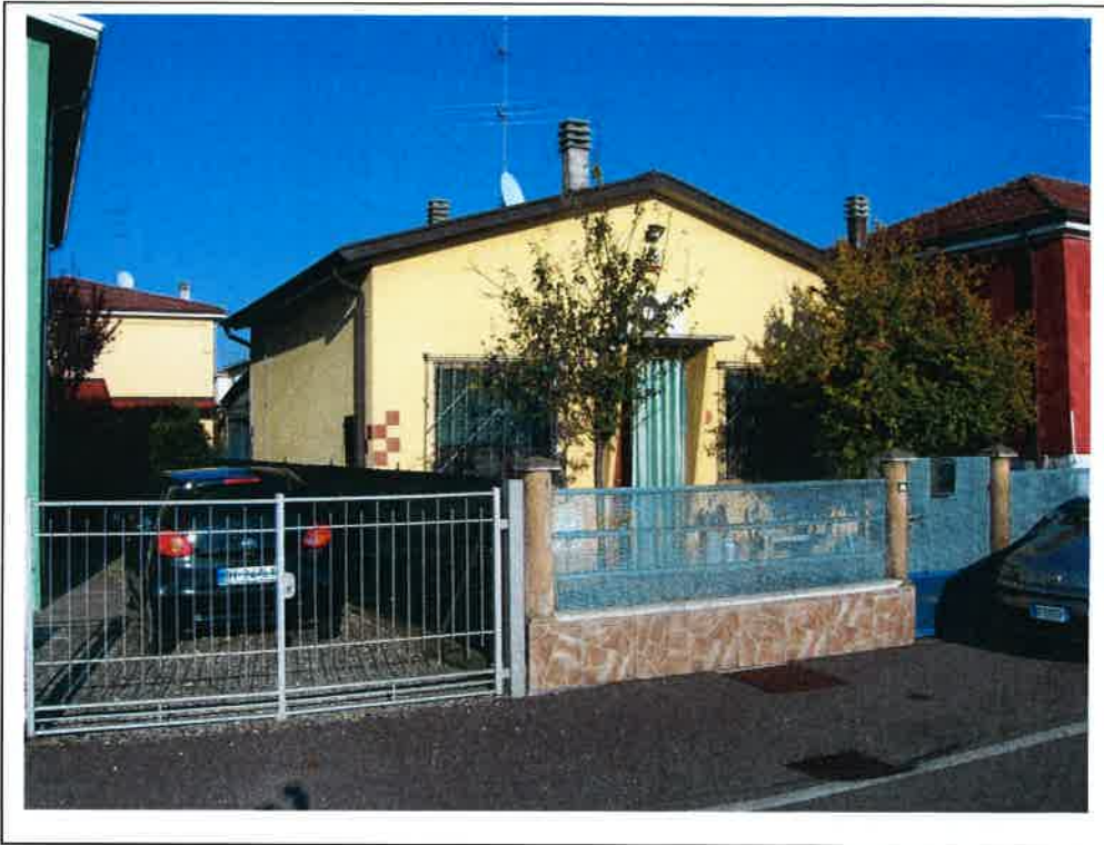
F.1 Vista sud-est dell'unità immobiliare da Via Rapari Pallavicini