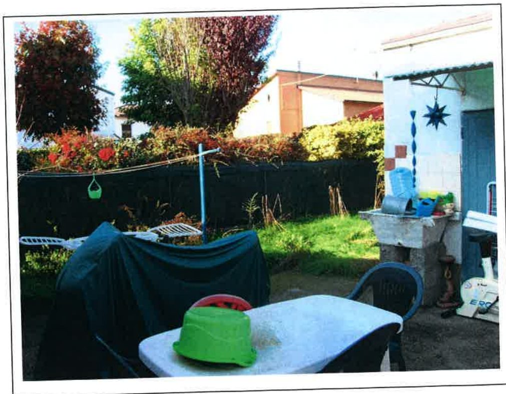
F.4 Vista dell'area cortilizia esterna posteriore.