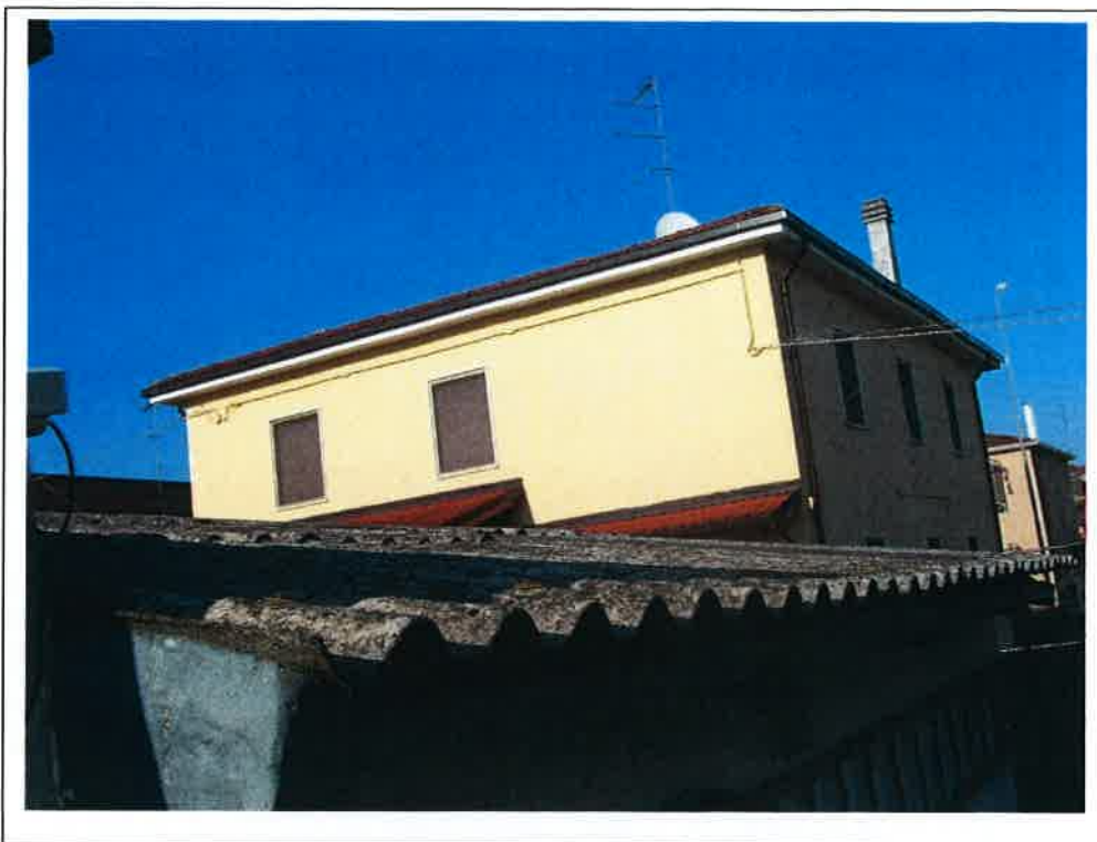
F.5 dettaglio della copertura in cemento amianto del garage.