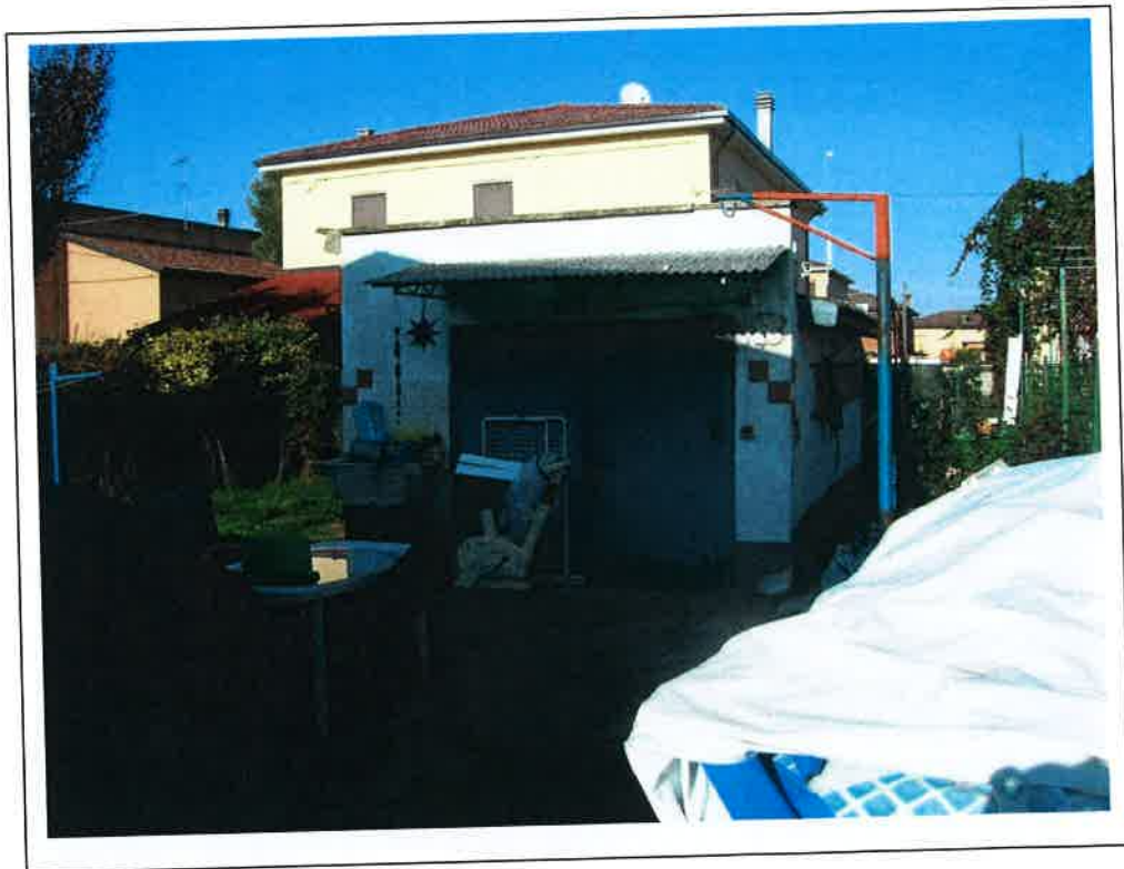
F.3 Vista del garage