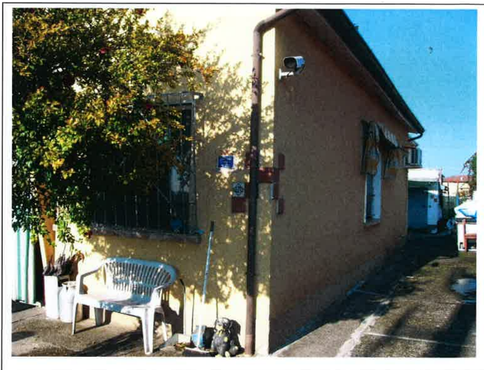
F.2 Vista della porzione di fabbricato sul fronte ovest. Sul fondo si intravede il garage.