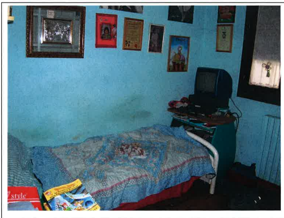
F.8 Vista interno - camera da letto singola.