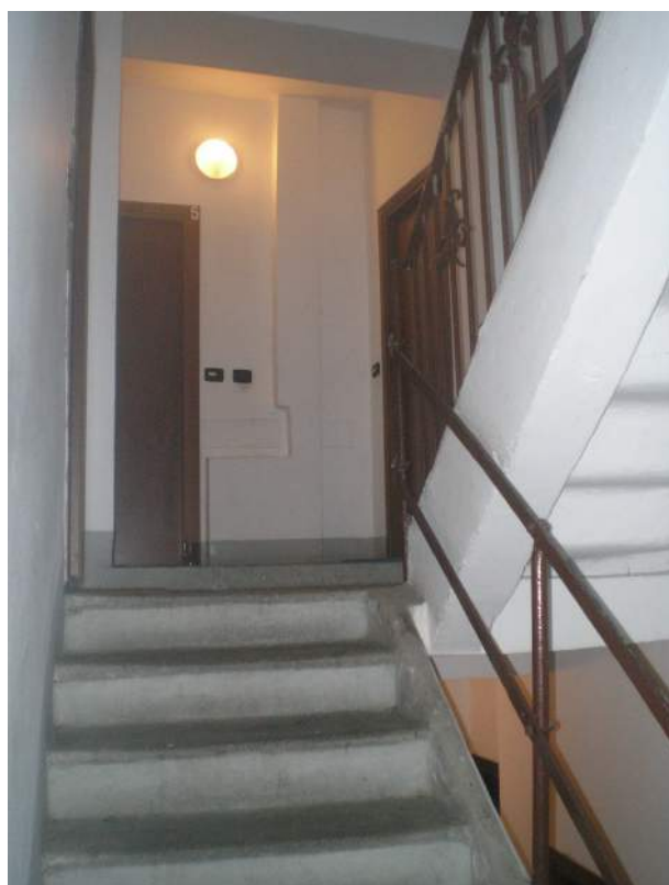
8. Particolare del vano scala condominiale e del pianerottolo al piano primo