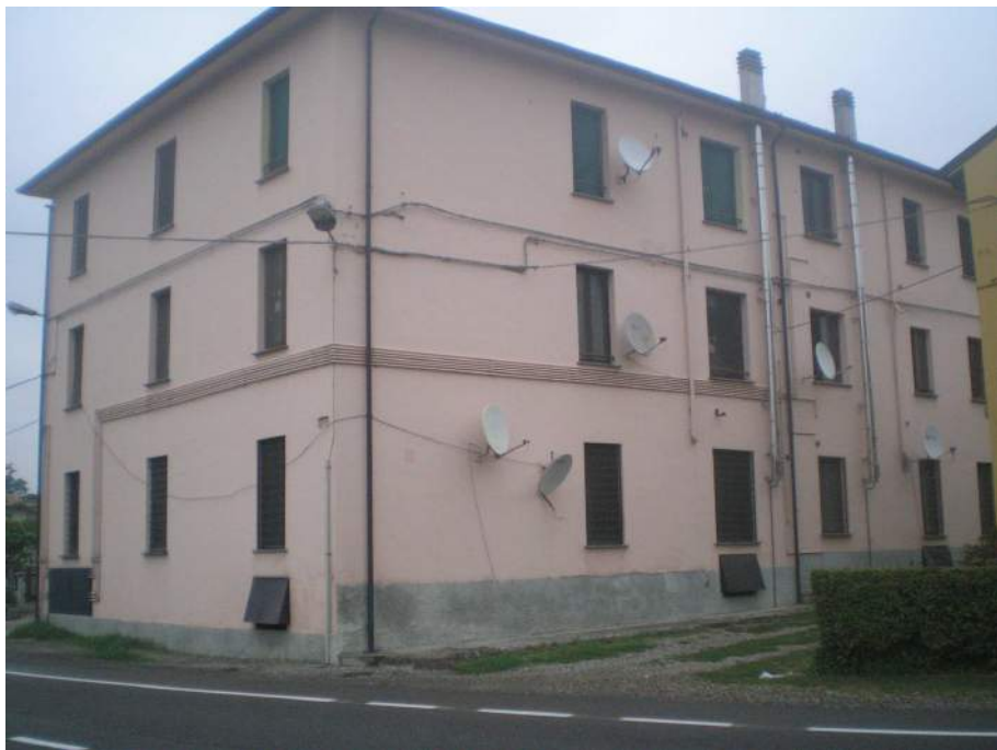
2. Scorcio dei fronti ovest e sud