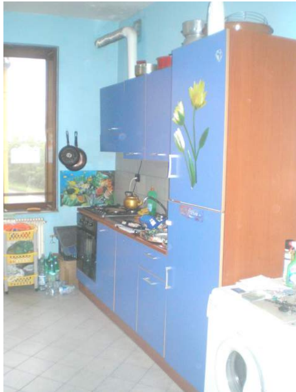
9. Scorcio del soggiorno/cucina