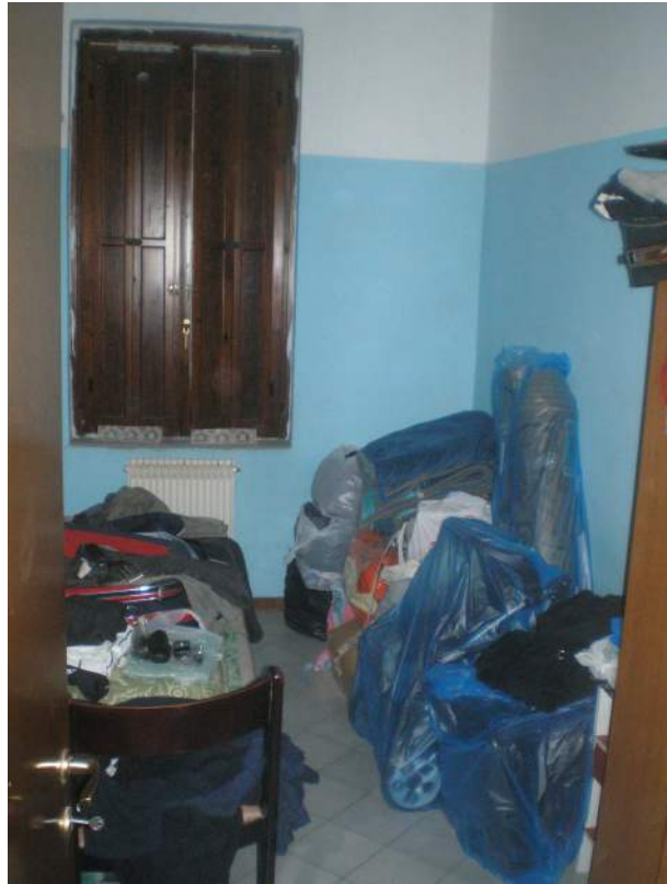
13. Scorcio del primo vano letto