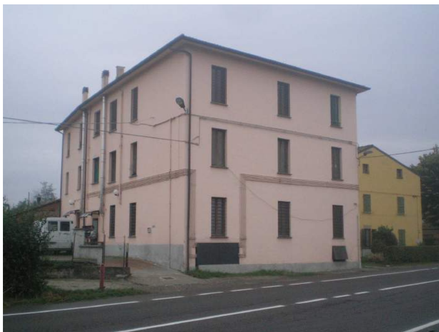
4. Scorcio dei fronti ovest e nord dalla Strada Farnesiana