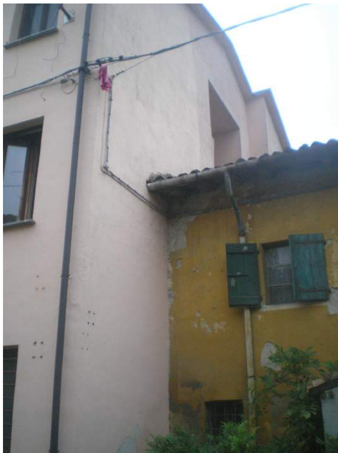
3. Particolare del fronte est in adiacenza ad altra unità abitativa