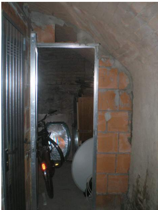
21. L'ingresso al vano cantina annesso all'unità immobiliare in epigrafe