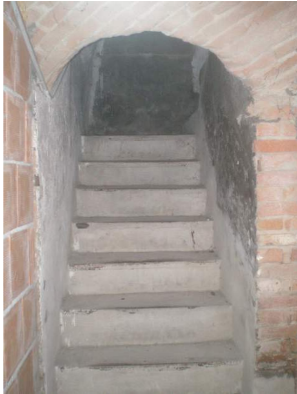
19. La rampa di scale che introduce al piano interrato