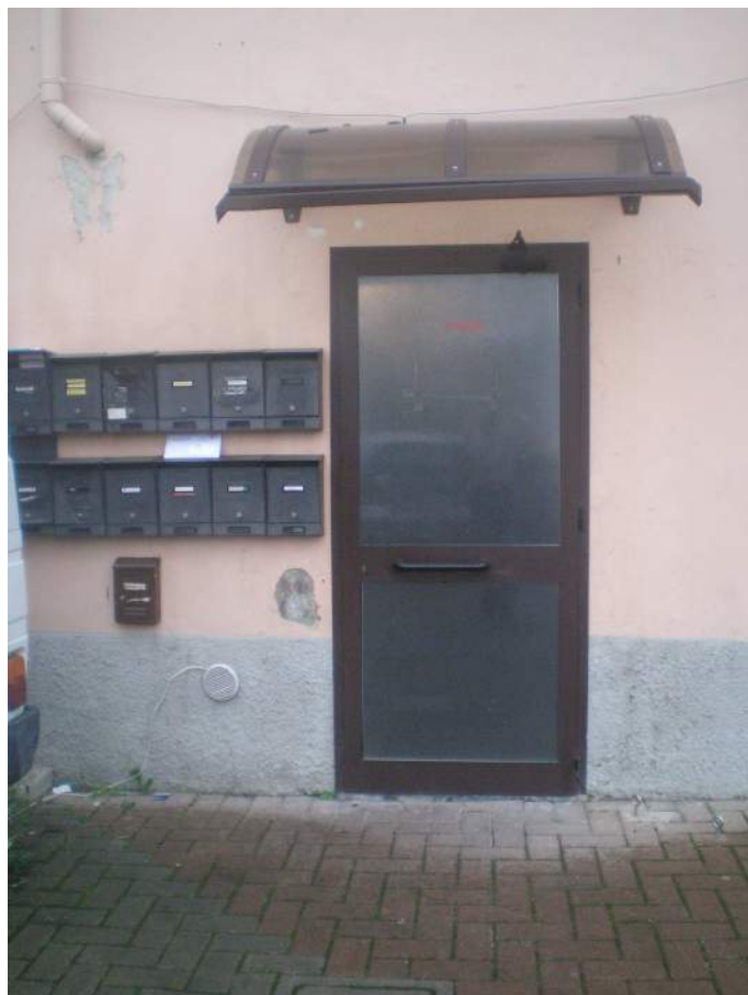
6. Particolare della porta di ingresso al condominio