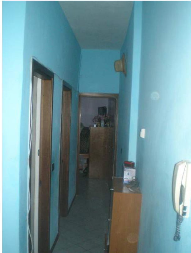
11. Particolare del corridoio di disimpegno al reparto notte