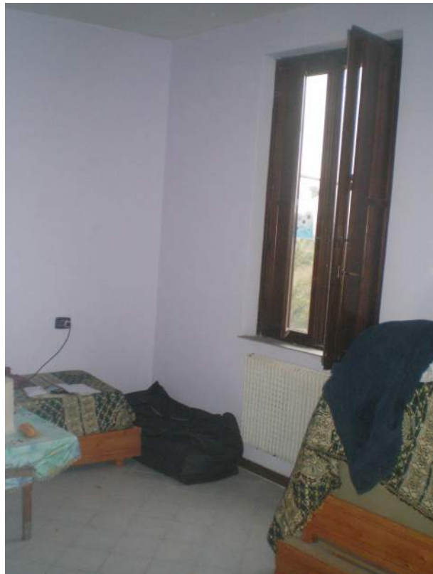
14. Scorcio del secondo vano letto