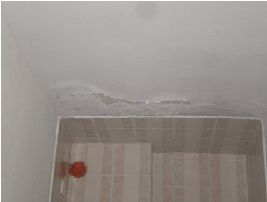
16. Particolare di distacco della pittura murale sul plafone del locale bagno