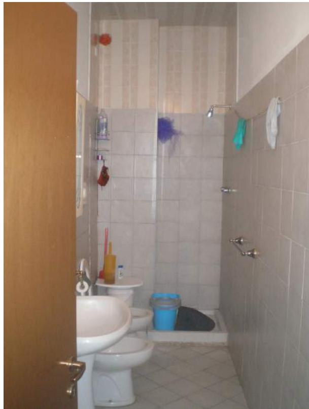
12. Scorcio del bagno cieco