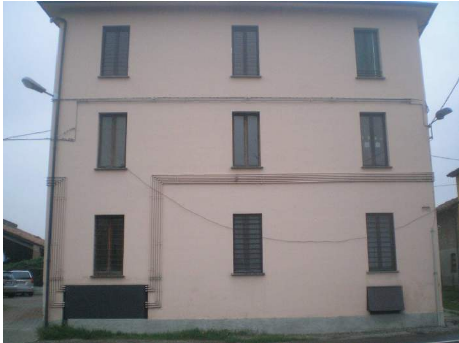
1. il fronte ovest del Condominio "Casanova" su Strada Farnesiana