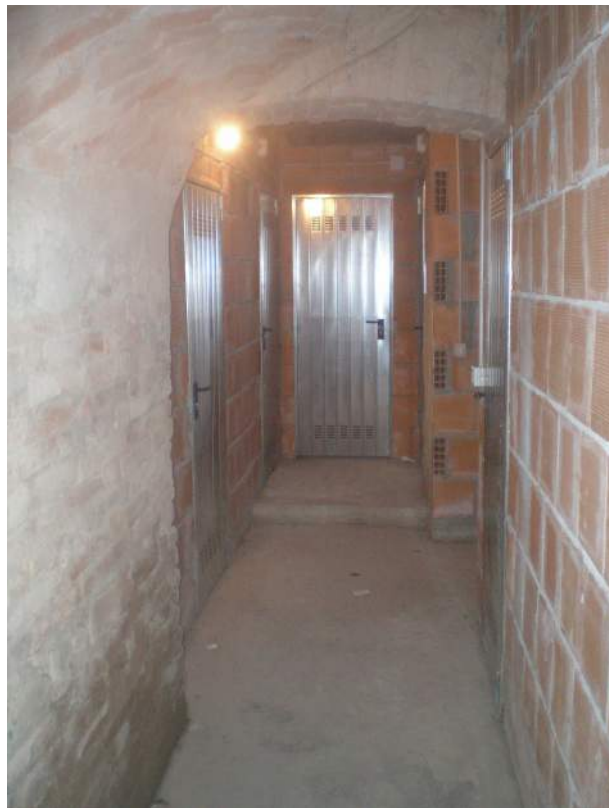
20. Il corridoio comune che disimpegna gli ingressi ai vani cantina