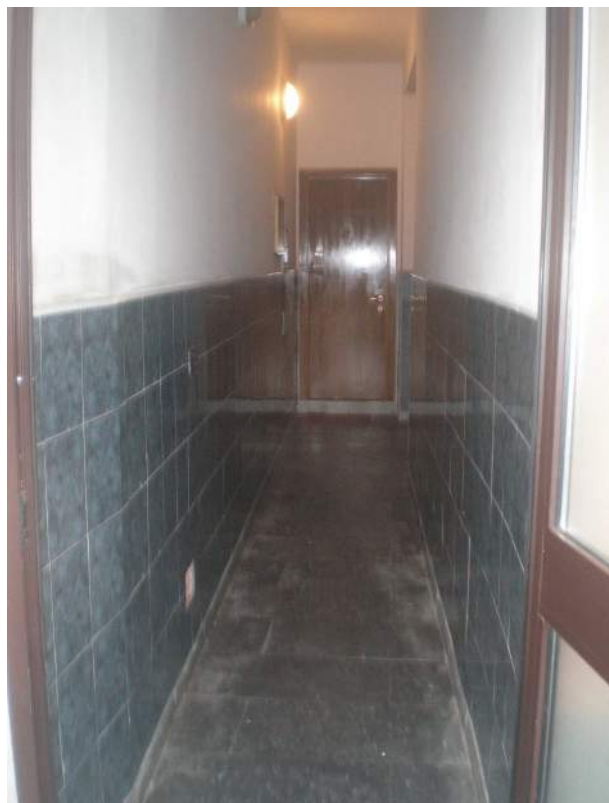
7. Il corridoio di ingresso al condominio