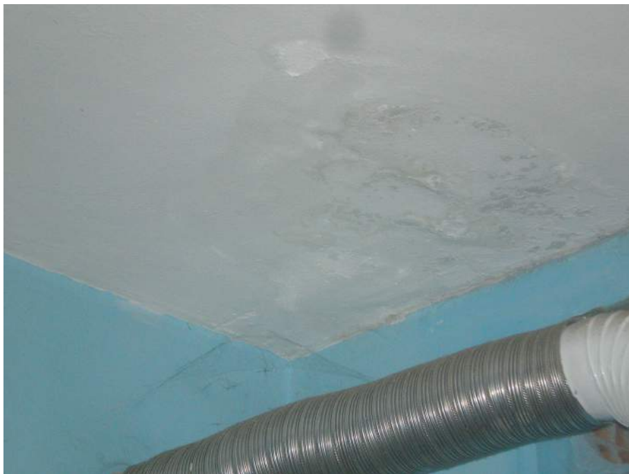
18. Particolare di distacco della pittura murale sul plafone del locale soggiorno/cucina