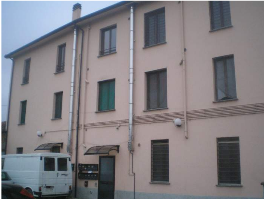
5. Scorcio del fronte nord - ingresso al Condominio