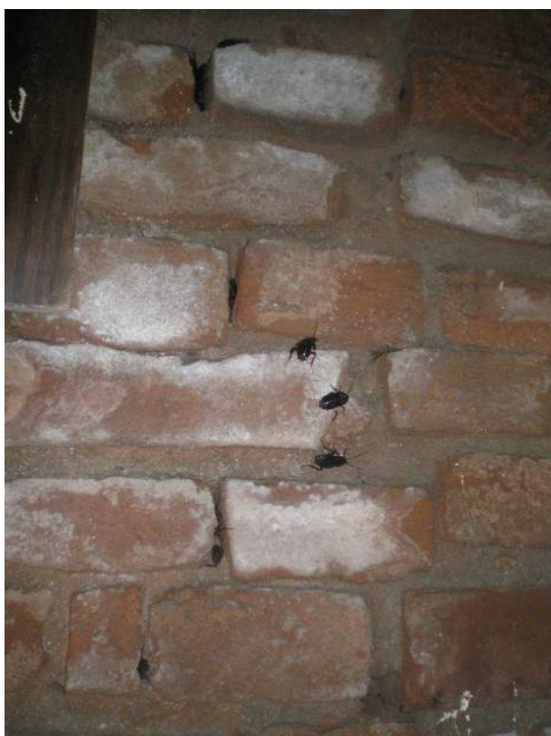
22. Particolare dell'infestazione da blatte al piano interrato/vano cantina in esame