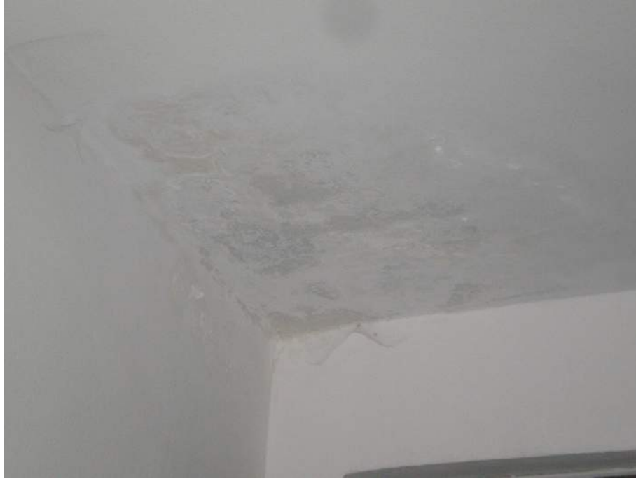
17. Particolare di distacco della pittura murale sul plafone del primo vano letto