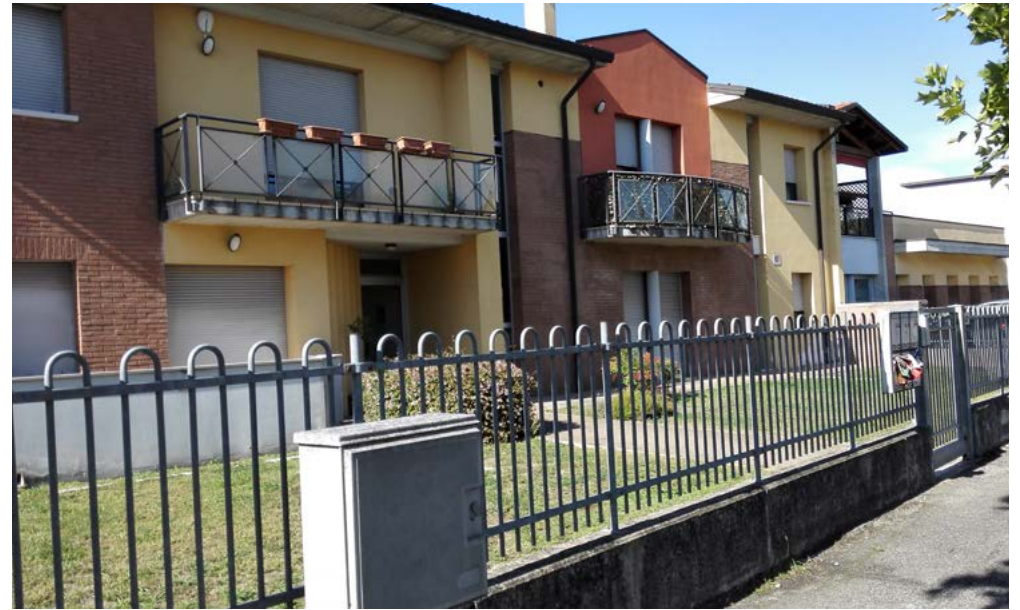
Prospetto Ovest, accesso pedonale da via Marconi.