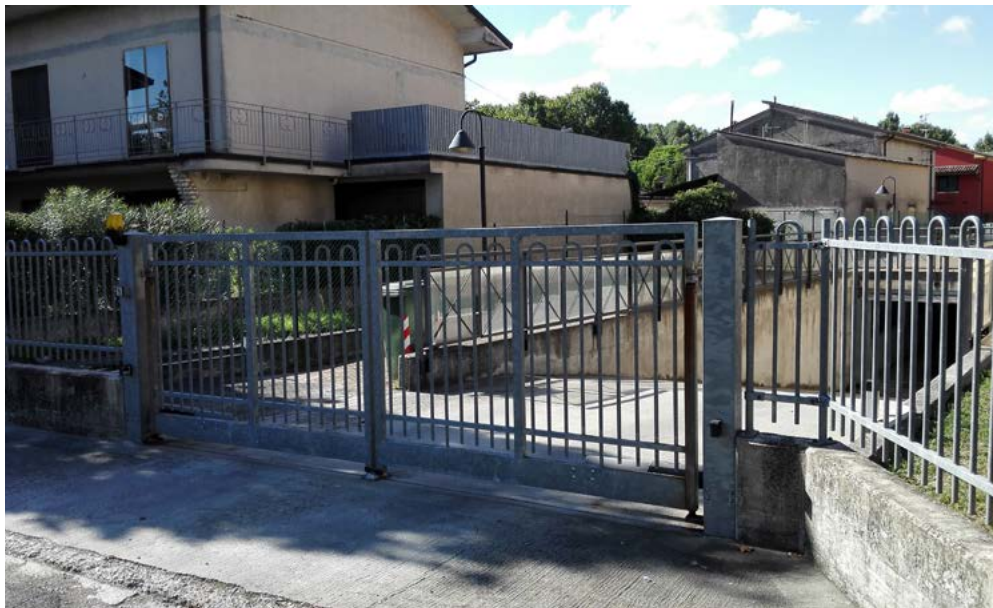
Accesso carrabile su via Marconi.