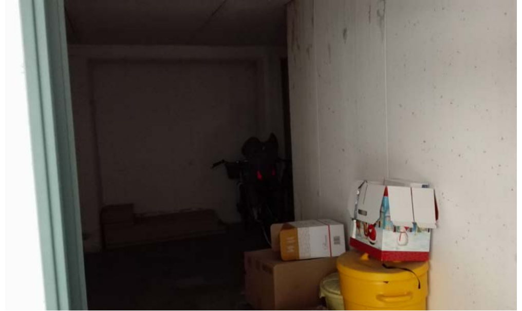
Cantina, piano interrato lotto 4.