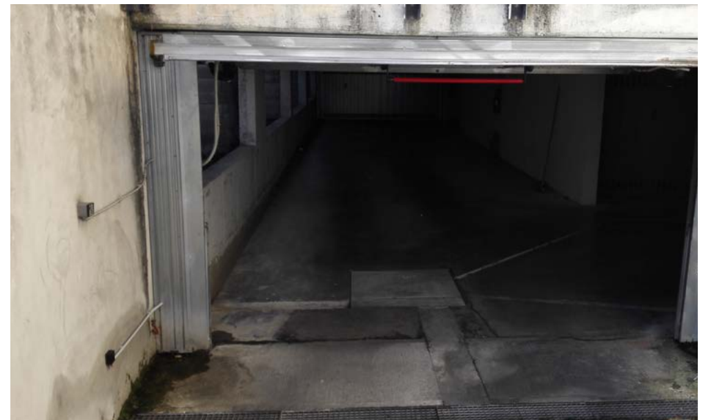
Ingresso autorimessa, piano interrato.