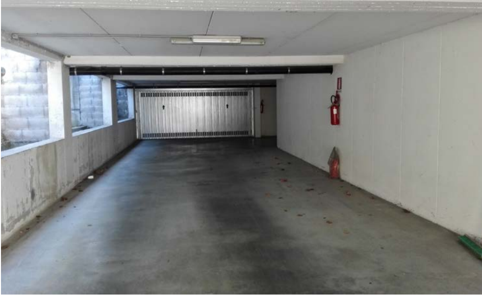
Area di manovra, autorimessa piano interrato.