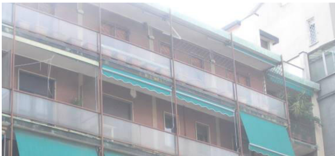
Fotografia 30 – Balcone soggiorno visto dal cortile.