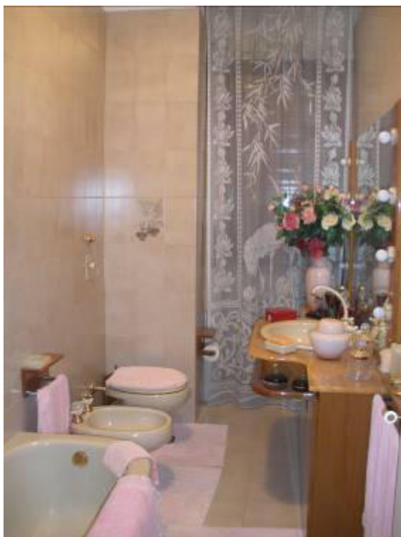
Fotografia 21 – Primo Bagno in prossimità della camera matrimoniale.