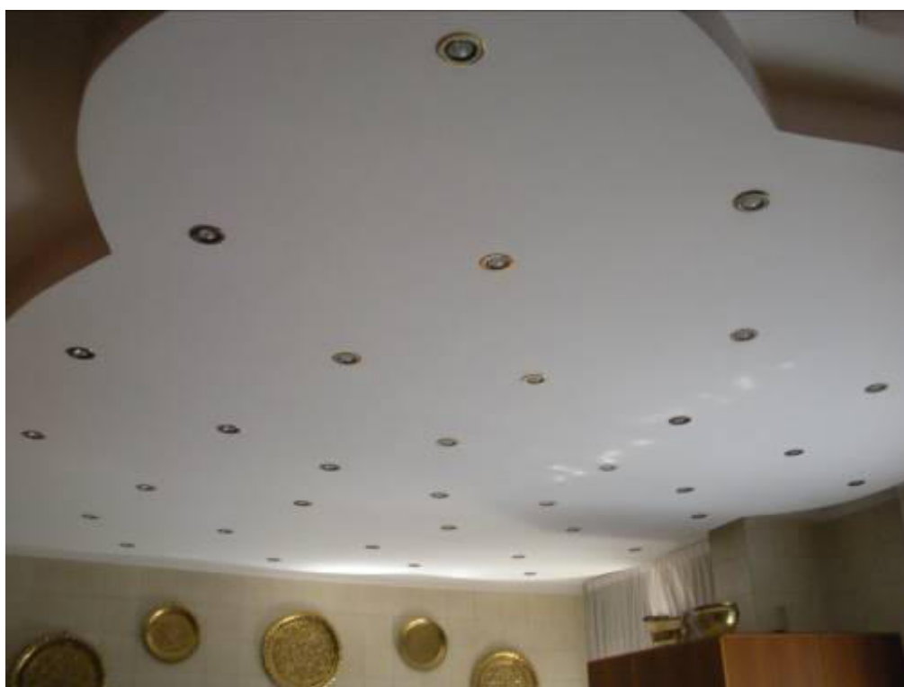
Fotografia 27 – Particolare soffitto cucina