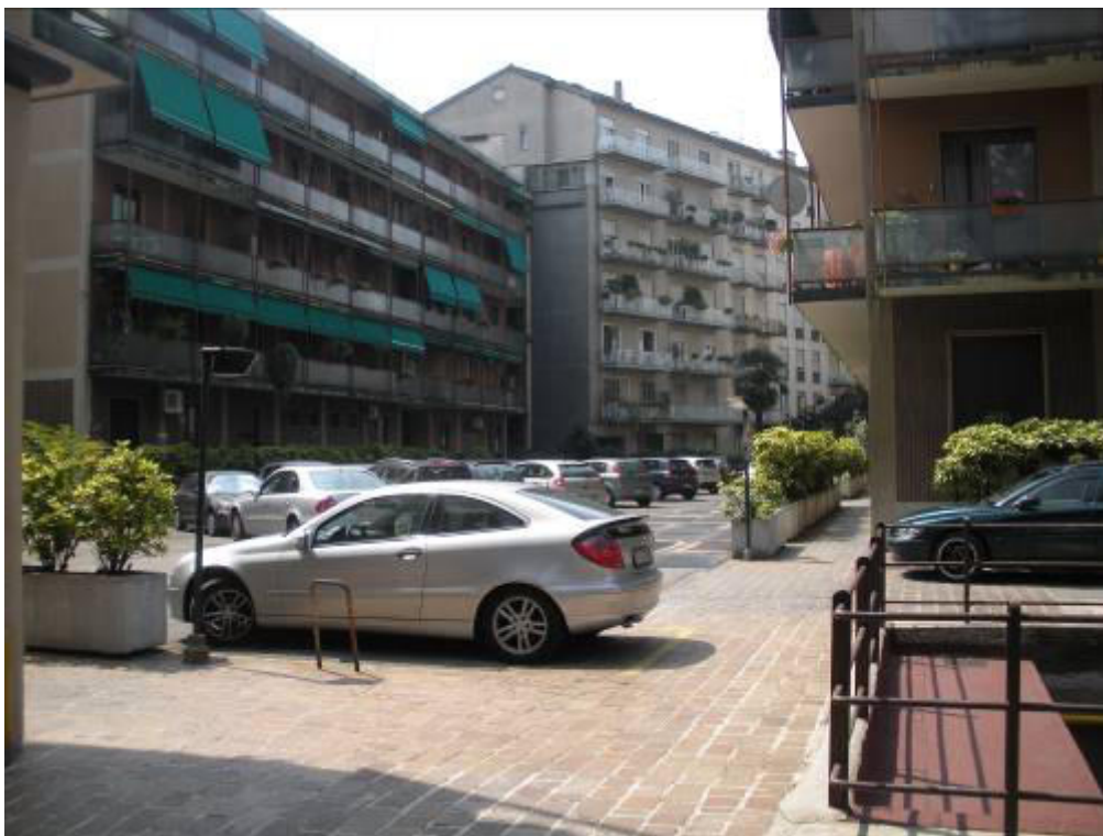
Fotografia 03 – Cortile interno /1.