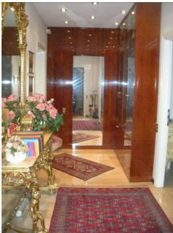
Fotografia 14 – ingresso appartamento.