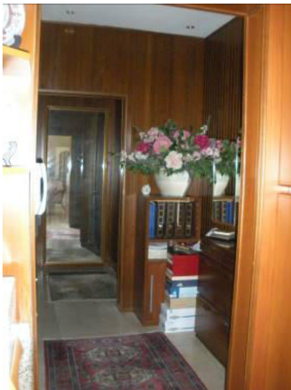
Fotografia 26 – Disimpegno tra cucina e locale “cabina armadio” usato come studio