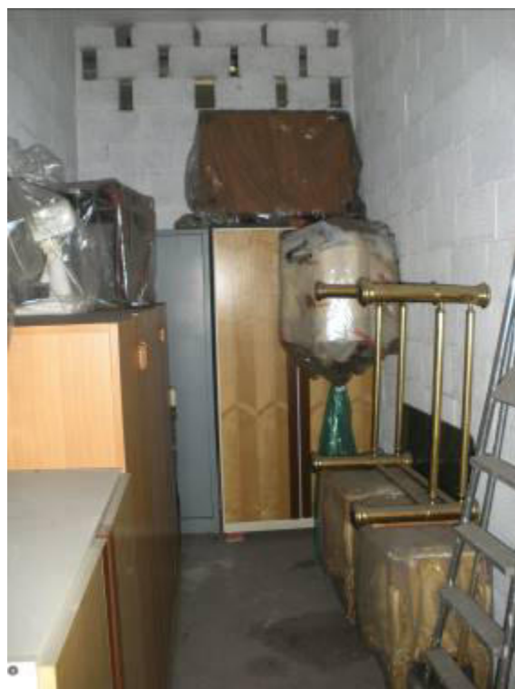
Fotografie 33-34 – Cantina identificata con il n. 35.