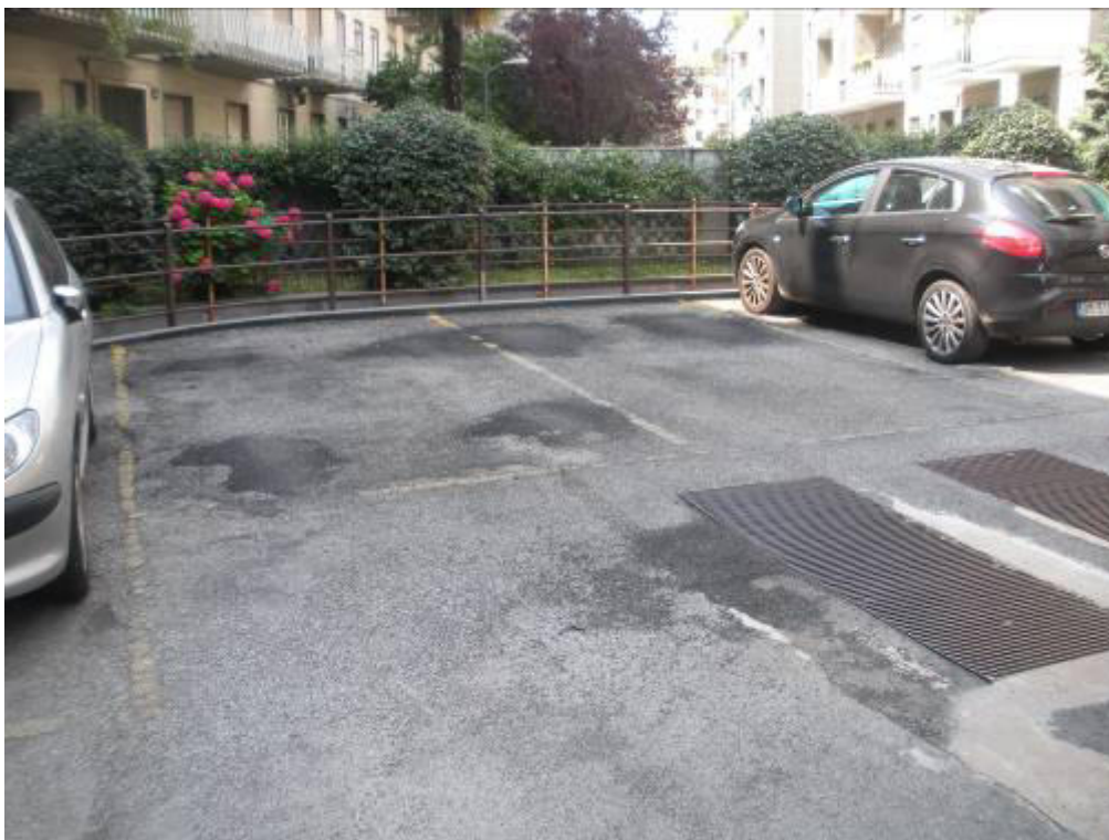
Fotografia 39 – Posti auto 36-37 (subalterni 23 e 24)