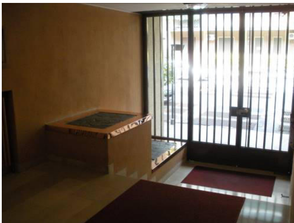
Fotografia 09 – Atrio d'ingresso