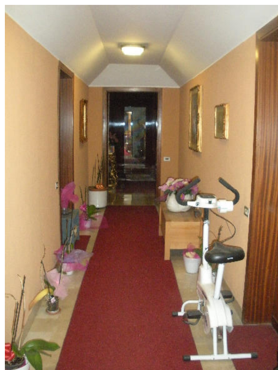
Fotografie 12-13 - Pianerottolo d'ingresso all'appartamento: uscendo dall'ascensore il pianerottolo comune conduce, attraversando il cancello in ferro visibile nella fotografia, verso il pianerottolo privato dell'appartamento.