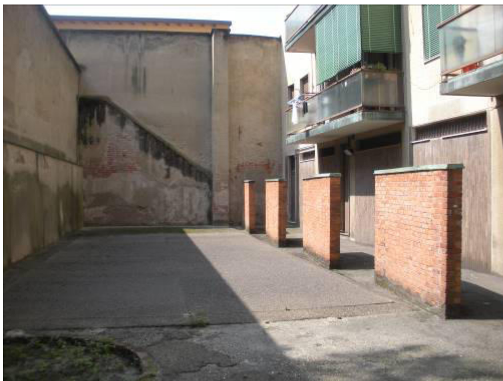
Fotografia 07 – Cortile posteriore.