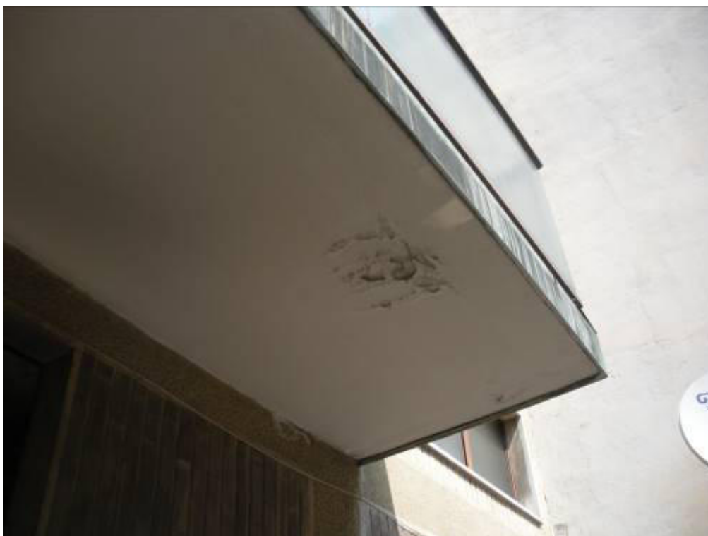
Fotografia 40 – Alcuni segni di degrado sui sotto-balconi.