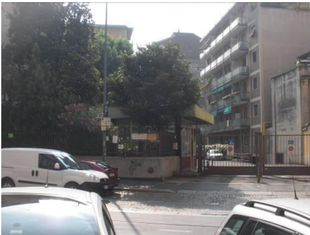
Fotografia 01 – Ingresso da via Venini 46 con edificio portineria.