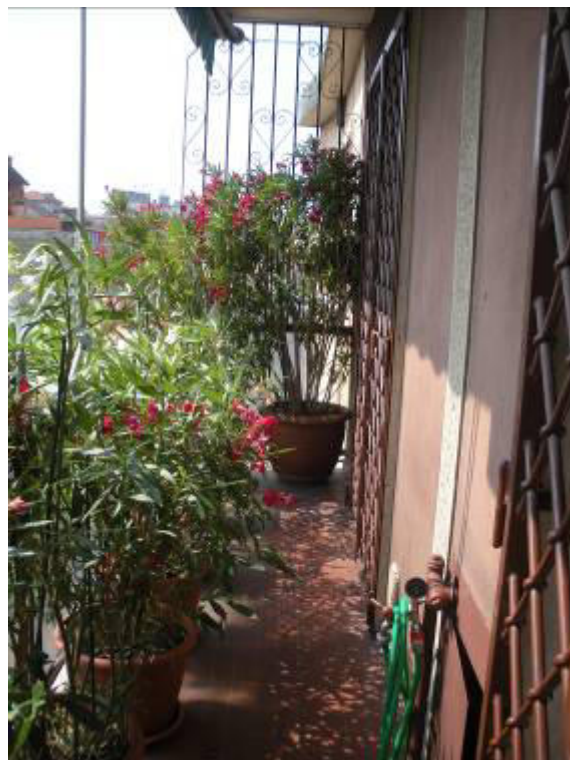
Fotografie 28-29 – Balcone cucina.