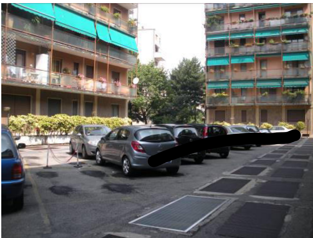
Fotografia 04 – Cortile interno/2.