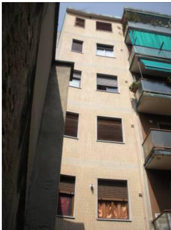
Fotografie 05-06 – Facciata posteriore dell'edificio.