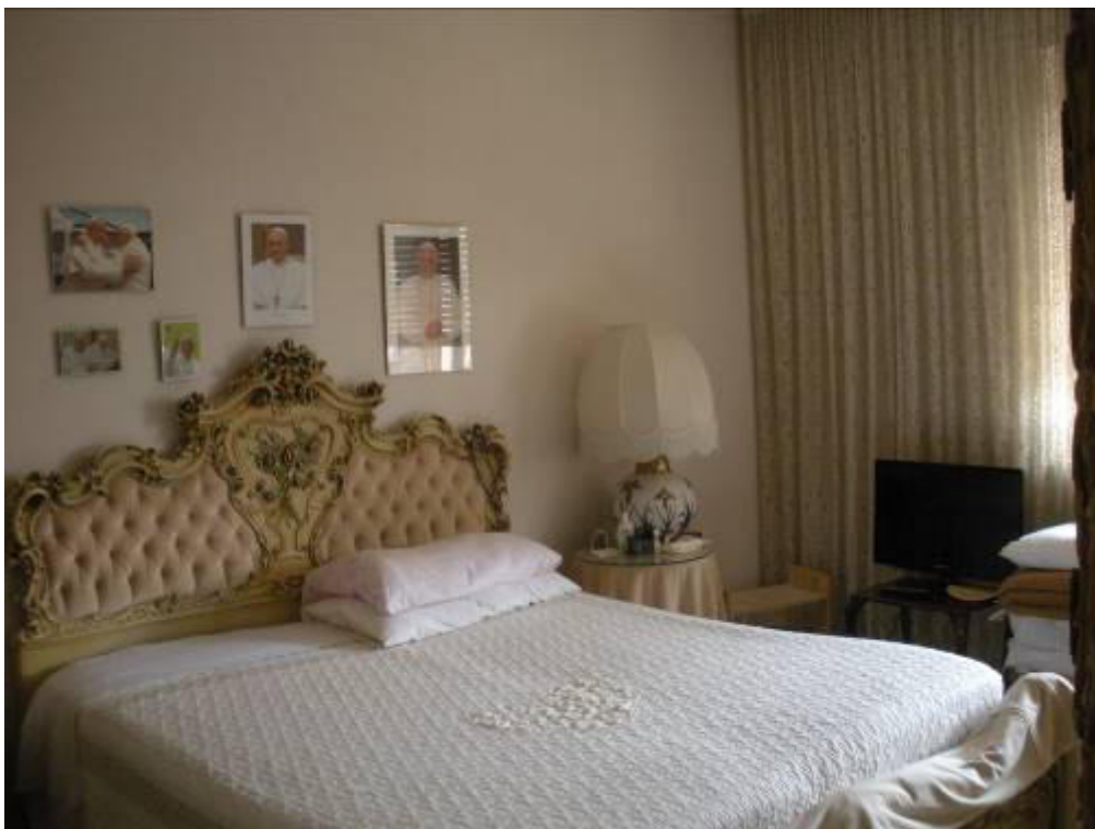
Fotografia 18 – Camera matrimoniale principale.