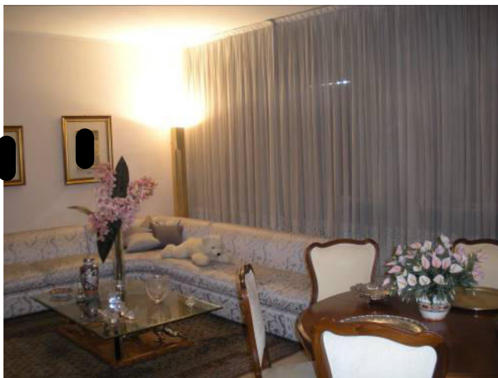
Fotografia 15 – Soggiorno/1