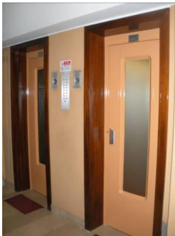
Fotografie 10 – 11 – Vano scala e ascensore.