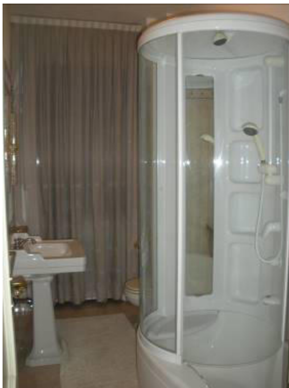
Fotografia 22 – Secondo Bagno in prossimità della seconda camera.