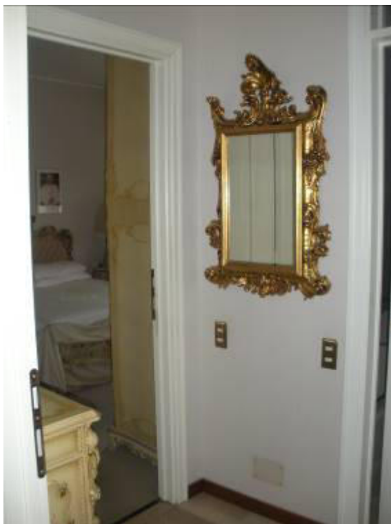
Fotografia 24 – Disimpegno camera matrimoniale