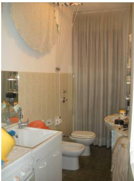
Fotografia 23 – Terzo Bagno in prossimità della della cucina.