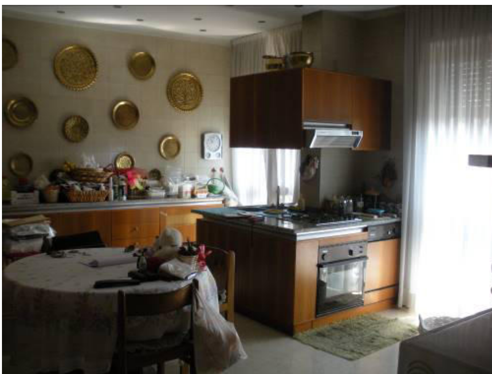
Fotografia 17 – Cucina