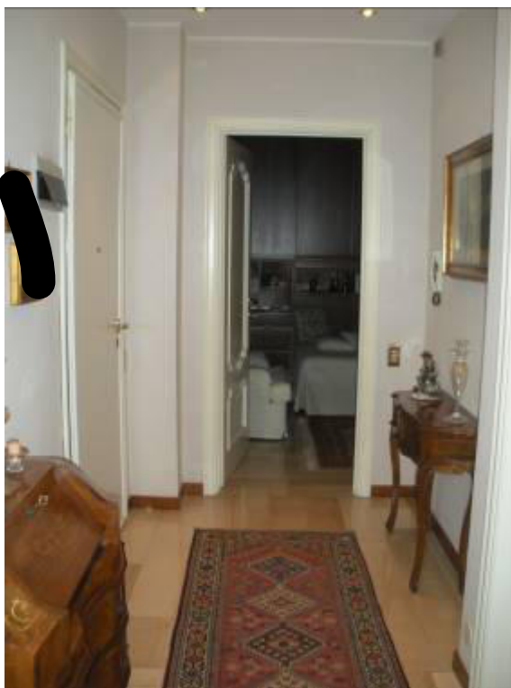
Fotografia 25 – Disimpegno verso seconda camera (con secondo ingresso dell'appartamento da porta blindata).