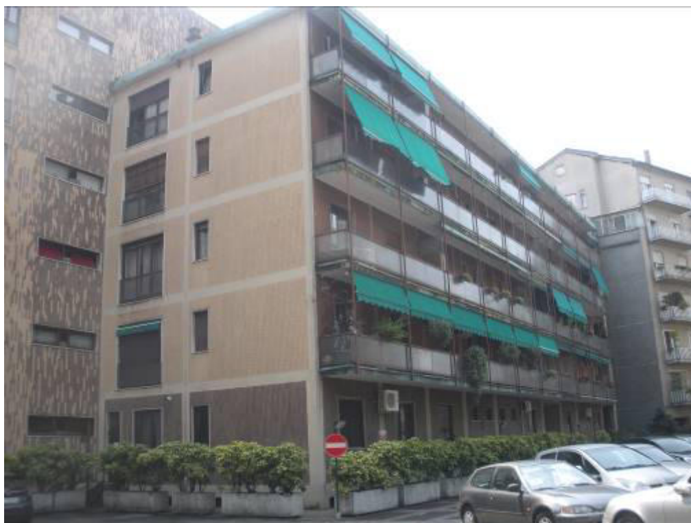
Fotografia 02– Facciata principale e laterale dell’edificio in cui è posto l’appartamento pignorato.