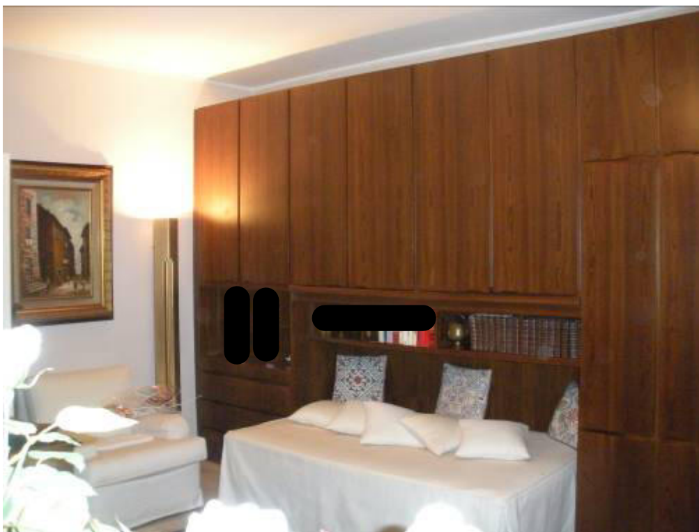
Fotografia 19 – Seconda Camera.