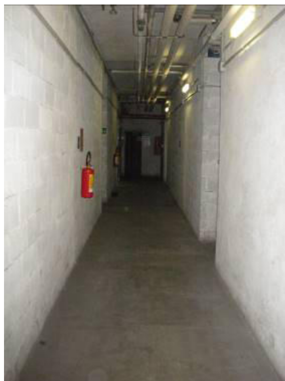
Fotografie 37-38 – Corridoi cantine.