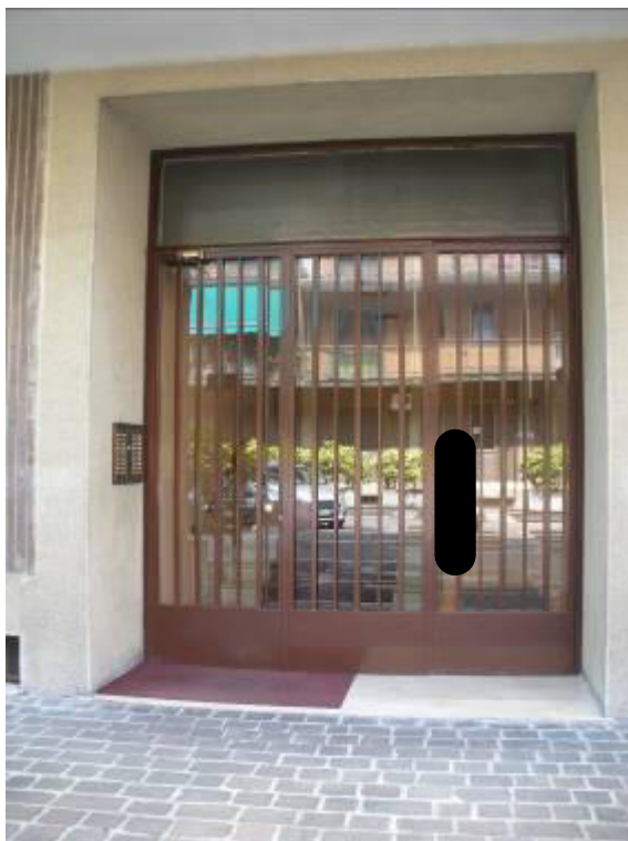
Fotografia 08 – Ingresso dell'edificio