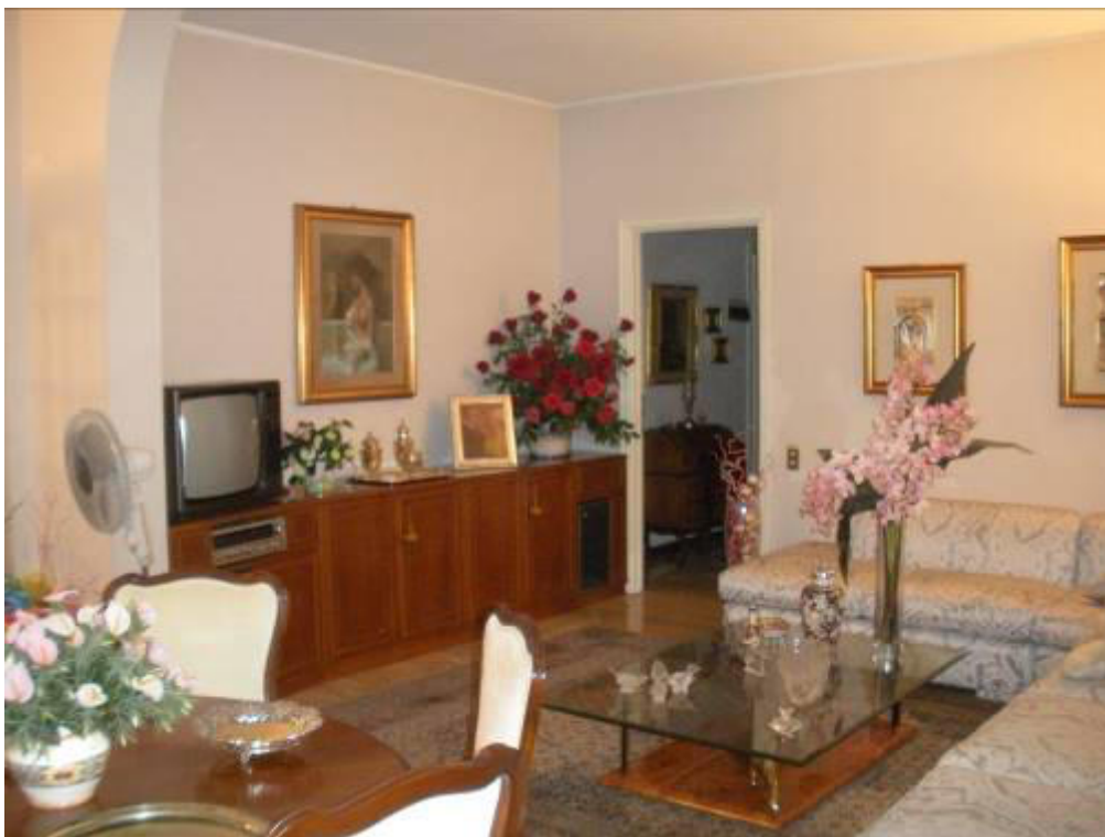
Fotografia 16 - Soggiorno/2