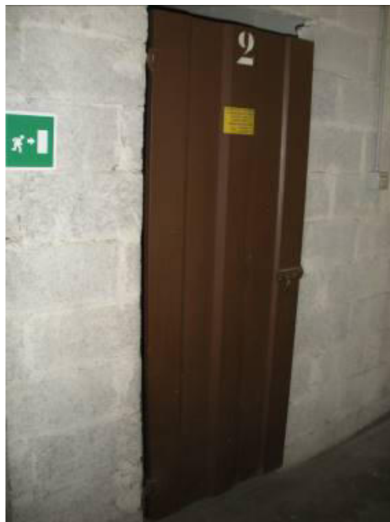
Fotografie 31-32 – Cantina identificata con il n. 2 (vicina al vano scala).