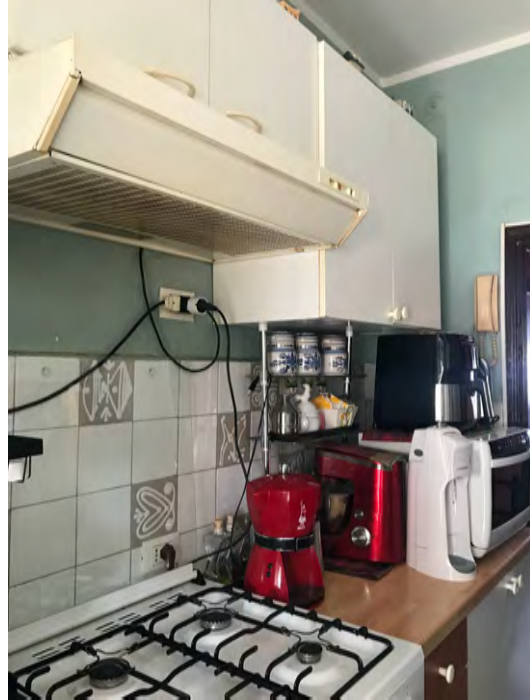
Immagini 21 e 22. La cucina.