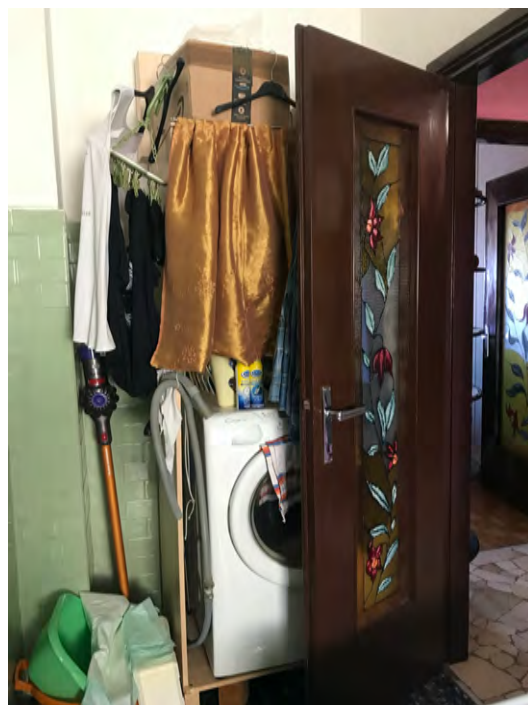
Immagini 17,18,19 e 20. Il bagno.