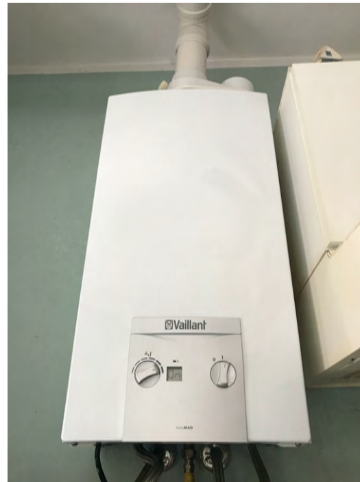
Immagini 23 e 24. Dettaglio della collocazione di contatore del gas e scaldabagno collocati all'interno della cucina.