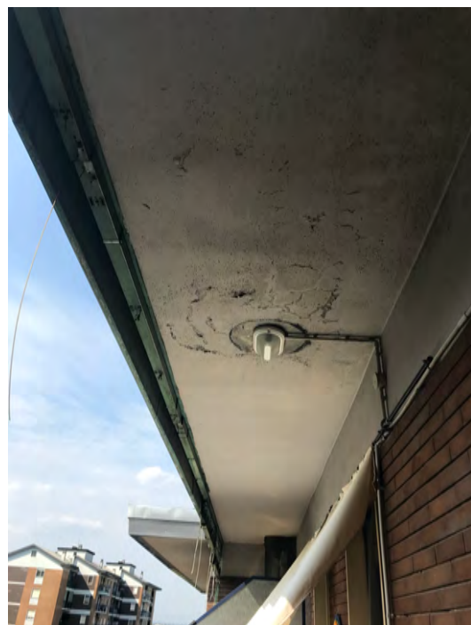
Immagini 27,28 e 29. Dettagli dei problemi interni all'unità immobiliari derivanti dalle infiltrazioni d'acqua dal piano soprastante.