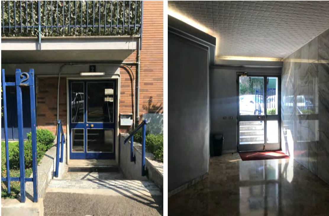
Immagine 4. Il portoncino di accesso al fabbricato inquadrato dall'esterno e dall'interno.