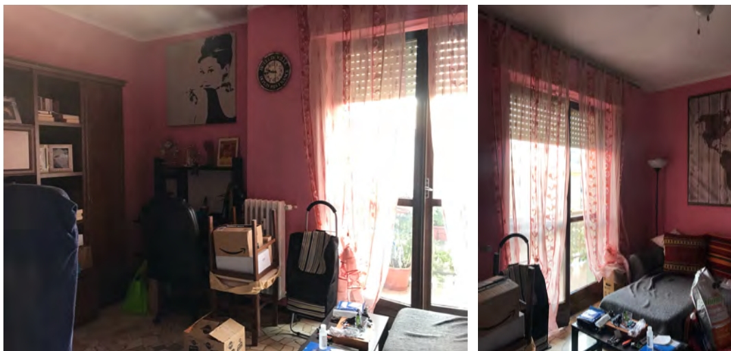
Immagini 11 e 12. Il Soggiorno.