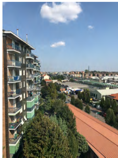
Immagini 25 e 26. Vista del cortile interno inquadrati dall'appartamento.