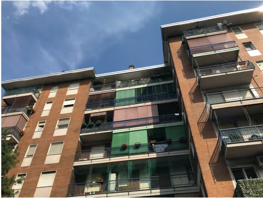
Immagine 1. Il fabbricato inquadrato da via Bellini.