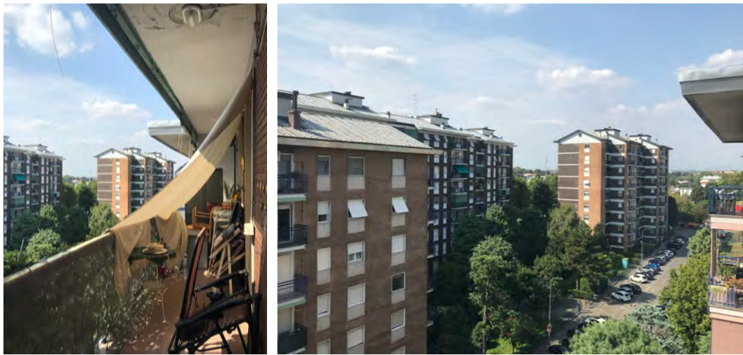
Immagini 13 e 14. Il balcone con accesso dal soggiorno e la vista dal balcone.