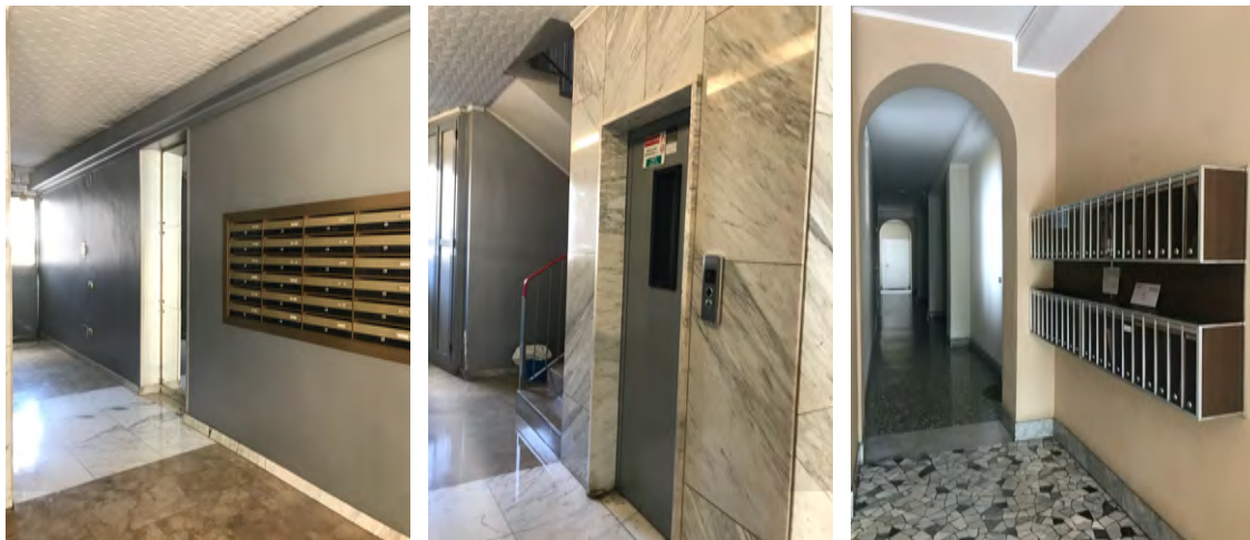
Immagini 5, 6, e 7. Vista delle parti comuni: l'ingresso e l'androne con la partenza delle scale, la collocazione delle cassette postali.