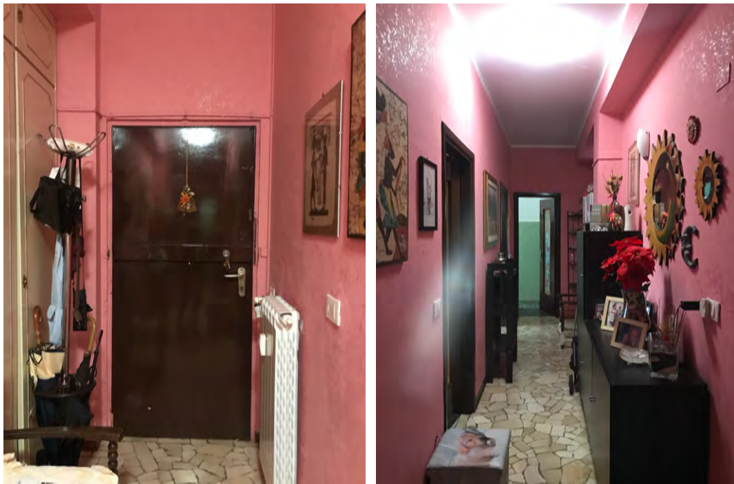
Immagini 9 e 10. Il portoncino di ingresso all'appartamento e il disimpegno che distribuisce i diversi locali.