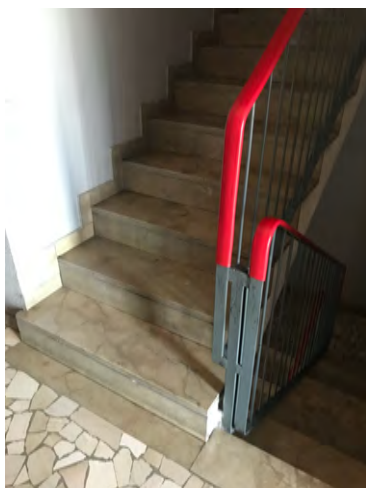
Immagine 8. La scala che collega i diversi piani.