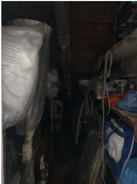
Immagini 30, 31, 32. Gli spazi comuni che consentono l'accesso al solaio, lo spazio inquadrato dall'interno.