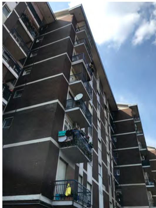
Immagini 2 e 3. Il fabbricato inquadrato dalla via principale e dal cortile interno.