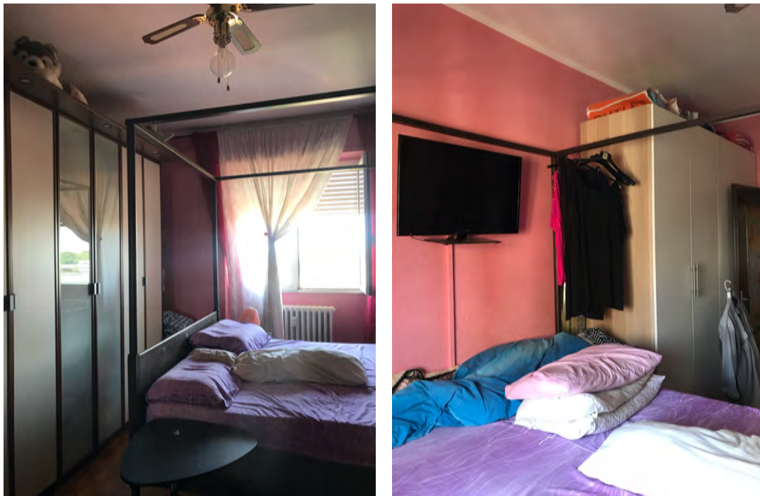
Immagini 15 e 16. La camera da letto.