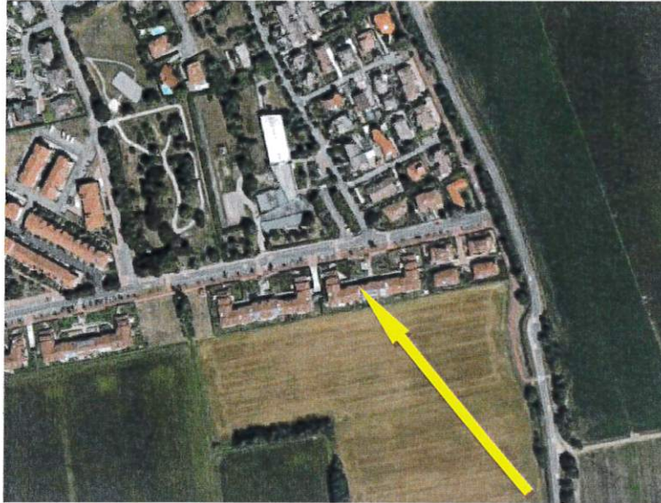
Inquadramento territoriale: estratto Google Maps

I beni sono ubicati nell'area suburbana di Rodano denominata Millepini, a prevalente carattere residenziale e agricolo, poco fuori Milano. Il traffico nella zona è locale e le aree a parcheggi sono sufficienti. Presenti servizi di urbanizzazione primaria e secondaria e le seguenti attrazioni storiche o culturali: Museo dello scooter e della Lambretta.