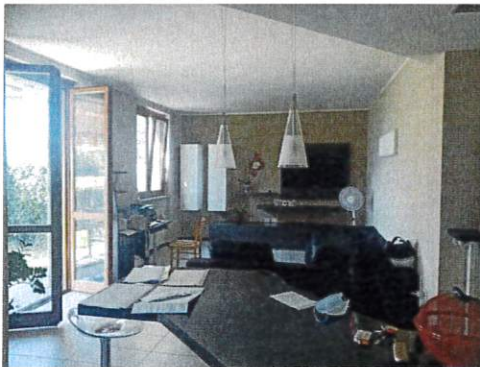
Particolare interno soggiorno cottura

L'intero edificio sviluppa 4 piani di cui 3 piani fuori terra e 1 piano interrato.