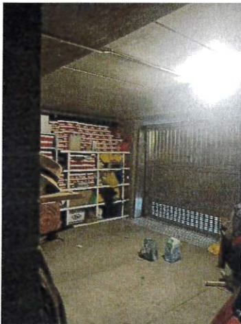
Particolare interno box