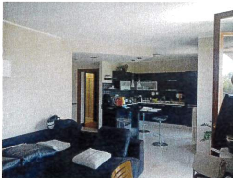
Particolare interno soggiorno cottura