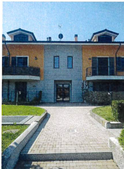
Particolare esterno edificio