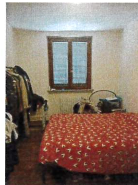
Particolare interno camera