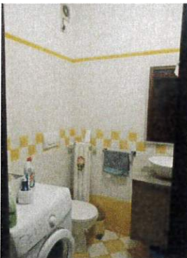
Particolare interno wc