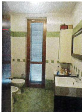
Particolare interno bagno