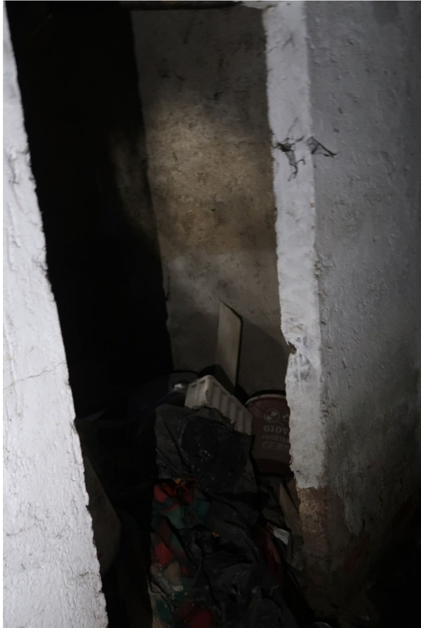
INTERNO CANTINA N. 107