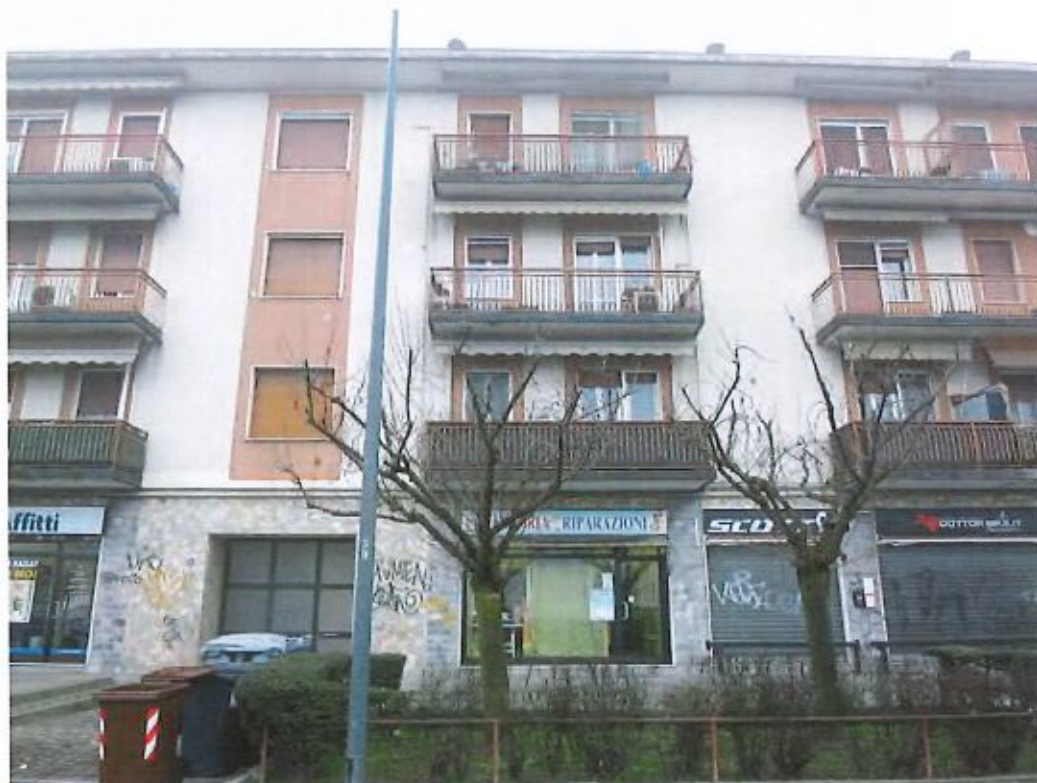
Viste esterne del complesso immobiliare