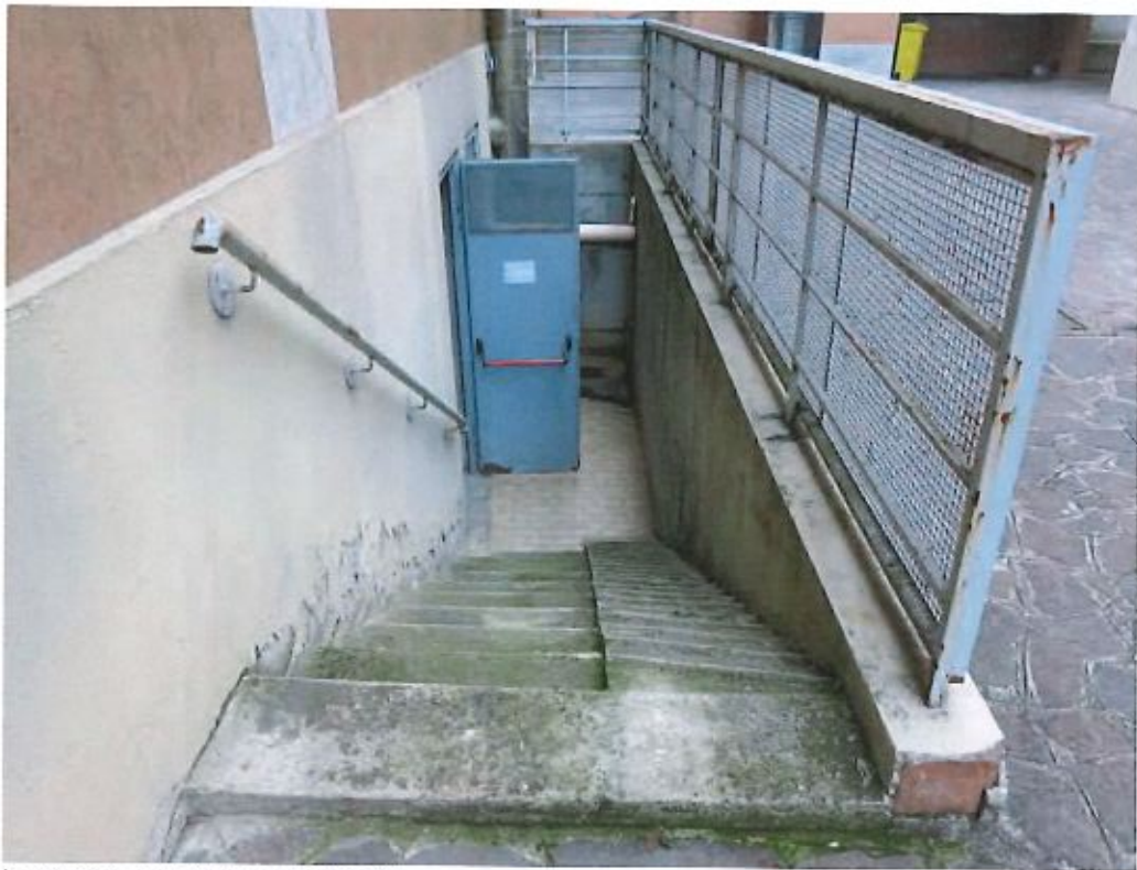
Ingresso al piano cantinato