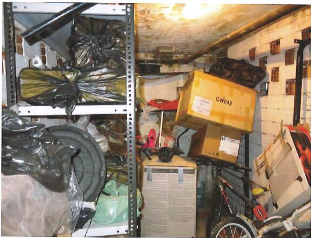
Vista interna della cantina