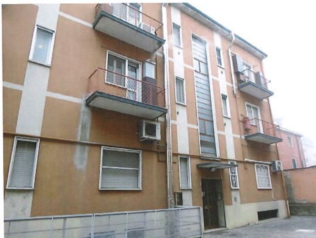
Cortile interno e ingresso al fabbricato ove è sito l'appartamento