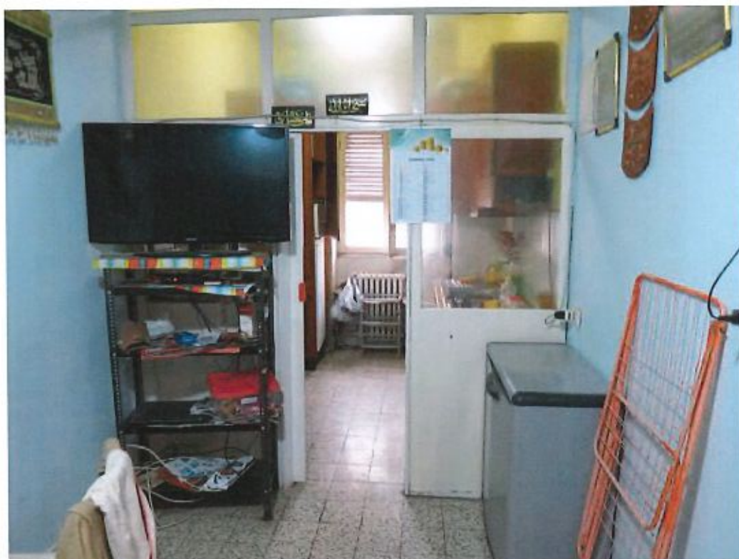
Vista verso la cucina