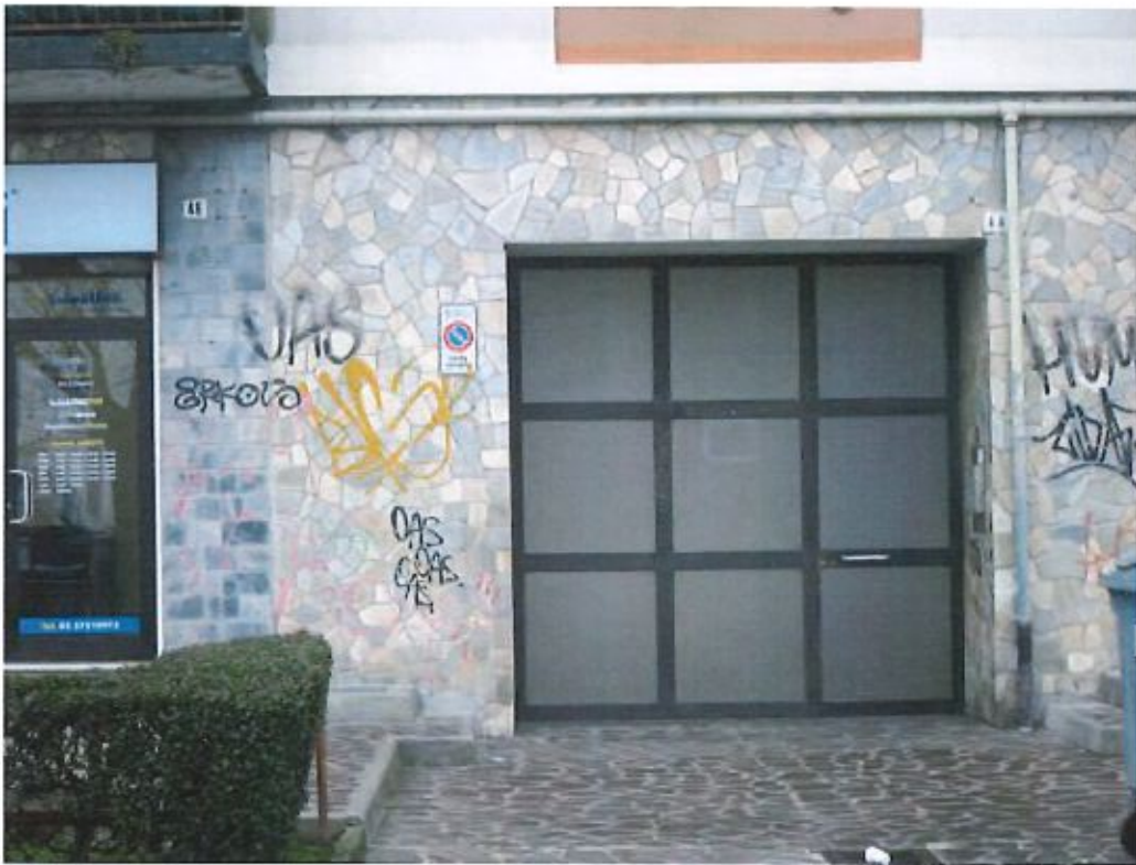
Portone di ingresso al complesso immobiliare