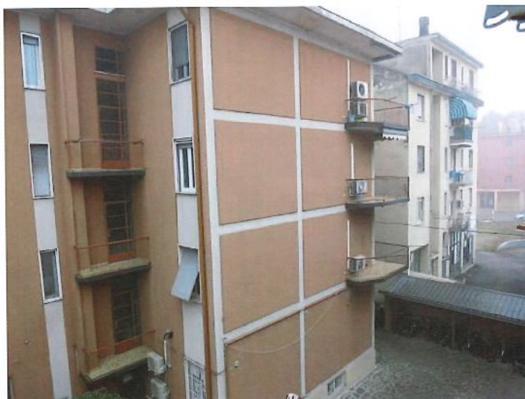
Vista dal balcone