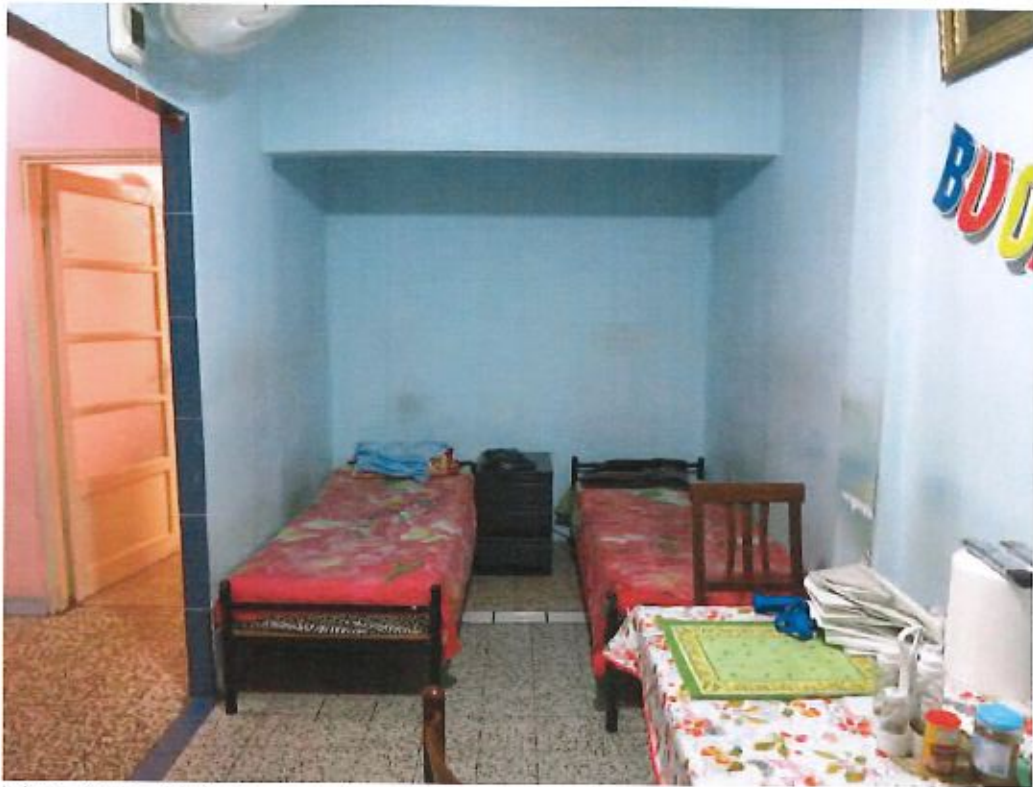
Vista dalla cucina