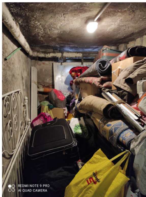
Fig.12: vista interna cantina.