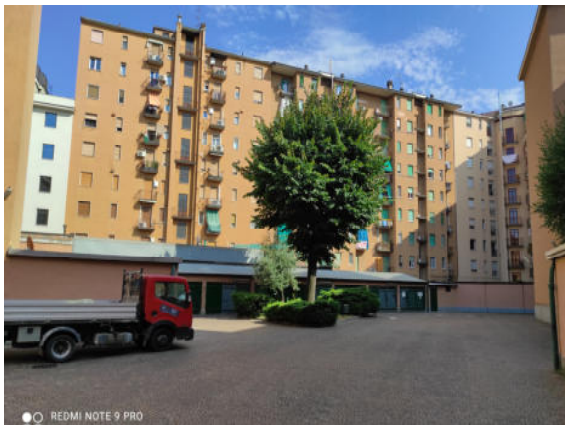
Fig.3: vista cortile interno.