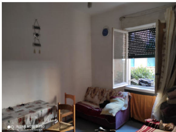
Fig.9: vista soggiorno.