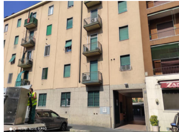
Fig.1-2: viste edificio da Via Latisana.