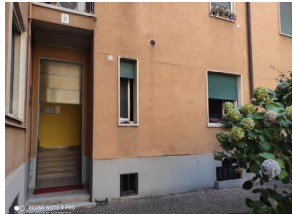
Fig.4: particolare ingresso scala B.