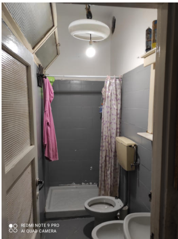
Fig.11: vista servizio igienico.