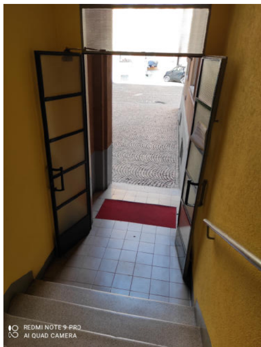
Fig.5: vista ingresso Condominio – scala B.