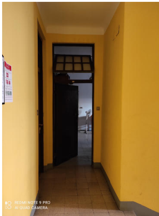
Fig.6: vista ingresso appartamento.