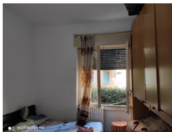
Fig.10: vista camera da letto.