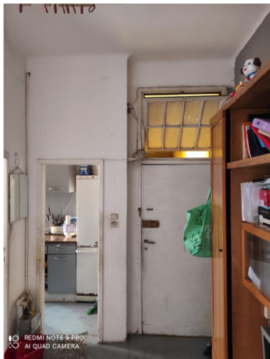
Fig. 7: ingresso abitazione.