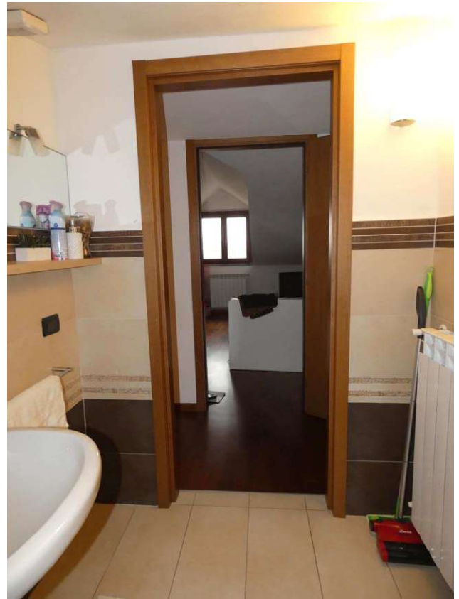
Foto 20. Bagno al piano terzo sottotetto