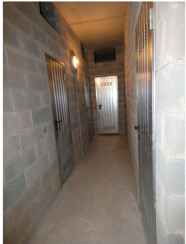
Foto 9. Corridoio cantine