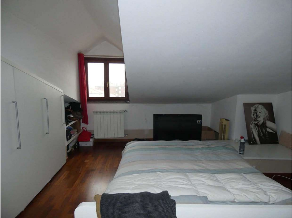
Foto 22. Sottotetto non abitabile