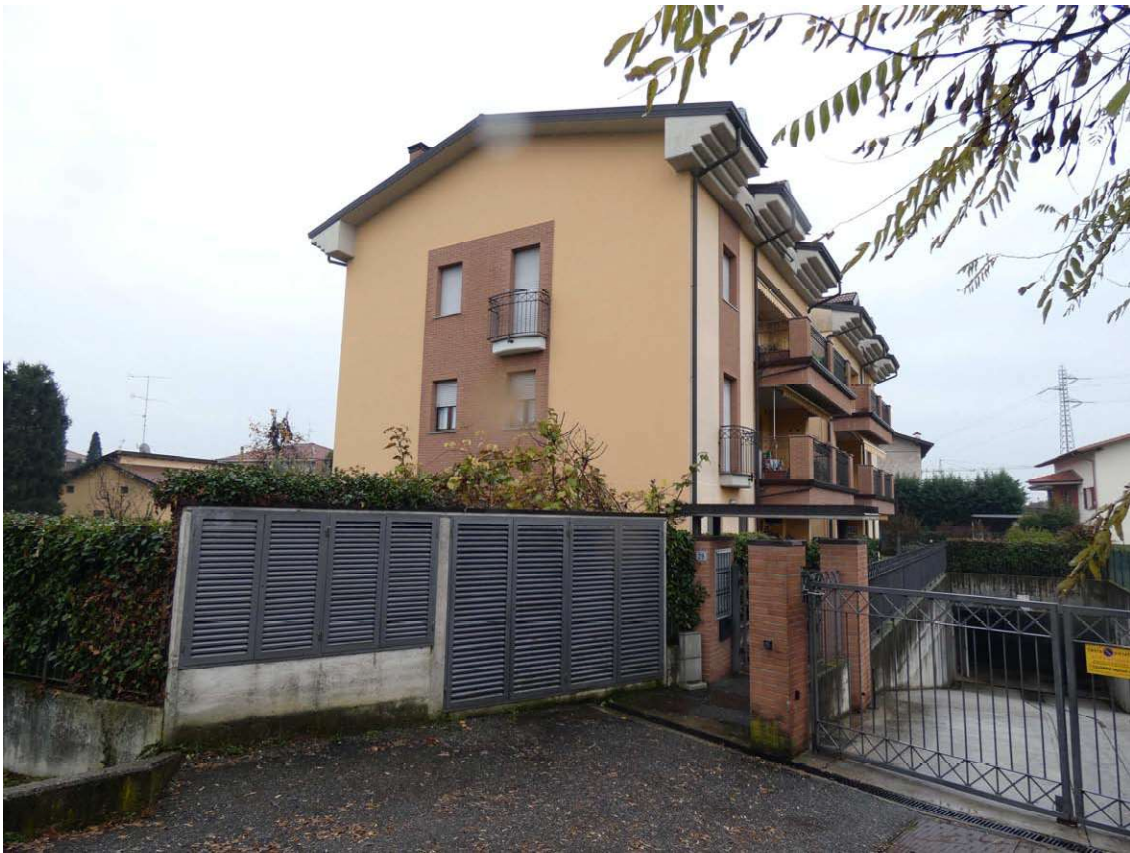
Foto 1. Prospetto su Via Pietro Nenni