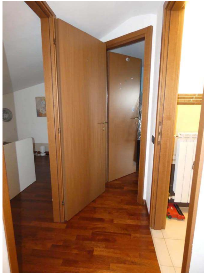
Foto 23. Sottotetto non abitabile