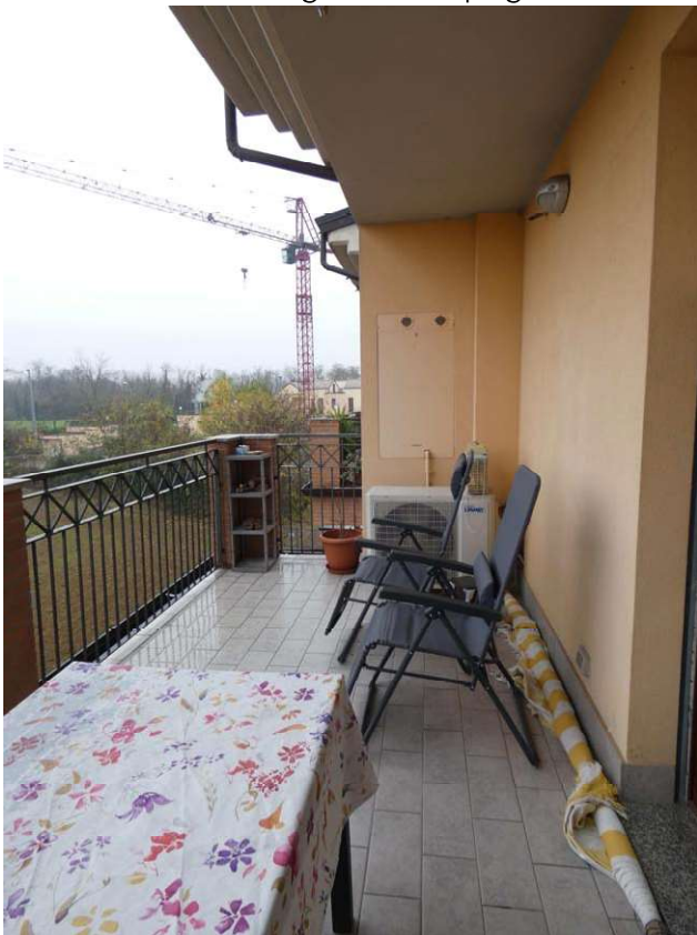
Foto 17. Terrazzo