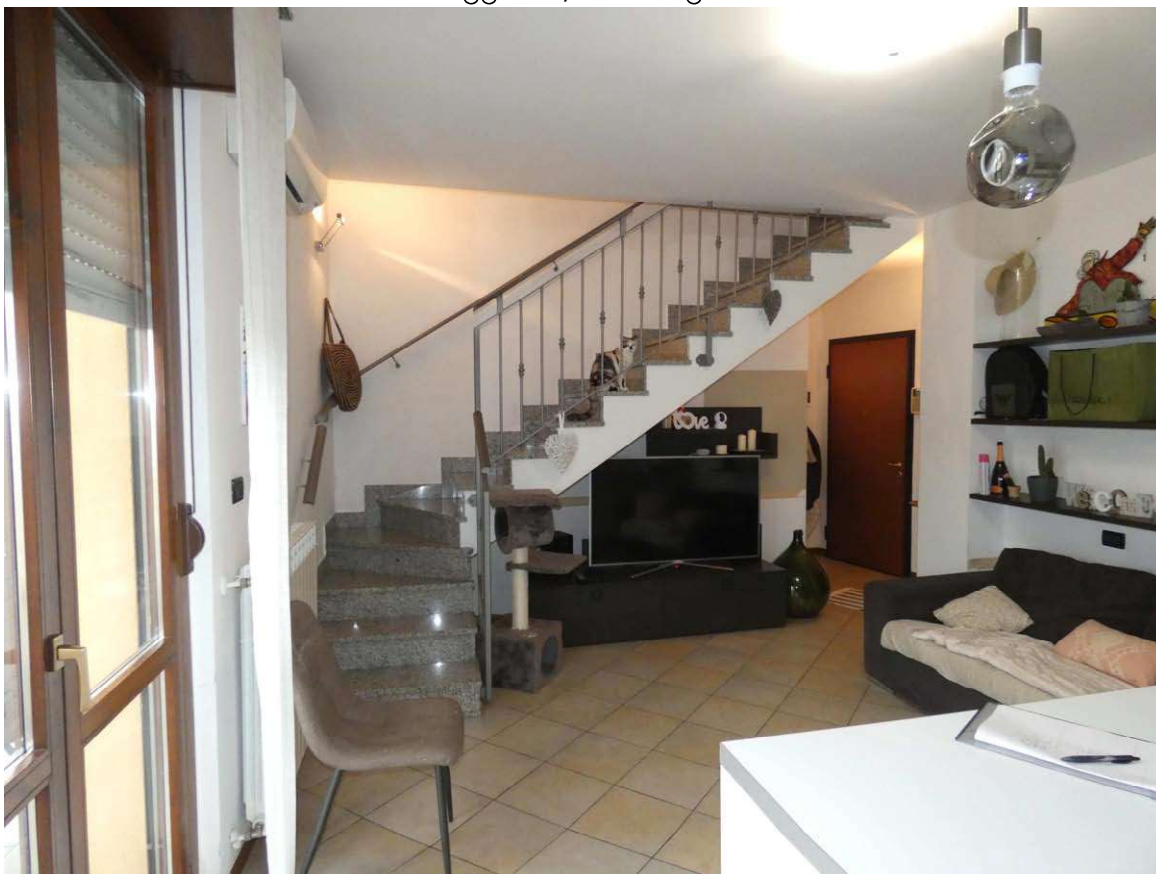
Foto 14. Soggiorno/notte