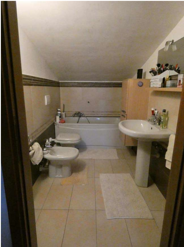
Foto 19. Bagno al piano terzo sottotetto