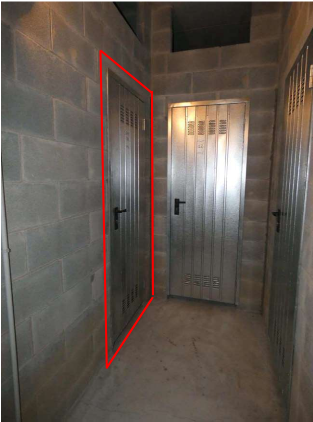
Foto 10. Porta d'accesso alla cantina