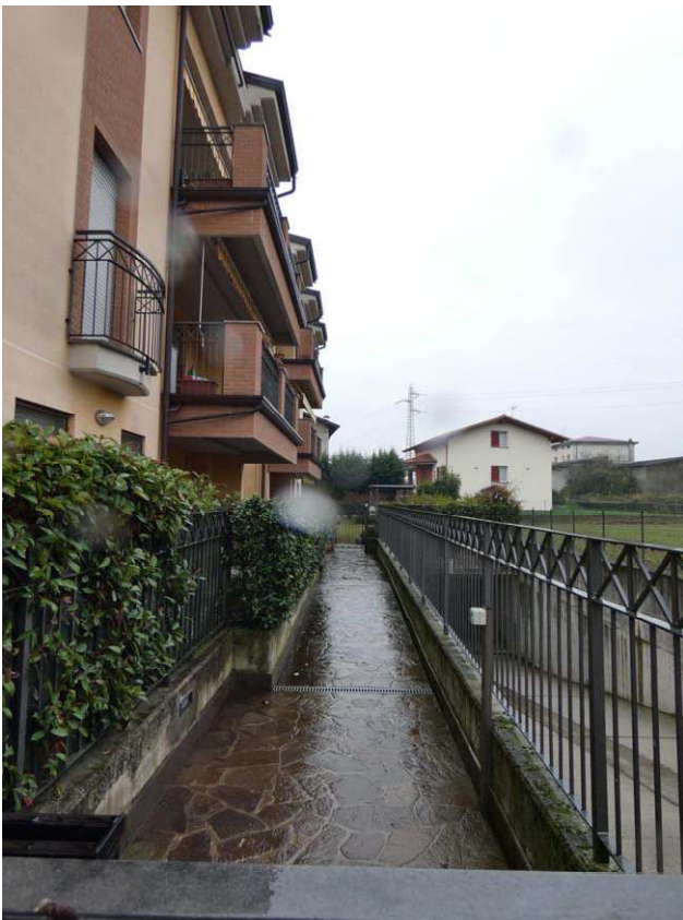
Foto 4. Passaggio pedonale d'accesso all'ingresso dell'edificio