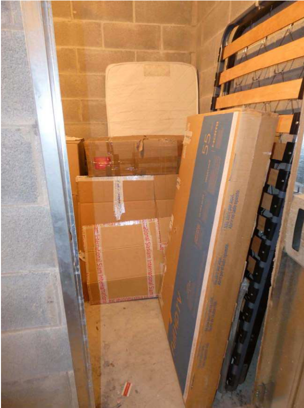
Foto 24. Cantina