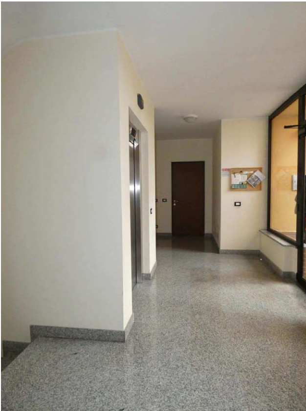
Foto 6. Androne d'ingresso