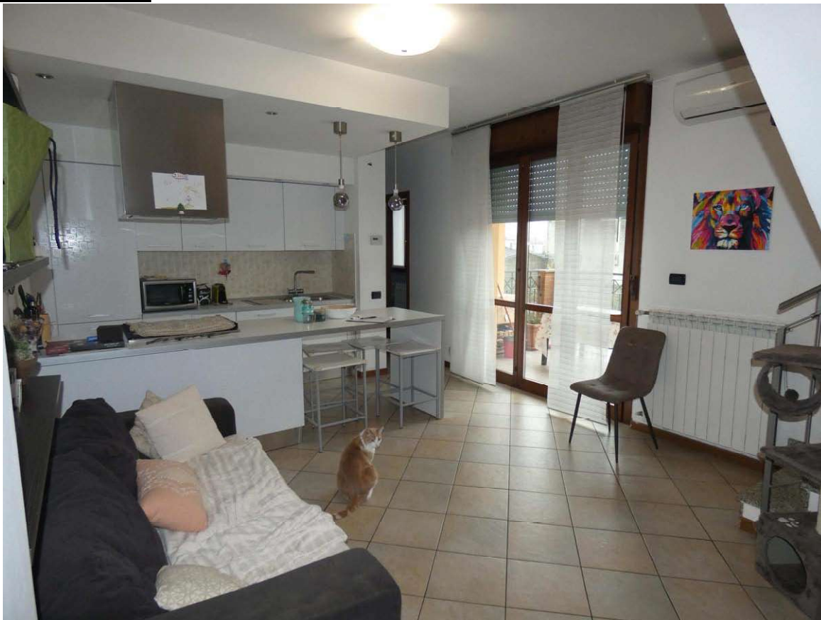
Foto 13. Soggiorno/notte angolo cottura