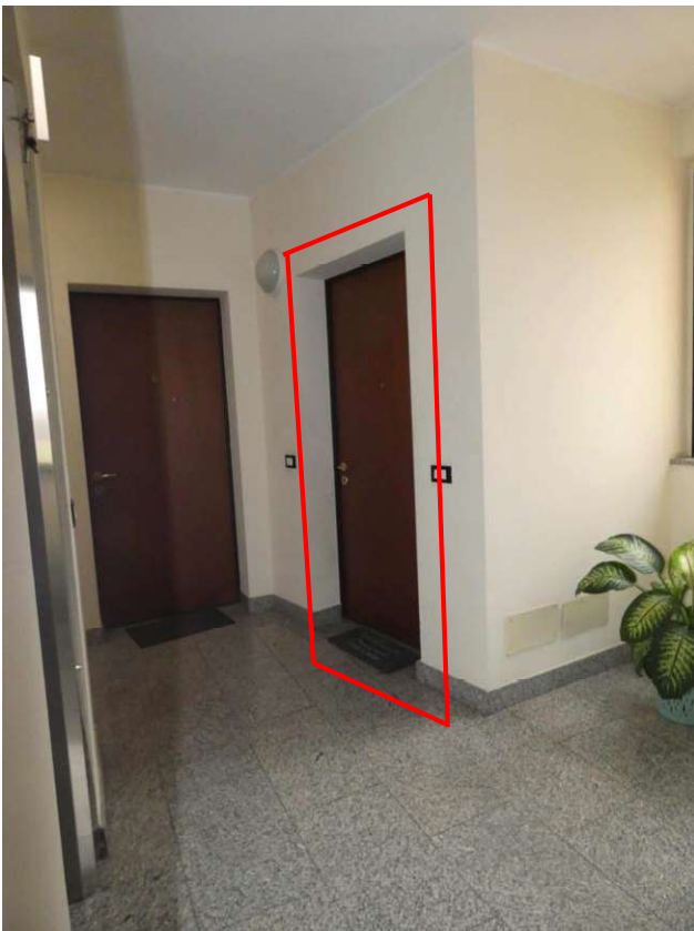
Foto 8. Porta d'ingresso all'appartamento