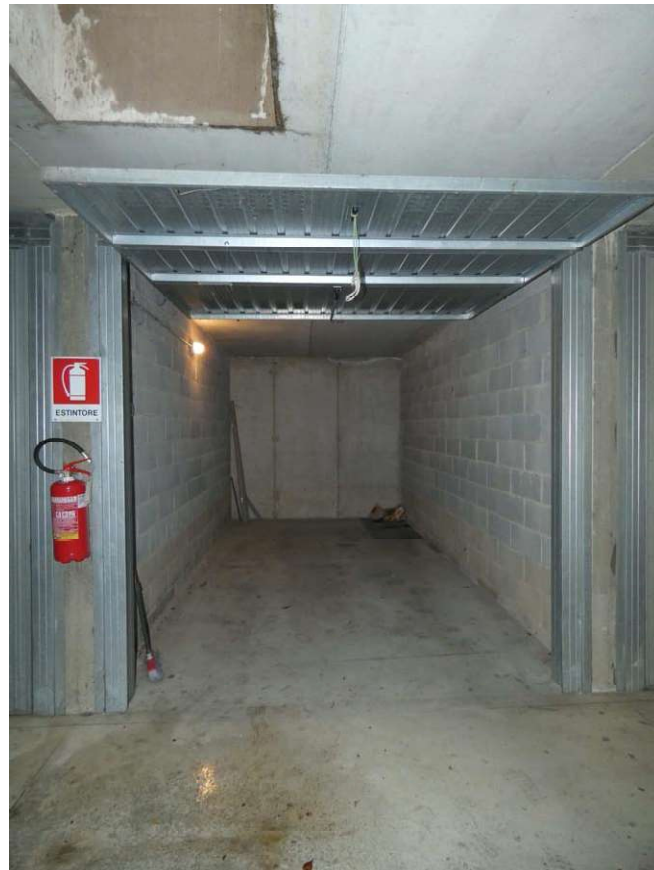
Foto 26. Box auto