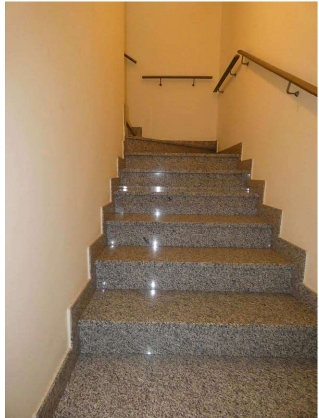
Foto 7. Vano scale