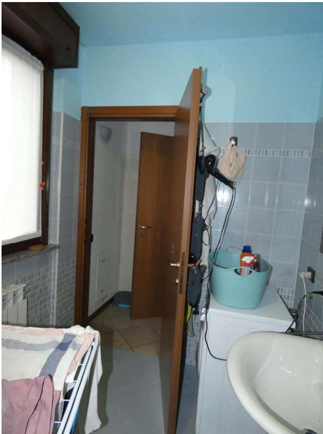
Foto 15. Bagno e disimpegno