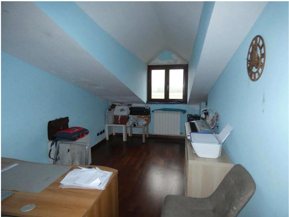
Foto 21. Sottotetto non abitabile