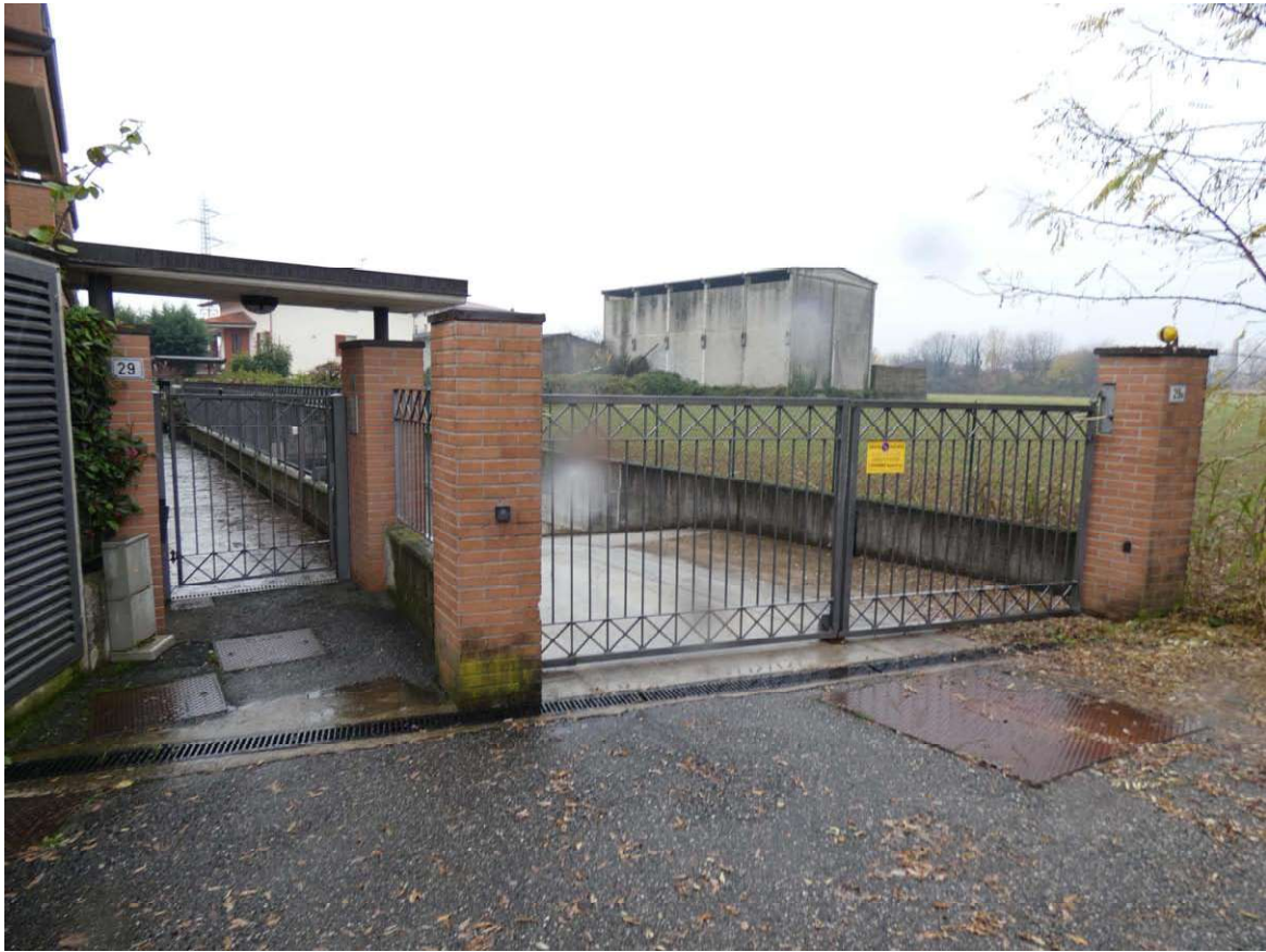
Foto 3. Accessi pedonale al civico 29 e carraio al civico 29A