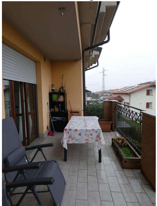
Foto 18. Terrazzo