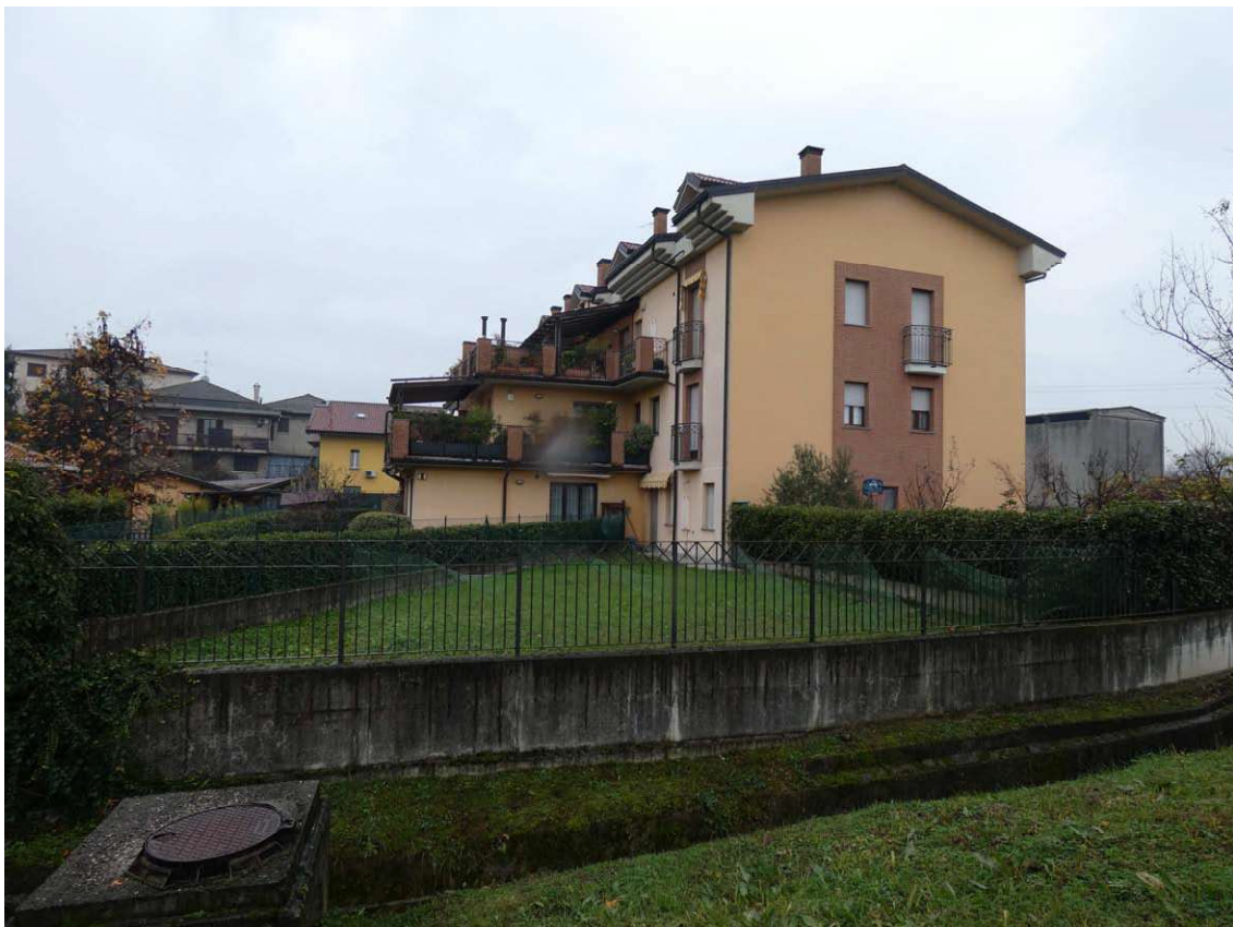
Foto 2. Prospetto su Via San Martino