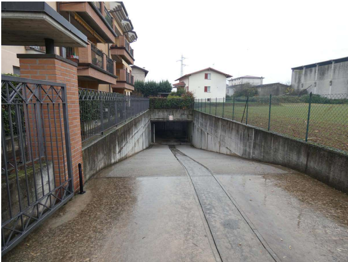
Foto 12. Rampa d'accesso ai box auto