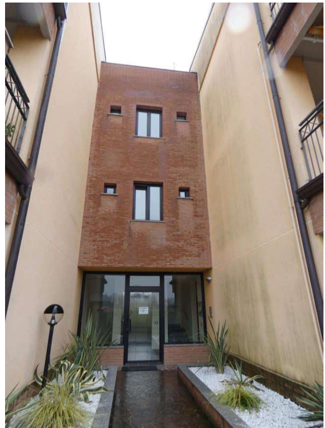
Foto 5. Portone d'ingresso