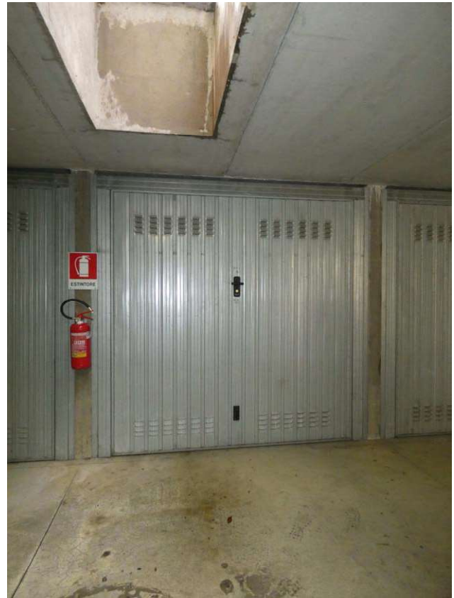
Foto 11. Portone d'accesso al box auto