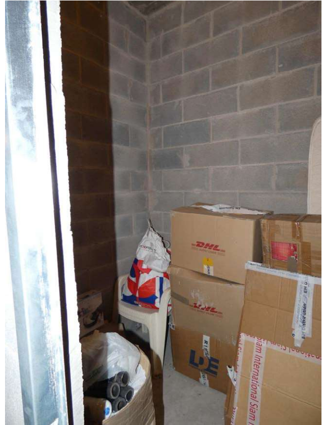
Foto 25. Cantina