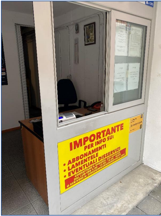
Foto 4 - dettaglio serramenti esterni