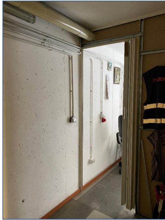
Foto 13 - interni