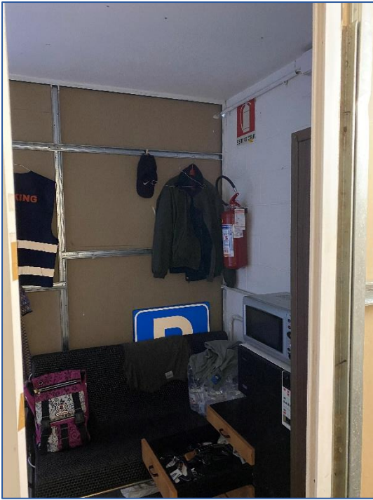
Foto 12 - interni