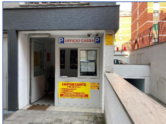
Foto 3 - ingresso