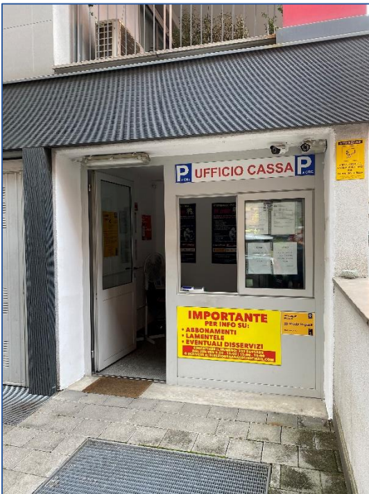
Foto 2 - ingresso