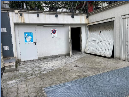
Foto 1 - cortile comune