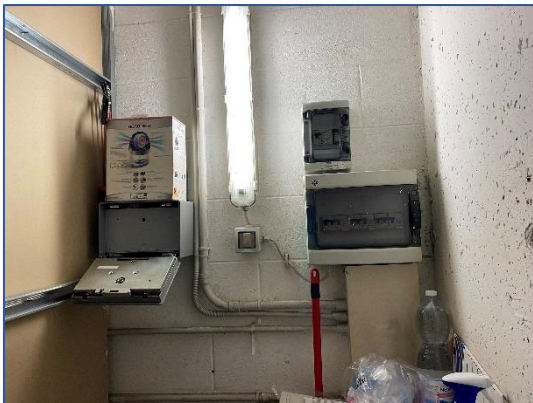
Foto 10 - dettaglio impianti