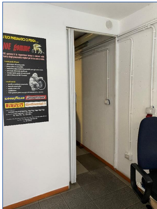
Foto 7 - interni