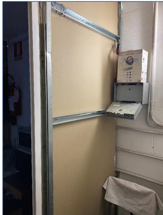
Foto 11 - interni