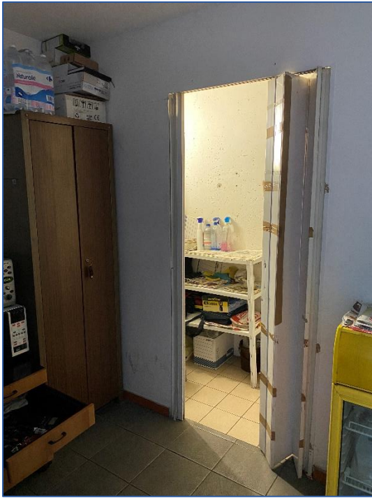
Foto 8 - interni