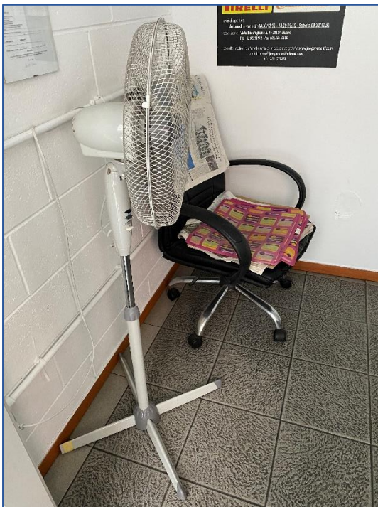
Foto 6 - interni