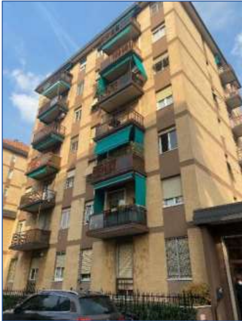
Foto 1 - immobile di via Zurigo 12/2