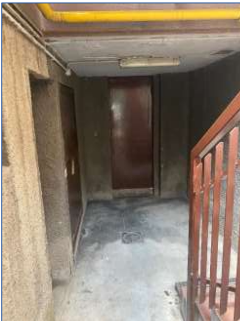
Foto 11 - ingresso da cortile comune