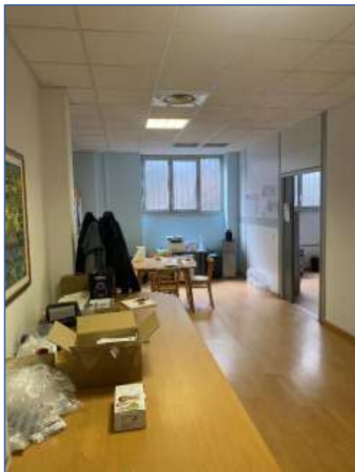
Foto 23 - interni