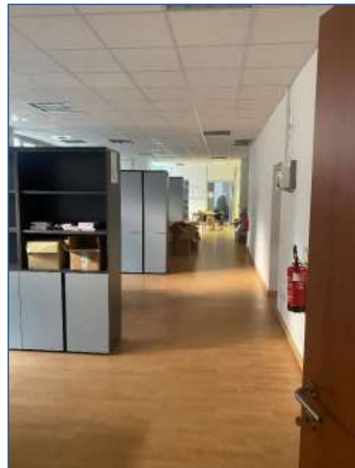
Foto 12 - ufficio openspace