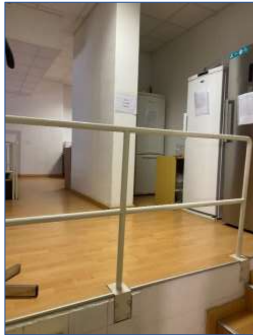
Foto 26 - interni