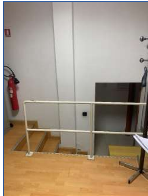
Foto 32 - interni