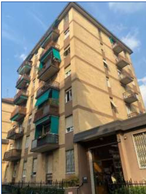
Foto 3 - immobile di via Zurigo 12/2