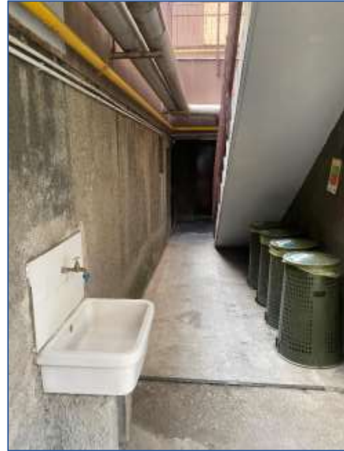
Foto 10 - spazi comuni esterni