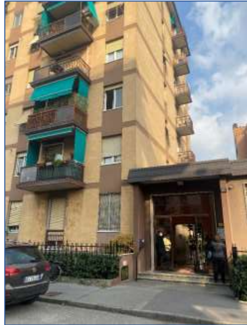
Foto 2 - immobile di via Zurigo 12/2