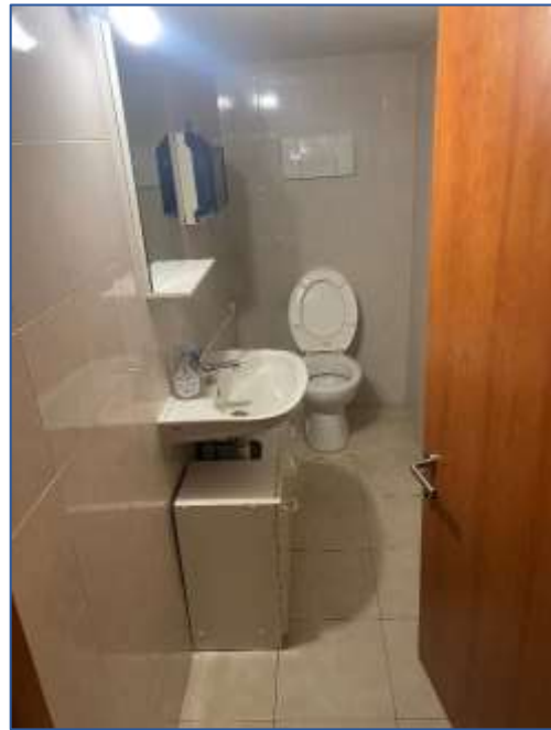
Foto 34 - bagno