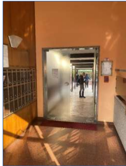
Foto 6 - atrio