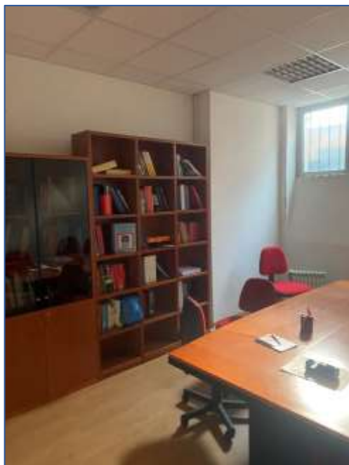
Foto 17 - ufficio