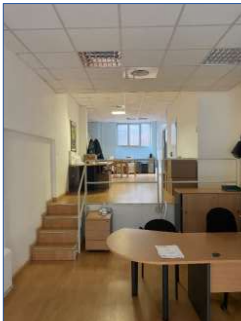
Foto 20 - interni