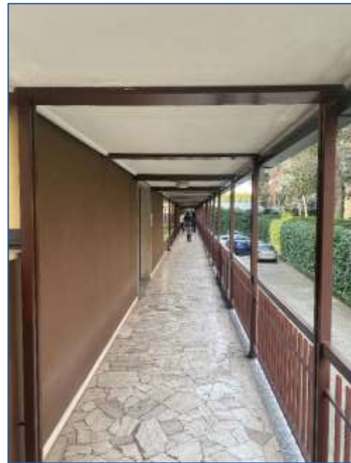
Foto 8 - passerella esterna di collegamento