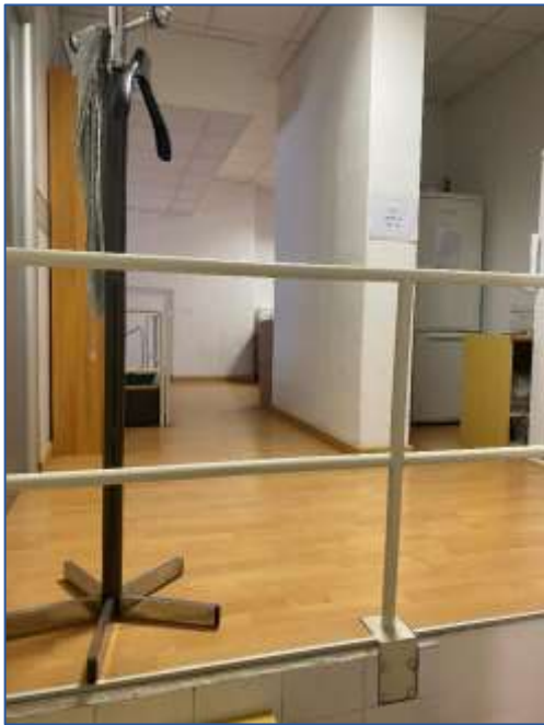
Foto 25 - interni