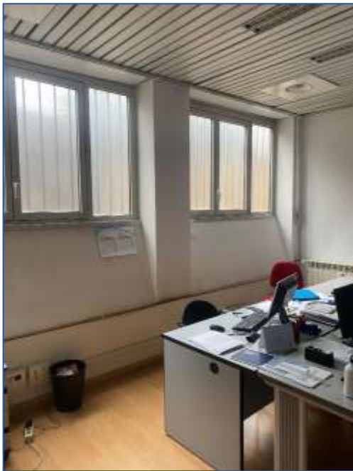
Foto 27 - ufficio