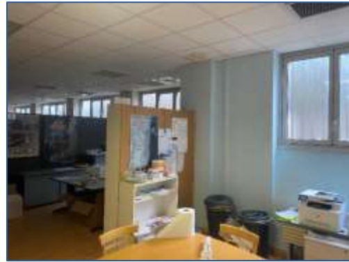
Foto 14 - ufficio openspace