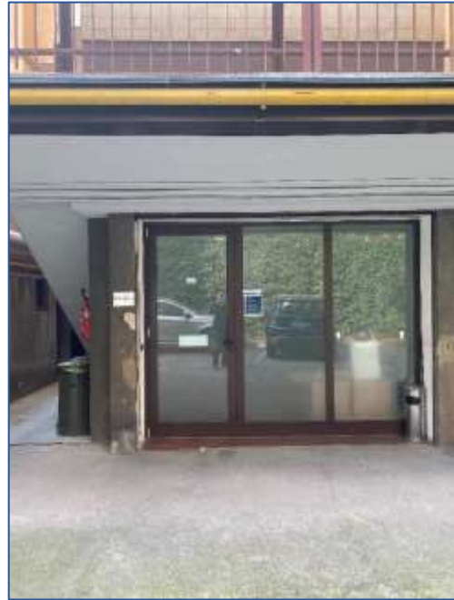
Foto 19 - ingresso