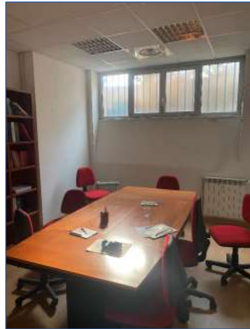
Foto 16 - ufficio