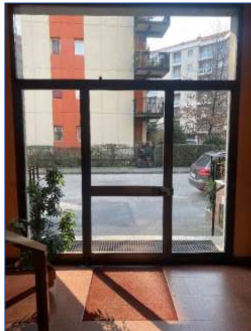
Foto 4 - ingresso comune