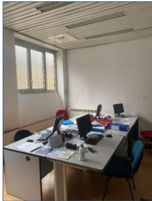
Foto 28 - ufficio