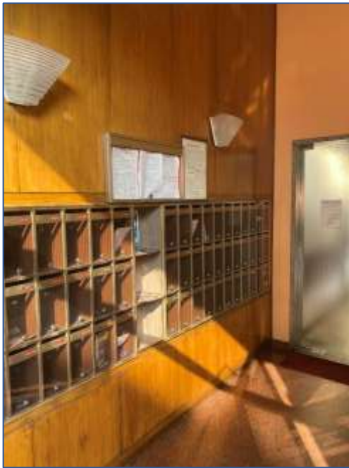
Foto 5 - atrio