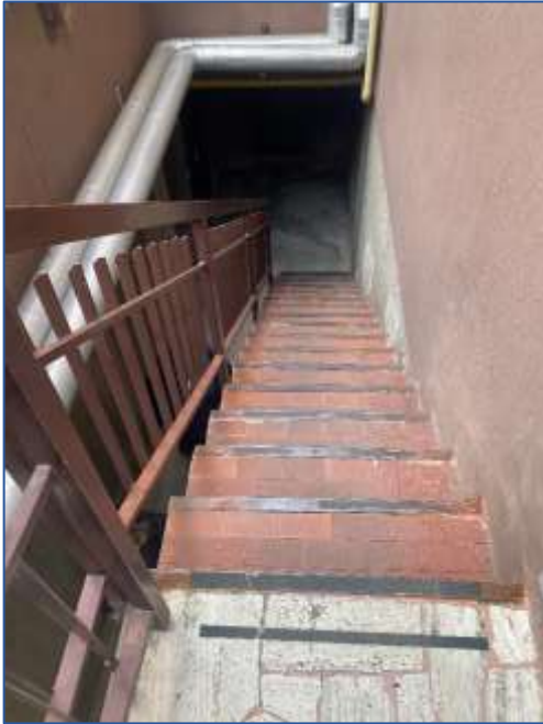
Foto 9 - scala comune esterna