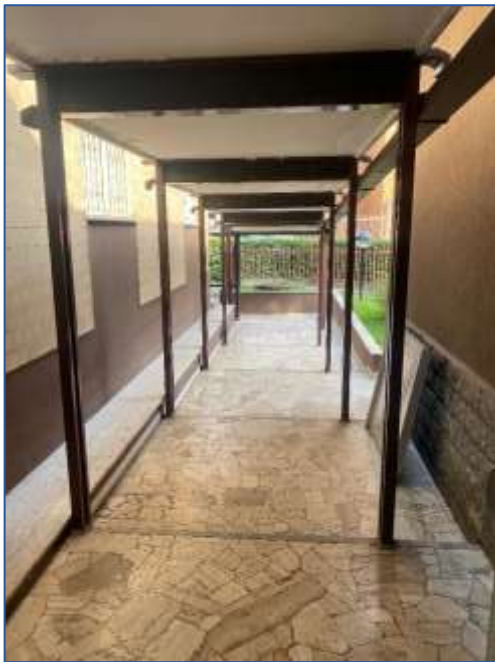
Foto 7 - passerella esterna di collegamento