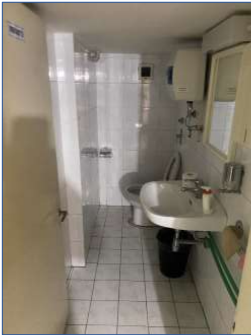
Foto 33 - bagno