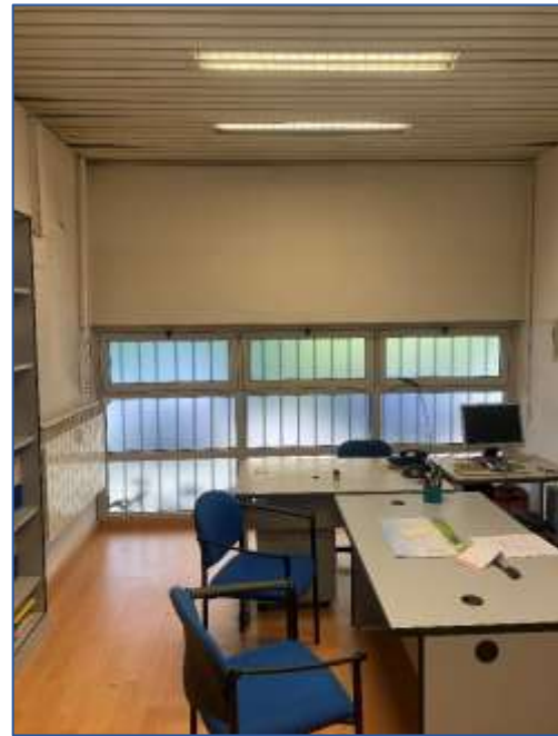
Foto 30 - ufficio