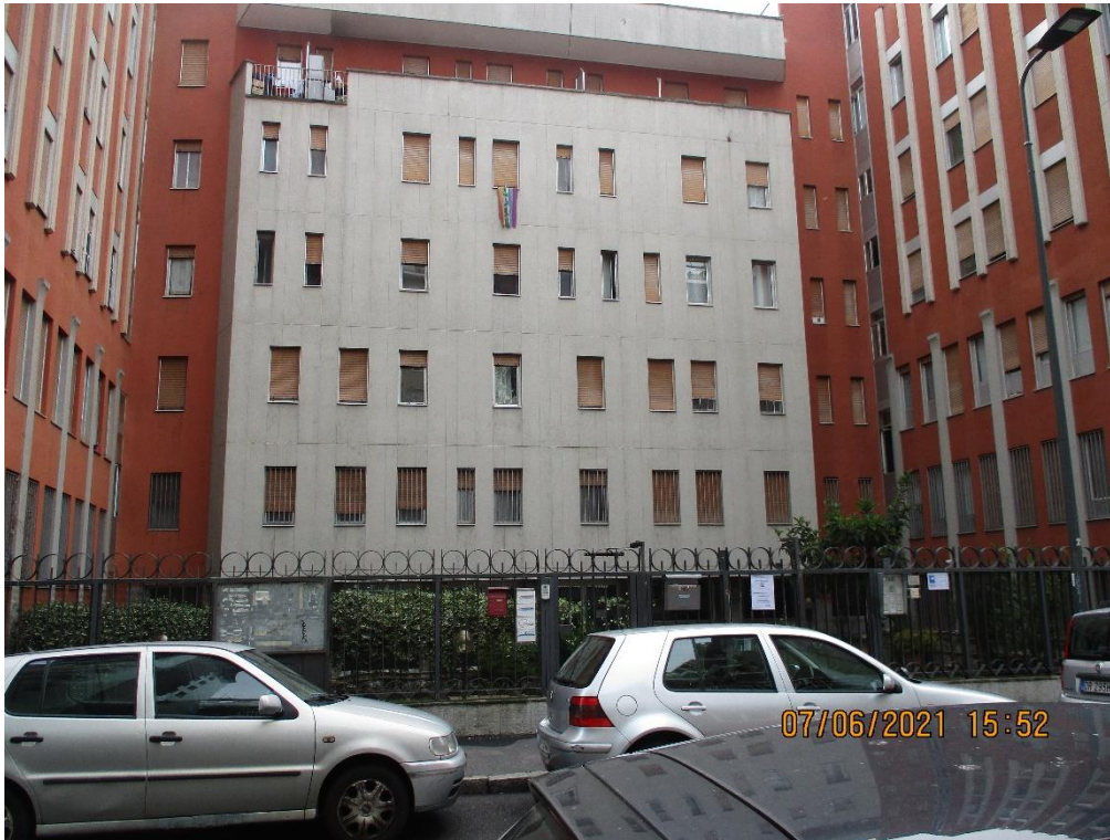
Vista da Via Momigliano