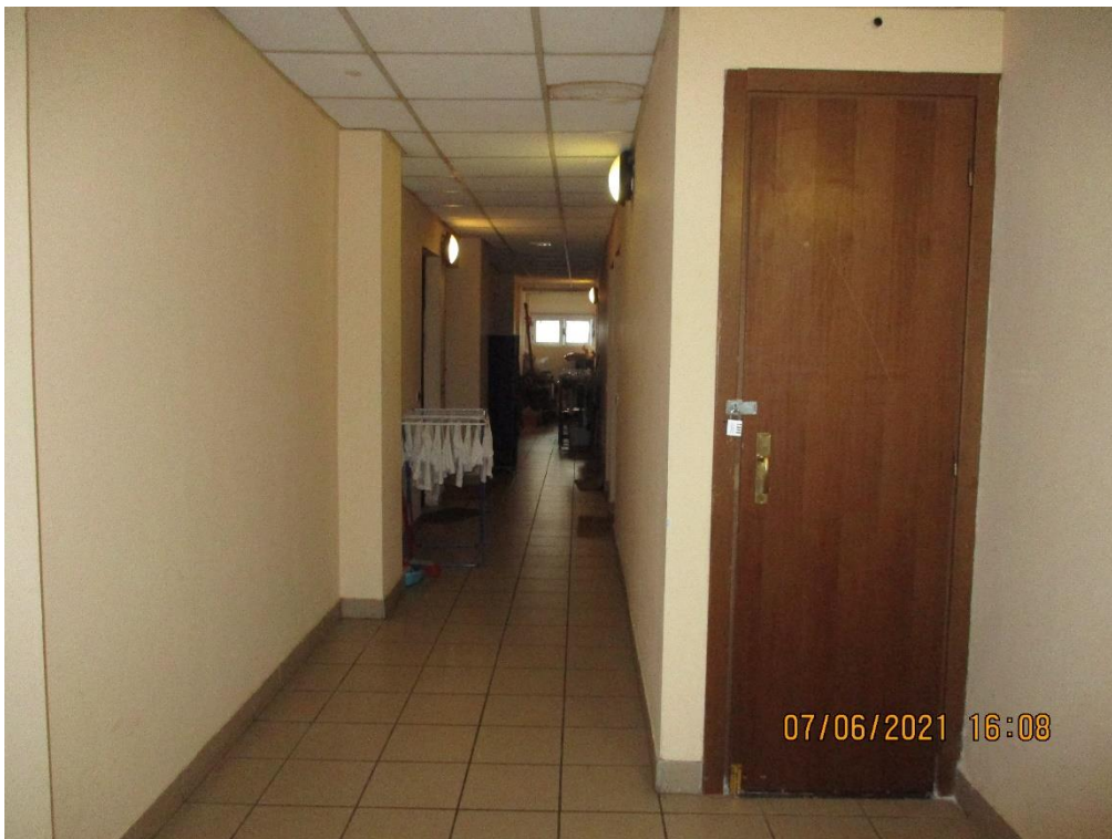
Corridoio comune delle unità immobiliari