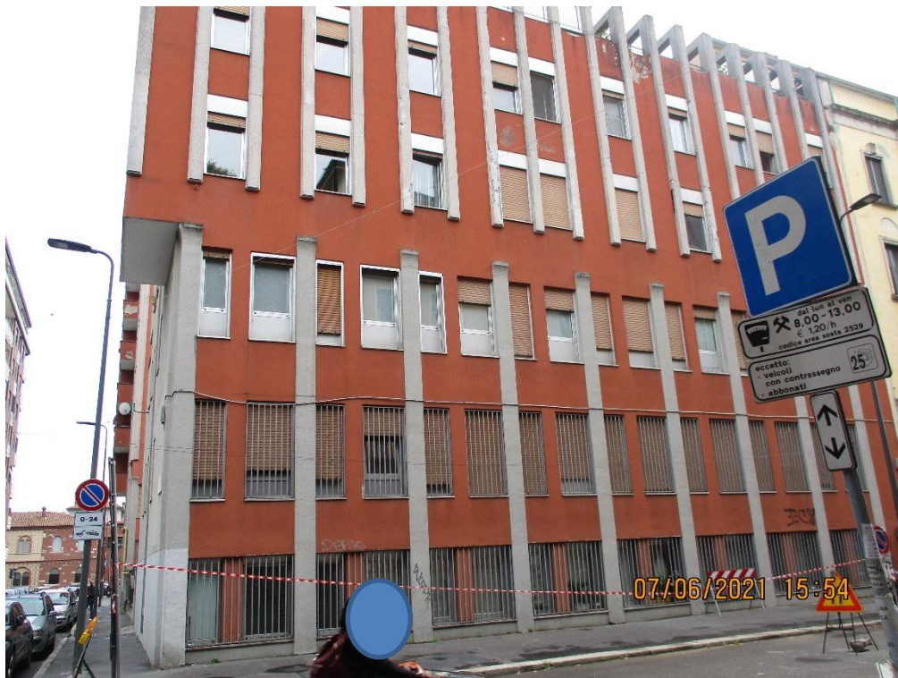
Vista da Via Barilli