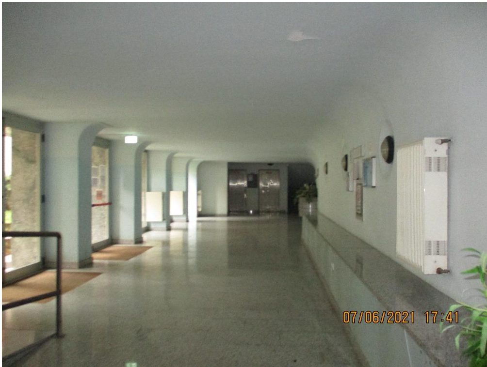
Atrio ingresso del complesso