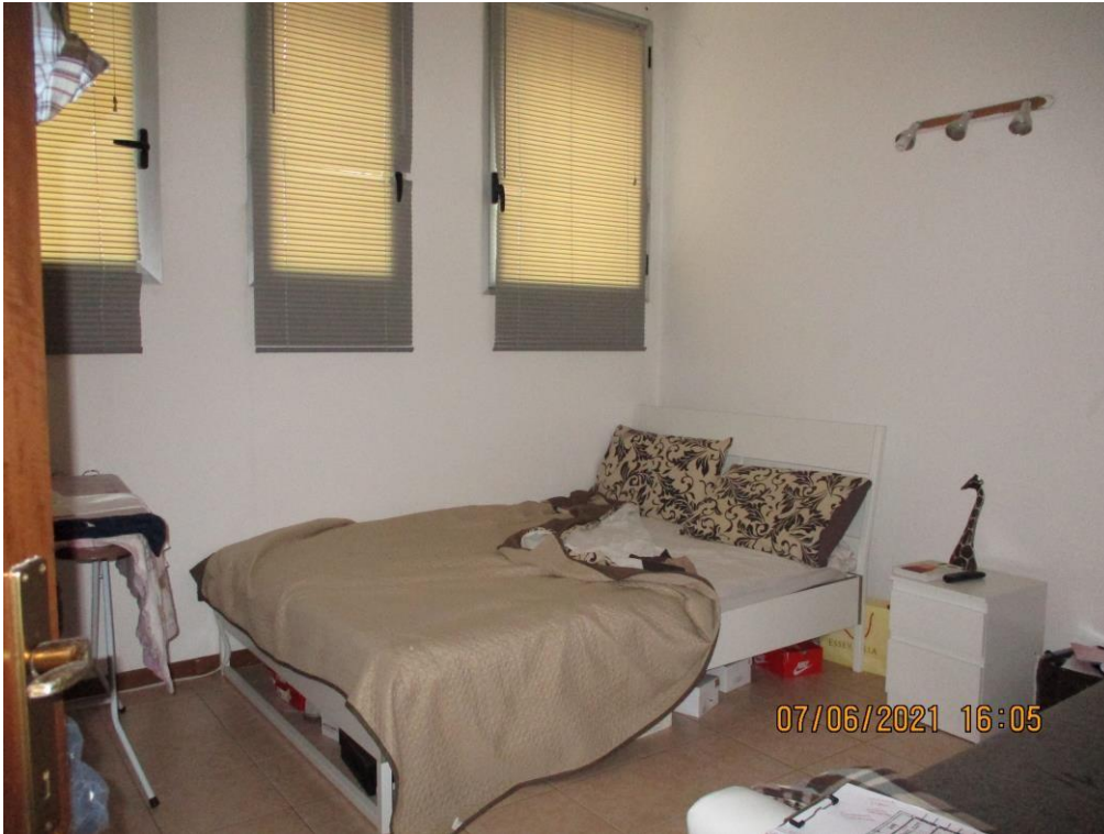
unità immobiliare – camera