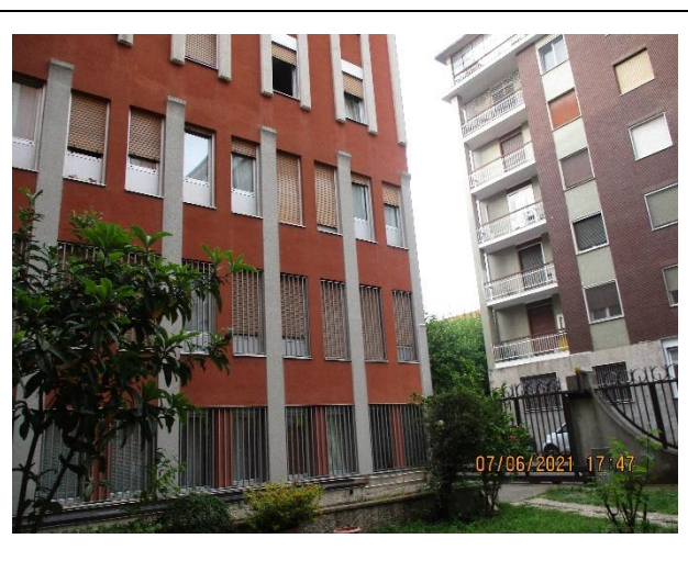
Vista dei serramenti delle unità dal cortile comune