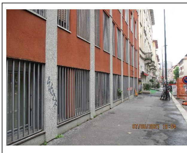
Vista dei serramenti delle unità verso Via Barrili

Principali collegamenti pubblici: tram linea 3, MM2 fermata Abbiategrasso