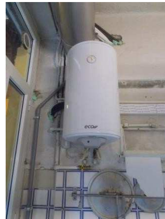
40. Boiler elettrico in cucina