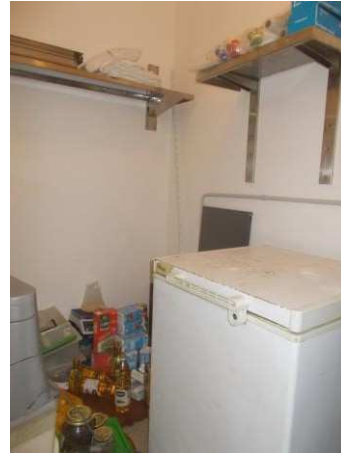
36. Interno del deposito in muratura