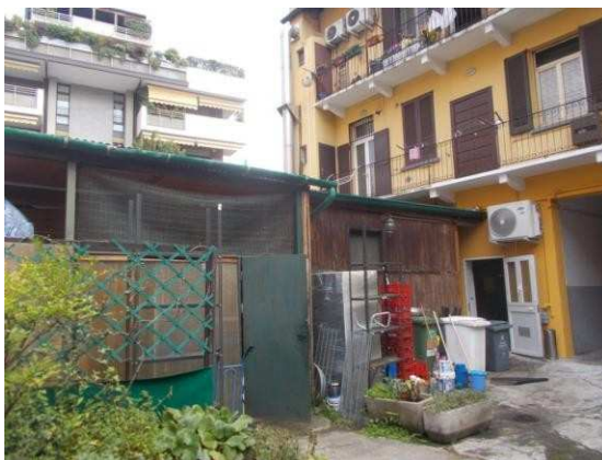
33. Panoramica dal cortile interno