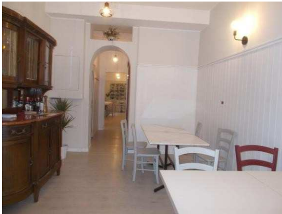
11. Sala ristorante