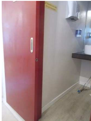
37. Porta interna scorrevole