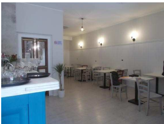
9. Sala ristorante