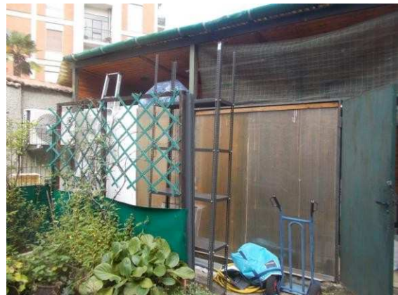
32. Vista del deposito dall'esterno