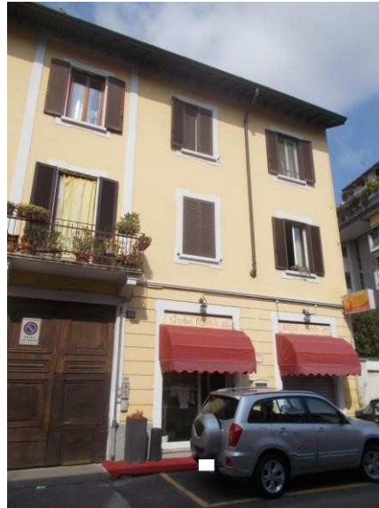
2. Panoramica del fabbricato