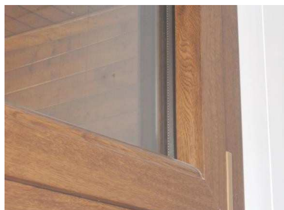
28. Dettaglio serramento esterno