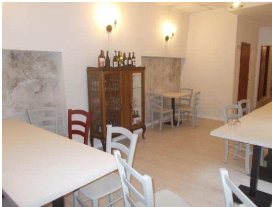
25. Seconda sala ristorante