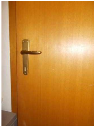
39. Porta interna