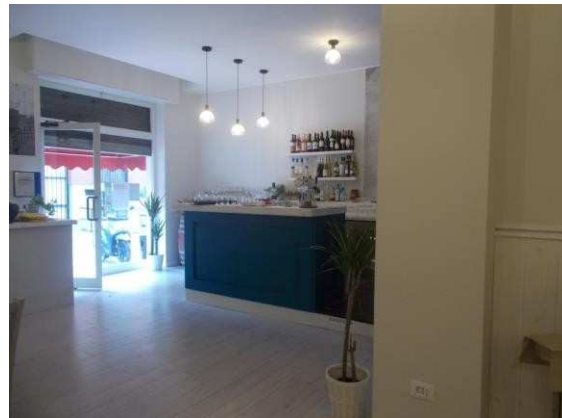
8. Panoramica verso l'ingresso