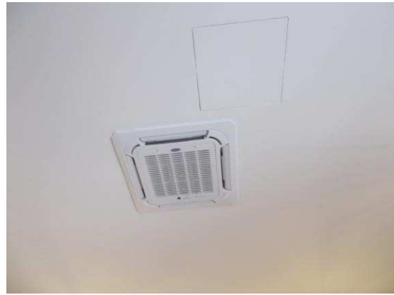
12. Dettaglio bocchetta di aerazione