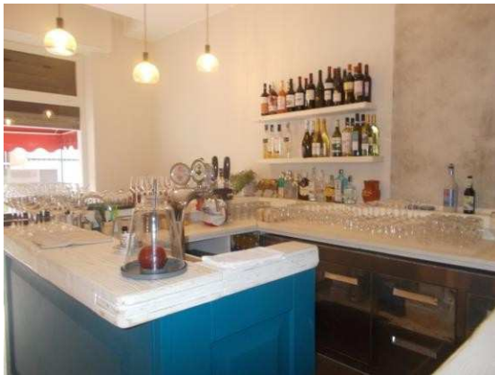
7. Bancone bar all'ingresso