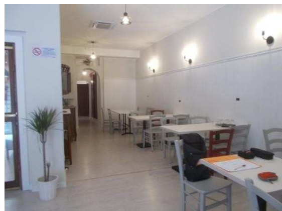
10. Sala ristorante