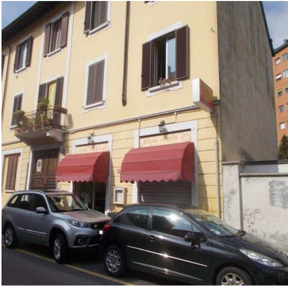
1. Facciata esterna dell'intero fabbricato