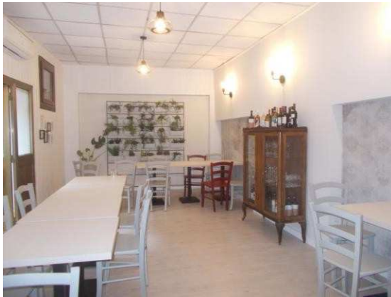
23. Seconda sala ristorante