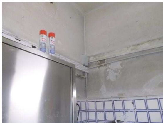
17. Pareti della cucina