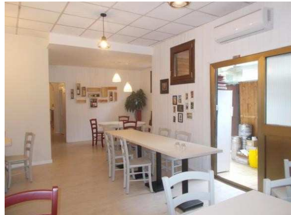
24. Seconda sala ristorante