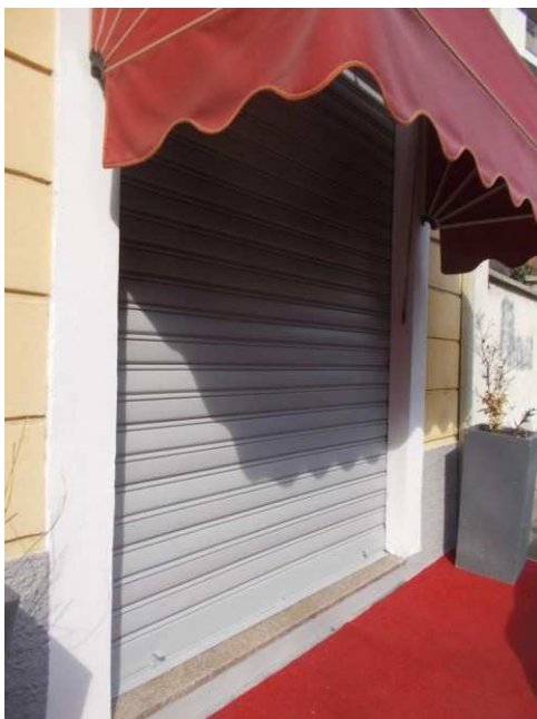
3. Vetrina dell'immobile pignorato