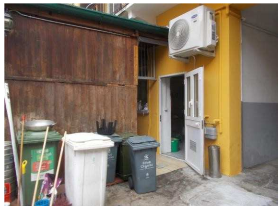
34. Accesso alla cucina dal cortile