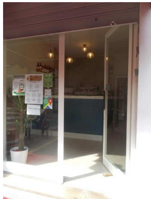
4. Vetrina dell'immobile pignorato con porta di ingresso