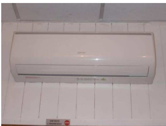
27. Split di condizionamento