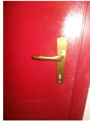
38. Porta interna