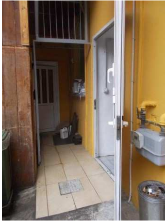
35. Superficie coperta