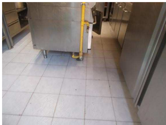
18. Dettaglio pavimento della cucina