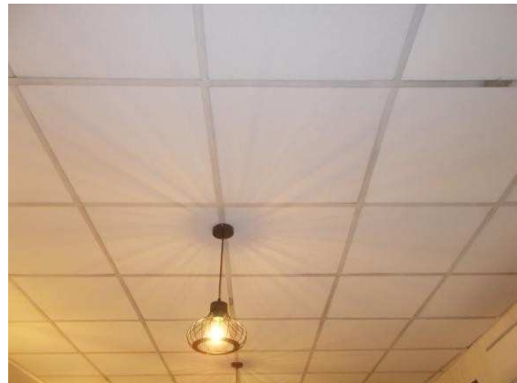
26. Dettaglio controsoffitto sala ristorante