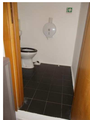
22. Bagno handicappati