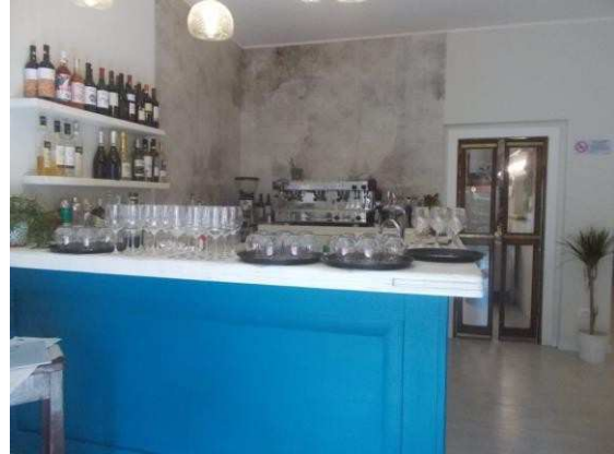
6. Bancone bar all'ingresso