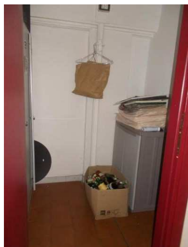
21. Antibagno handicappati